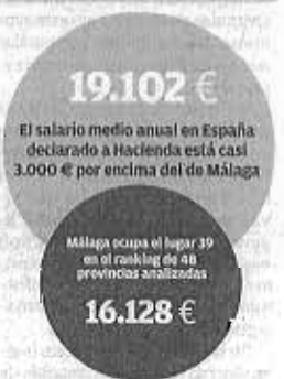
Salario medio anual en España y en Málaga

El estancamiento de los sueldos también ha provocado otro efecto cuando menos inquietante. En el año 2007, un trabajador malagueño presentaba unos ingresos brutos mensuales superiores en más de 400 euros a los de un jubilado de la provincia. Esa diferencia se ha re-