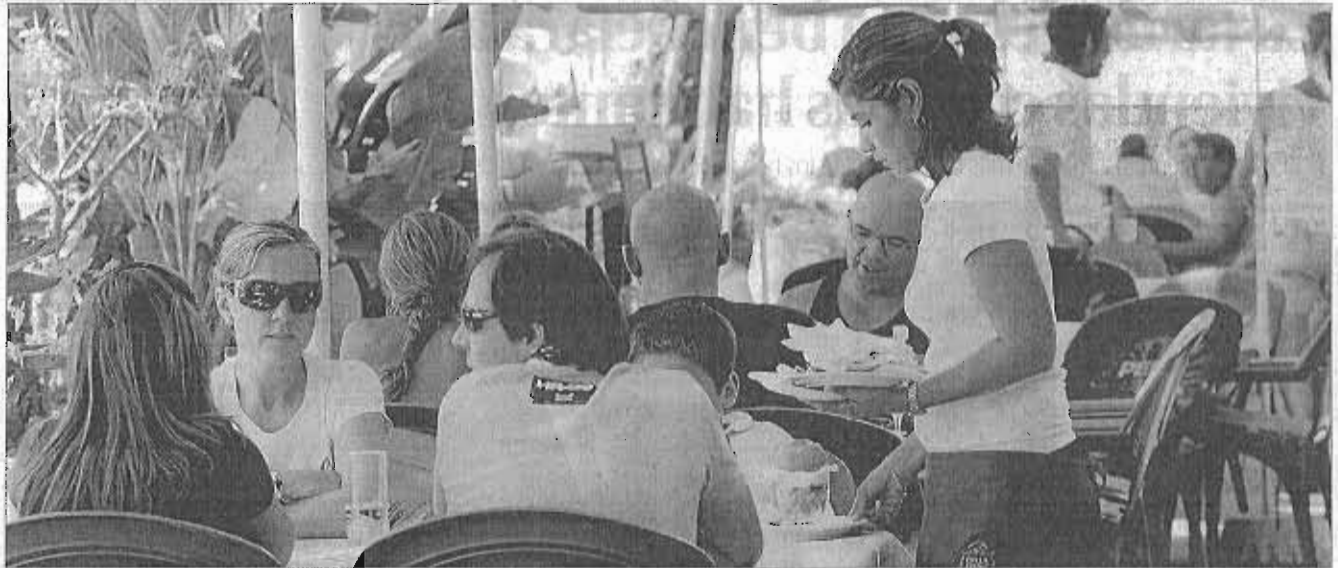
Los trabajadores de los chiringüitos, un ejemplo de empleos centrados en la temporada alta turística. ANCIENGA