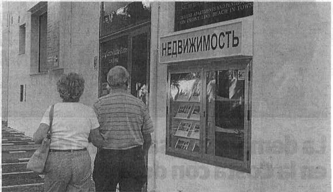
Una pareja pasa ante una inmobiliaria con carteles en ruso en Puerto Banús.