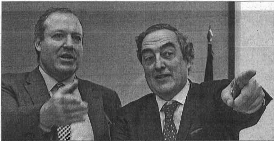
El presidente de Cepyme, Jesús Terciado, y el de la CEOE, Juan Rosell, charlan ayer en la patronal.