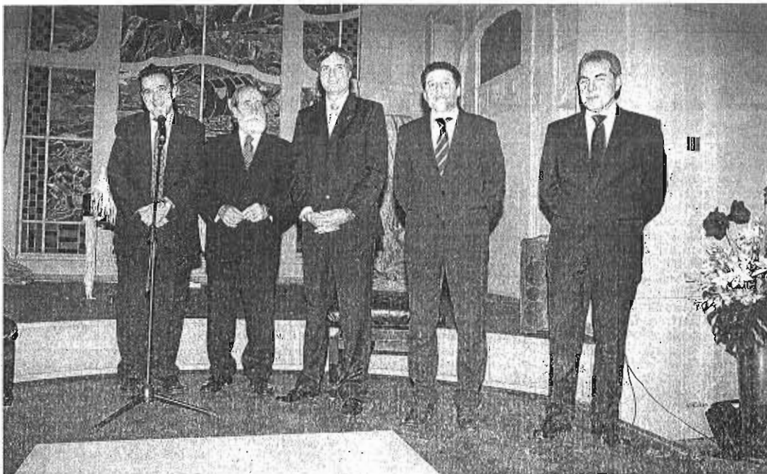
Un momento de las intervenciones en el acto organizado por SUR, que se celebró ayer en el hotel Europa.