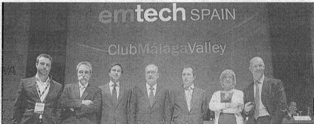
El Club Valley y la conferencia EmTech vuelven a ir de la mano por segundo año consecutivo. :: SUR