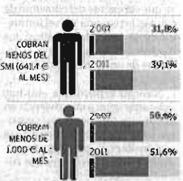
Salario medio anual en Málaga