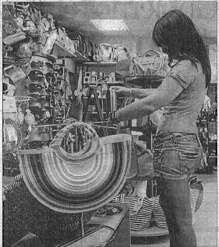
Una mujer compra en un comercio del Centro.