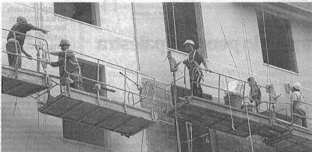
Promotores y particulares tendrán que pagar por nuevos conceptos de los permisos de obra según lo previsto por Urbanismo.