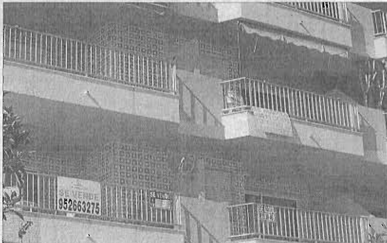
Varios pisos en Fuengirola con carteles de «se vende». J. L. JIMÉNEZ