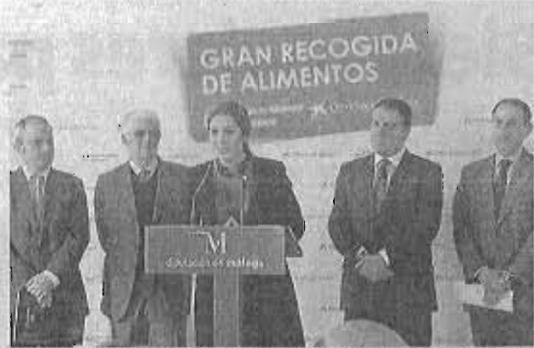
Estrella Morente, durante la presentación de La Gran Recogida.

Morente no solo colaborará en la promoción. Los dos días de la Gran Recogida será una voluntaria más «con camiseta y mandil» y estará en un punto de información en Granada uno de los días y en otro en Málaga. Y es que la campaña, que