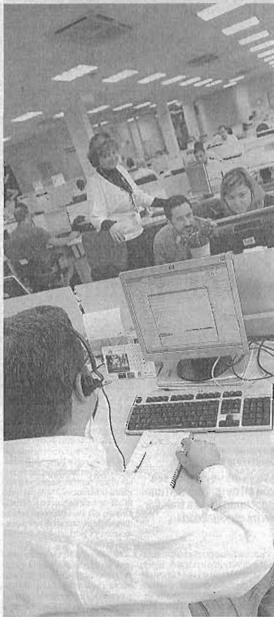
Casi 600 personas trabajan en el centro del PTA.

► En el mundo. Tiene 236.000 personas en 120 países.