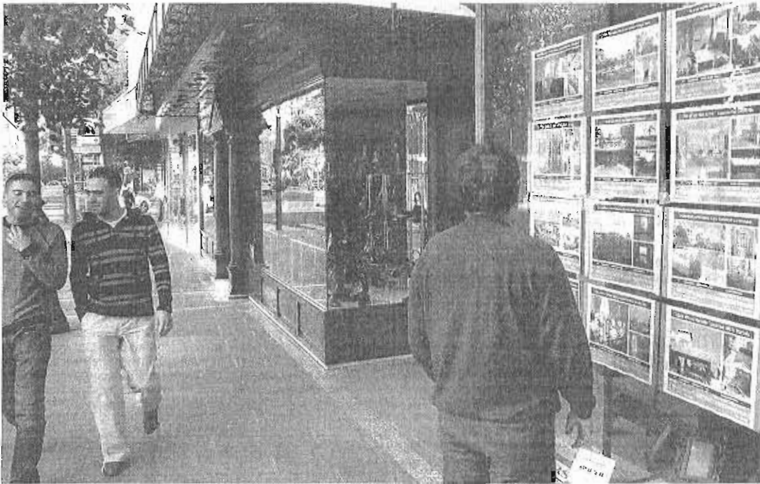
El mercado ruso ha puesto sus miras en la Costa del Sol, relanzando el turismo residencial.