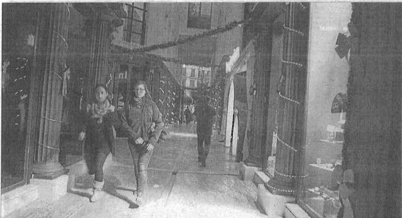
Muchas tiendas del Centro aparecen engalanadas con adornos navideños desde hace días, a la espera de que empiece la campaña el 1 de diciembre. CARLOS CRADO