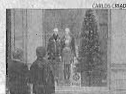
Un escaparate adornado.

■ Ya no hay un periodo obligado para poner las rebajas, ni una franja mínima de descuentos, ni restricciones sobre qué productos están o no sujetos a estas promociones. La liberalización del comercio es total y las tiendas de Málaga aprovecharán la nueva legislación aprobada por el Gobierno de Rajoy para adelantar las rebajas en Navidad, con la esperanza de aumentar las ventas en una campaña que se prevé limitada, por la difícil situación económica que atraviesan muchas familias. Pero el pequeño comercio no se