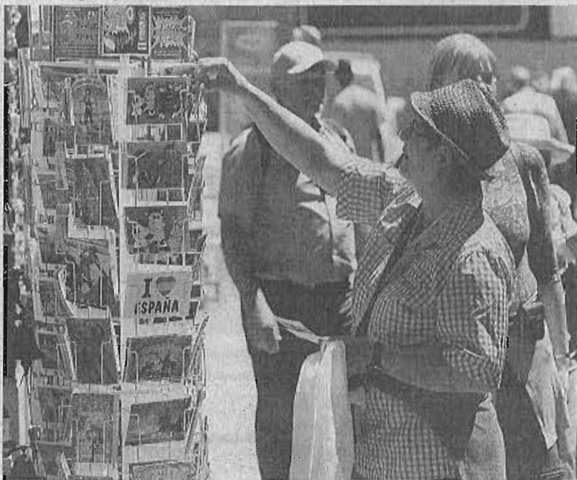
Una crucerista aprovecha la escala en Málaga para llevarse unos recuerdos de la ciudad.

Así, en los nueve primeros meses del año el número de cruceristas des-