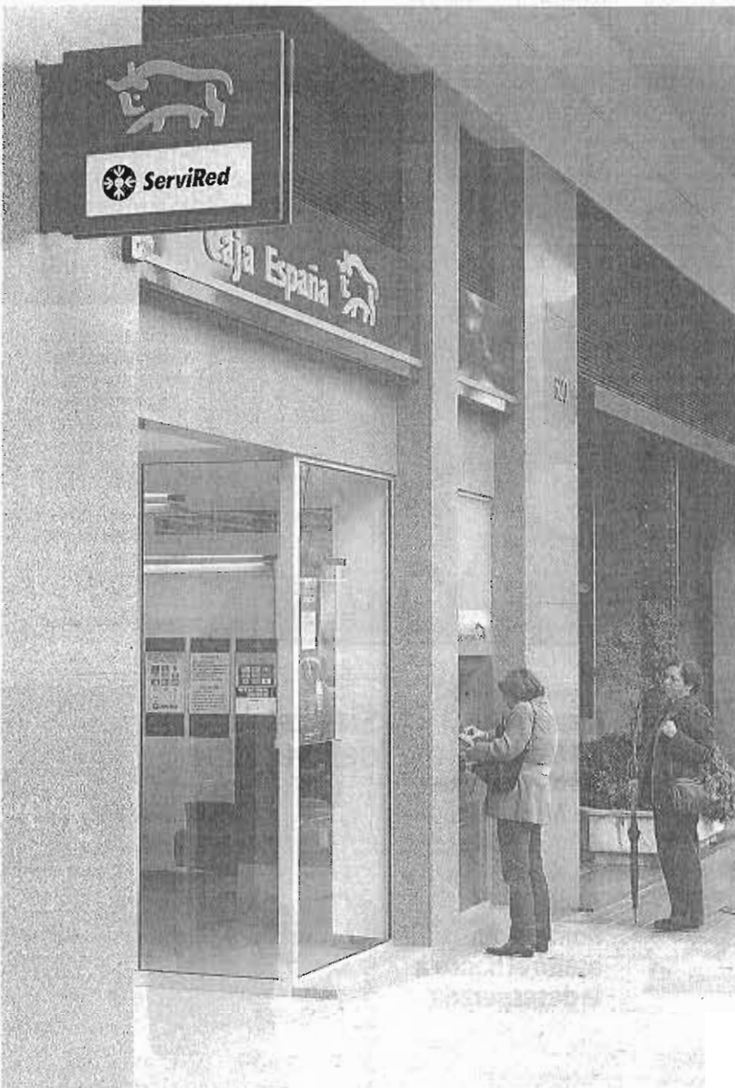
Caja España-Duero tendrá que afrontar un proceso de reestructuración bajo supervisión europea. :: sur

Las cinco entidades fundadoras del Sareb aportan en conjunto 430 millones de euros de capital en esta primera fase. Mientras, el FROB pone otros 397 millones en el inicio del 'banco malo', que estará capitalizado con un total de 827 millones para proceder a la transmisión de los activos 'tóxicos' de Bankia, Catalunya Caixa, Novagalicia y Banco de Valencia, prevista para antes del 31 de diciembre. «Prácticamente todas las principales entidades financieras y aseguradoras en España participarán en el capital de la sociedad. La buena respuesta del sector permite augurar un desarrollo adecuado y rentable del Sareb», indicaron ayer desde el Ministerio de Economía.