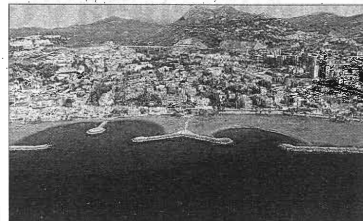
Vista aérea con las casas de Pedregalejo en primera línea.