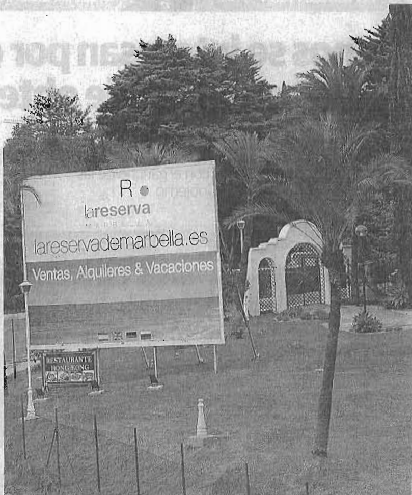
Acceso a la urbanización La Reserva de Marbella, del Grupo Peñarroya.

En este punto, cabe reseñar que la medida en sí consistirá en una simplificación de los trámites administrativos que ahora debe cumplir un ciudadano extracomunitario que quiera comprarse una casa en España y, lógicamente, disfrutarla el máximo tiempo posible. A día de hoy, las trabas burocráticas solo le permiten hacerlo de dos formas: entrar en el país con un visado de turista que da derecho a una estancia máxima de 90 días, de forma que una vez expirado el plazo deben regresar a su país y volver a solicitar uno nuevo; o bien conseguir un permiso de residencia temporal no lucrativo, con una vigencia de un año y que les obliga a cumplir una serie de requisitos como pasar en España al menos