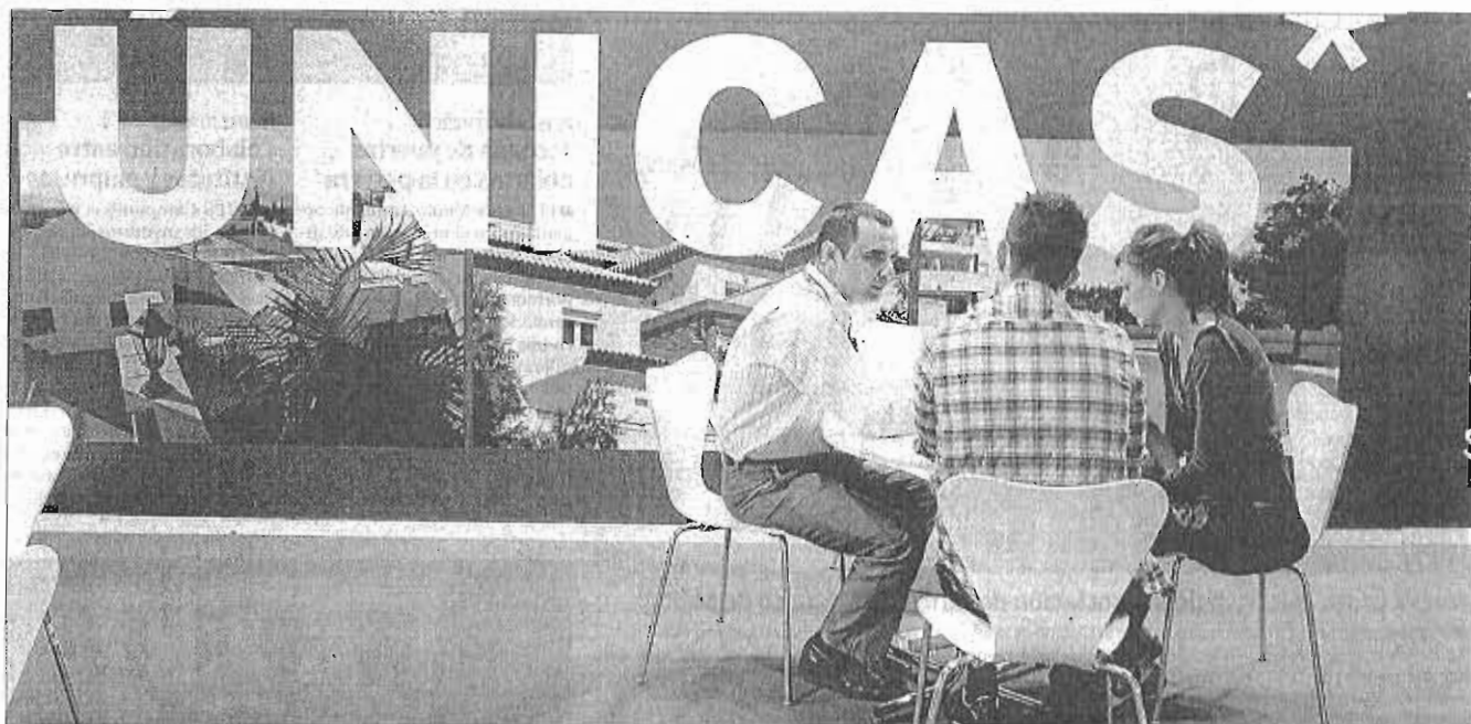
Ciudadanos consultan las condiciones de una vivienda a la venta en una pasada edición de la feria Inmobiliaria Simed de Málaga. GREGORIO TORRES