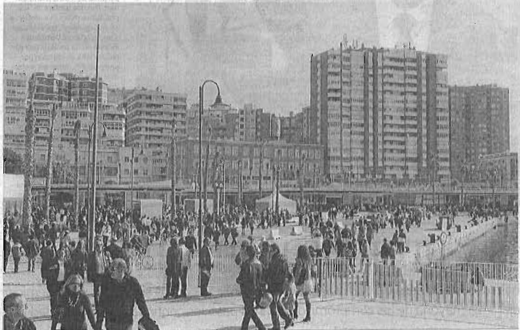
El punto de confluencia de los muelles 1 y 2 del puerto de Málaga, donde podrán parar los autobuses de cruceristas.

Reordenará el tráfico en el espacio portuario para que los autobuses que parten de la estación marítima con destino al Parque puedan detenerse en el centro comercial