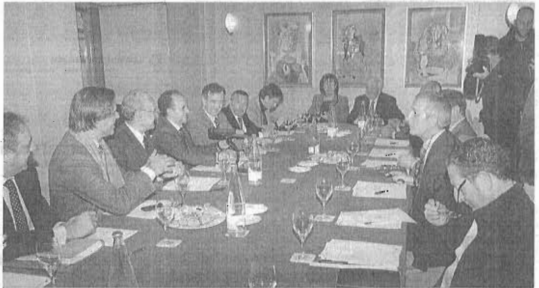
Celebración del Foro de Turismo de Málaga, ayer.

Los establecimientos hoteleros y casas rurales de Andalucía incrementaron, del 25 al 31 de diciembre, el número de pernoctaciones en un 10,2% respecto al mismo periodo del año anterior, hasta las 646.715 estancias. Según la encuesta de ocupación publicada por el Gobierno andaluz, el grado de ocupación total de las plazas ofertadas alcanzó el 45,4%, casi cinco puntos por en-