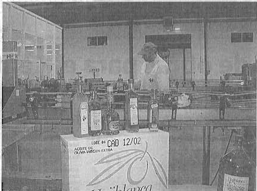
Sala de envasado de Hojiblanca en su sede de Antequera.

Además, Competencia arguye que el reforzamiento del vínculo estructural entre ambas compañías podría «cerrar o dificultar el acceso al mercado de aceite a granel (en el que tiene una fuerte posición la cooperativa malagueña) a otros operadores». Su informe incluso aventura que la presencia de Hojiblanca en el consejo de administración de Deoleo podría dar lugar a un intercambio de información sensible entre ambas empresas, lo que les permitiría «reducir la presión competitiva recíproca».