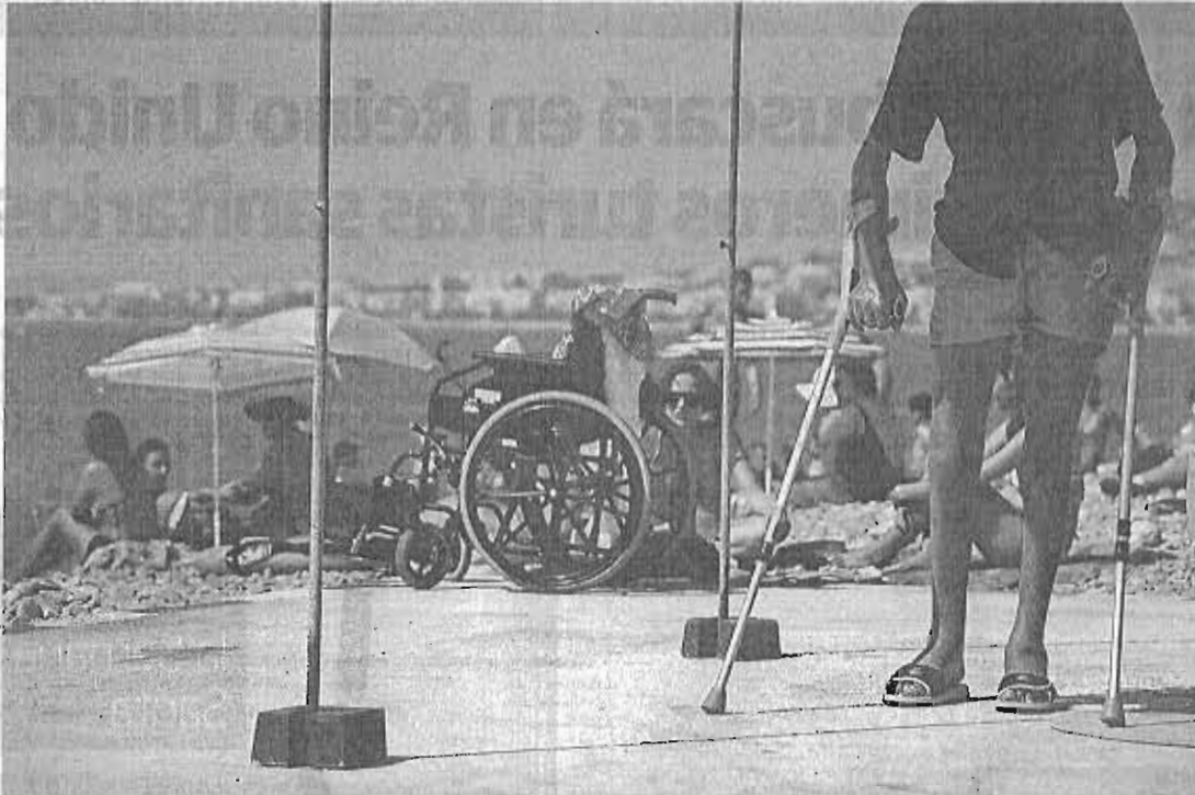
El turismo sanitario podría dejar anualmente unos 250 o 300 millones de euros al año en la provincia de Málaga. :: REUTERS