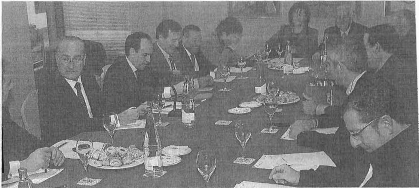
El alcalde de Málaga presidió la reunión del Foro de Turismo a la que asistió ayer el consejero por primera vez.