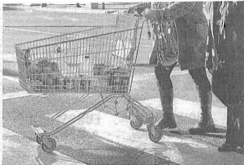
La escalada de precios ha contribuido al panorama constatado por el INE. ■ ÓSCAR SOLÓRZANO