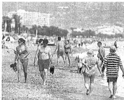
Bañistas en Torremolinos.

El consejero de Turismo anuncia una reunión la semana que viene para intentar arrojar luz al futuro del Qualifica, pero no confía en un desenlace positivo. "El plan tiene previstas unas actua-