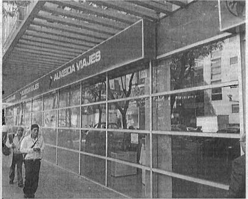
Fachada de una oficina de Almeida Viajes en México.