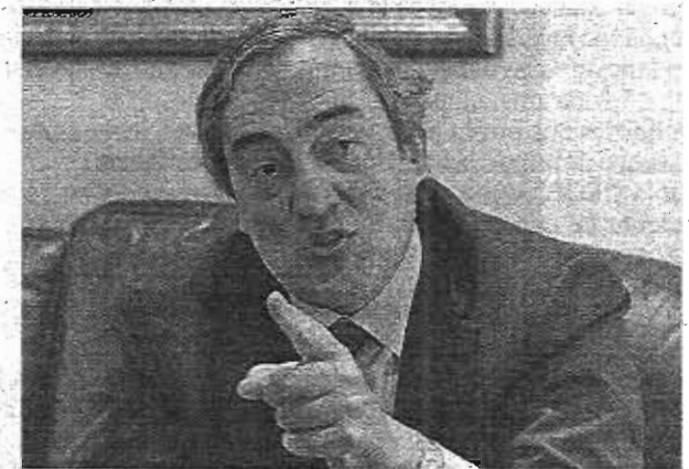
El presidente de la CEOE, Juan Rosell.

CEOE defiende que es necesario “racionalizar los interlocutores en el mundo empresarial”