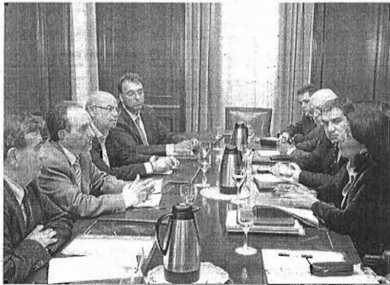
Reunión del consejero con la secretaria de Estado de Turismo, Isabel Borrego, a finales de diciembre.

El ministro de Industria, Energía y Turismo, José Manuel Soria, anunció el pasado 27 de diciembre que se había comenzado a tramitar la modificación de la normativa para dar cabida al capital privado en el organismo de promoción. Durante su comparecencia en el Congreso de los Diputados, Soria dio a conocer la creación de un consejo asesor integrado por 11 miembros, de los cuales cinco provendrían del sector