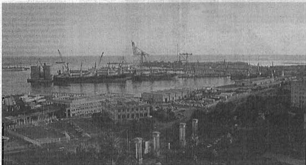
Vista del puerto de Málaga.