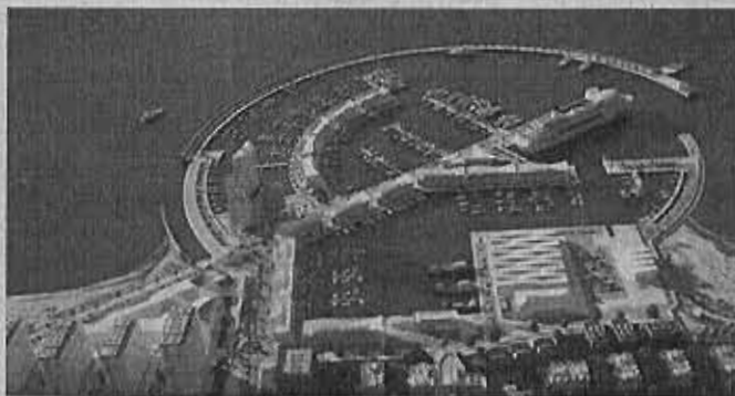
Recreación del puerto deportivo La Bajadilla tras la ampliación proyectada.

Actualmente, a través de la empresa Nas Marbella está explotando el puerto, que cuenta con casi 300 atraques, además de una marina seca y una zona de uso pesquero. Por la utilización de este espacio de dominio público tiene la obligación de pagar un canon