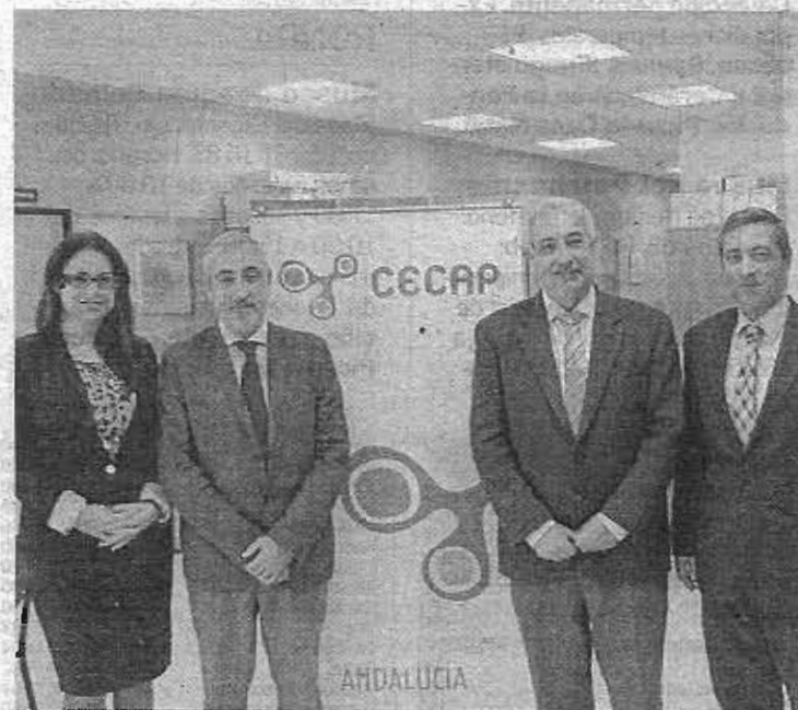
La cúpula directiva de esta patronal, ayer en la sede de la CEM.