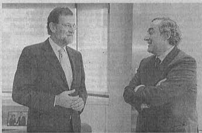
El presidente del Gobierno, Mariano Rajoy, con el líder de la patronal CEOE, Juan Rosell.

La organización que preside Juan Rosell sostiene que este método de compensación de la deuda para las empresas no perjudicaría al objetivo del Gobierno de reducir el déficit público. "La cantidad compensada contra el Tesoro Público [por las compañías y los profesionales] será recuperada por éste mediante la reducción de las transferencias que la Administración Central debe realizar a las comunidades