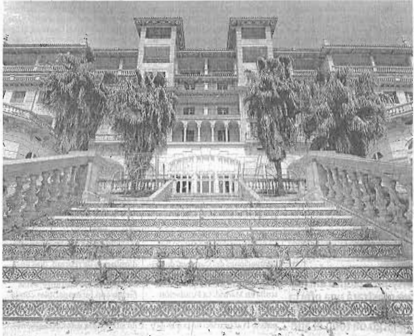
Vista de los jardines y una de las entradas del Miramar .

El presidente de esta cadena hotelera trasmitió un mensaje firme de tranquilidad sobre el desarrollo