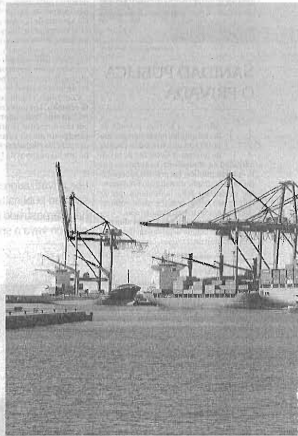
Imagen de archivo de un día de plena actividad en el muelle de contenedores.

En este escenario, se optó por realizar una batimetría (estudio de las profundidades) en 2009 para confirmar que estos trabajos de calado tampoco coincidían con los contratados y liquidados. Esta es otra de las acciones que