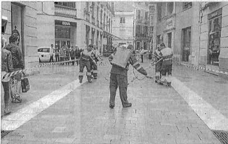
Operarios de Limasa trabajando en el Centro.