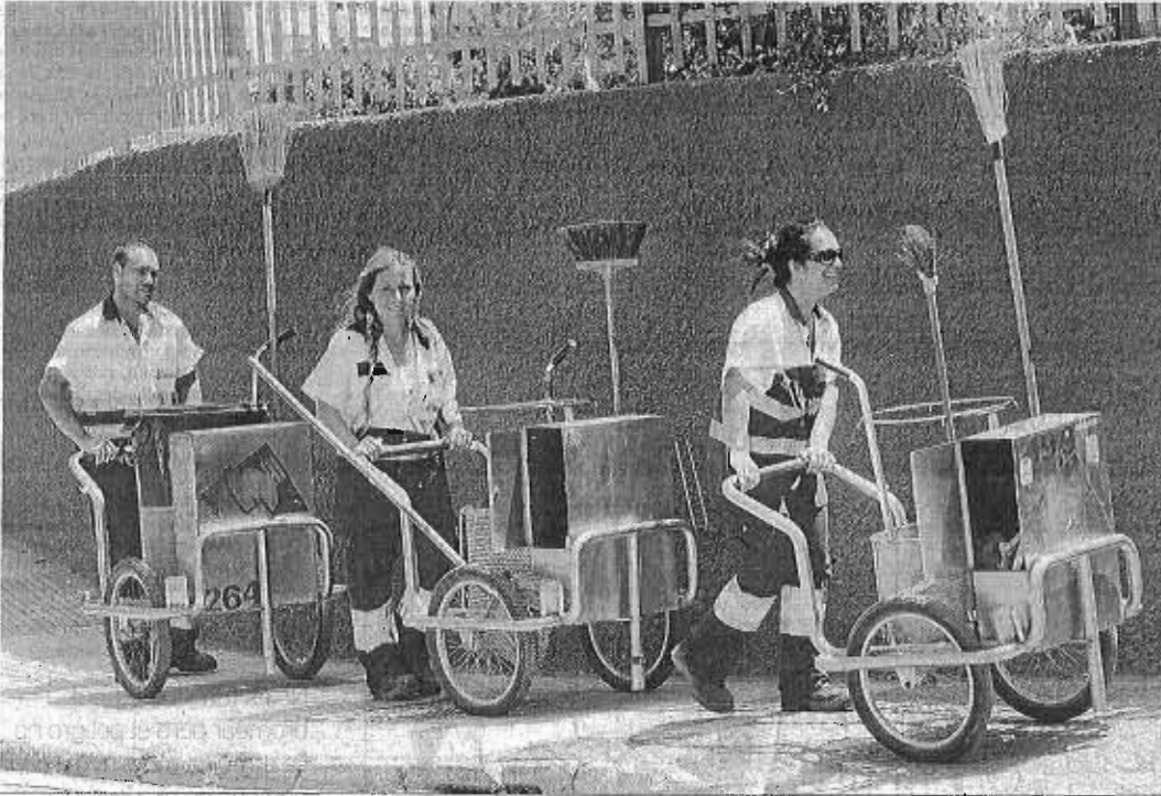
Una cuadrilla de operarios de Limasa en una calle de la capital.

● La dirección de la empresa y los empleados constituyeron ayer la mesa de negociación ● La supresión de la cláusula para heredar los puestos será uno de los puntos más polémicos