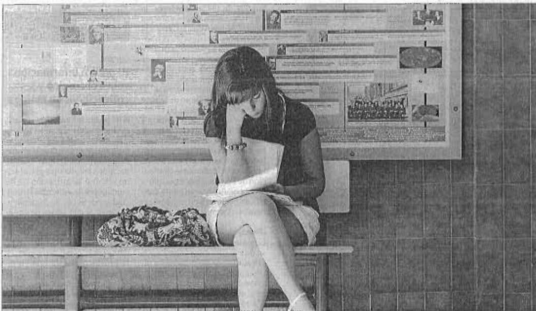
La temporalidad afecta principalmente a los jóvenes que se incorporan al mercado laboral. CARLOS CRIADO