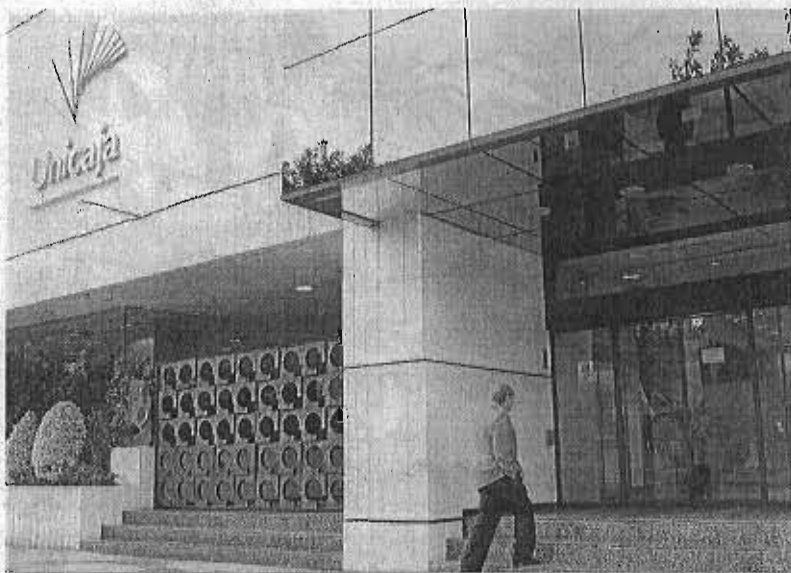
La oficina central de la entidad financiera en la capital malagueña.

Sin embargo, el sindicato CCOO que rechaza que el esfuerzo de los ajustes recaigan en la plantilla y pide una política comercial que sirva para incrementar los ingresos, afirma que en esa primera reunión se expuso "someramente la situación general del sector, la de Unicaja -basadas en puras proyecciones y no en datos concretos- y las exigencias que el MoU (el Memorandum de Entendimiento entre el Gobierno de España