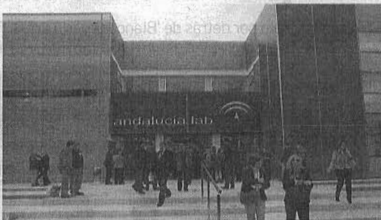
Entrada del Andalucía Lab.

Hasta la fecha se han recibido más de un centenar de respuestas, según informó ayer la Consejería de Turismo de la Junta, de la que depende el centro de innovación. Entre las principales conclusiones que se extraen destaca la buena acogida que tiene la formación en nuevas tecnologías que desarrolla el Andalucía Lab, y más específicamente todo lo relacionado con la comercialización en internet.