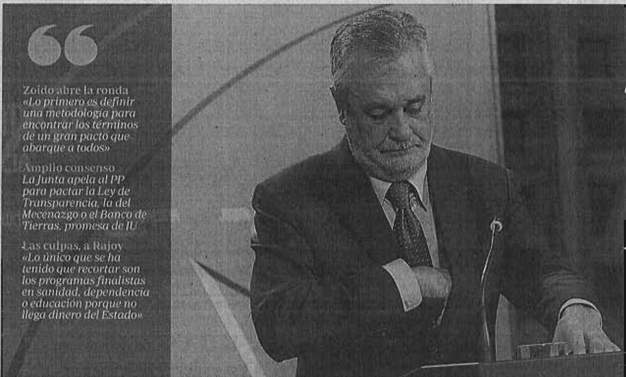
José Antonio Griñán, en la rueda de prensa que ofreció ayer en el Palacio de San Telmo al término del Consejo de Gobierno