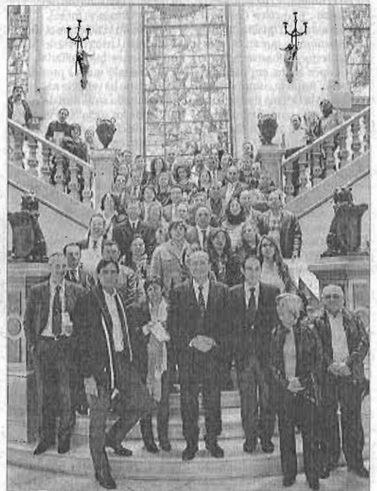
Imagen de familia de las 114 empresas certificadas.

Este año además se suman a estas certificaciones unos 60 taxistas de la capital, que en los cuatro años de este sistema se han ido adheriendo para mejorar la calidad del servicio. Como novedad está la inclusión de la primera empresa de servicios náuticos de la ciudad, como Málaga Charter, especializada en el alquiler de barcos sin patrón en la provincia.