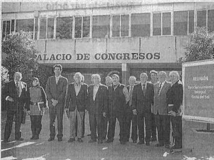
En el foro participan colectivos privados, empresarios y entidades públicas. S.M.C.U.