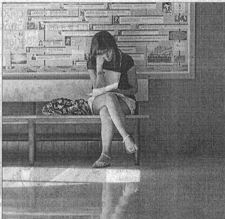
Los jóvenes se plantean cada vez más buscar trabajo fuera.

Desde que comenzó la crisis, el número de demandantes de empleo para trabajar fuera de España se ha duplicado, tendencia que se ha intensificado en mayor medida durante los dos últimos años. A nivel provincial, Girona, Las Palmas y Soria son las zonas en las que más se ha incrementado el número