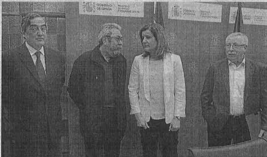
La ministra de Empleo, Fátima Bañez, y los agentes sociales escenificaron ayer los compromisos

Más formación Empleo pondrá en marcha ayudas para «repescar» a los jóvenes que abandonaron sus estudios