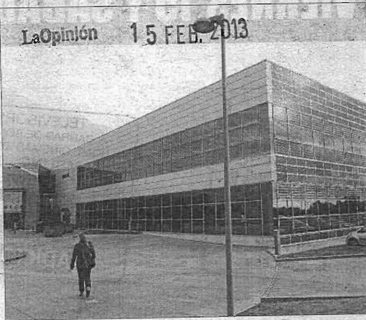
La sede de Isofotón en el PTA de Málaga. ARCINIEGA

Fuentes de Isofotón, por su parte, señalaron que ya el pasado 5 de febrero, cuando se anunció el deseo de presentar un ERE para 380 trabajadores, se dijo que además «se iban a iniciar las negociaciones para acordar una refinanciación de su deuda con proveedores y así asegurar su viabilidad y mejorar su eficiencia a nivel mundial frente a la actual coyuntura que está viviendo el sector fotovoltaico y la economía en general».