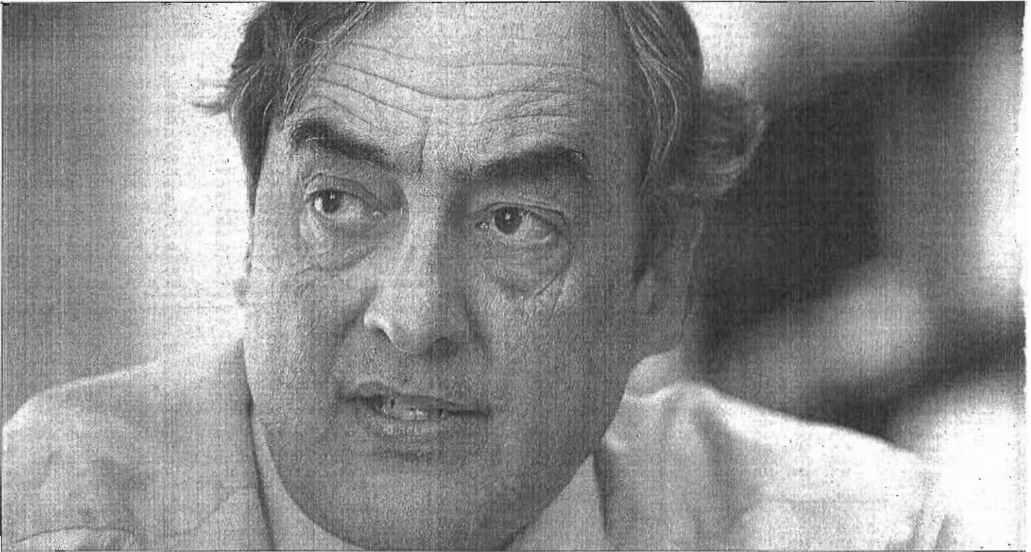
Juan Rosell Presidente de la CEOE