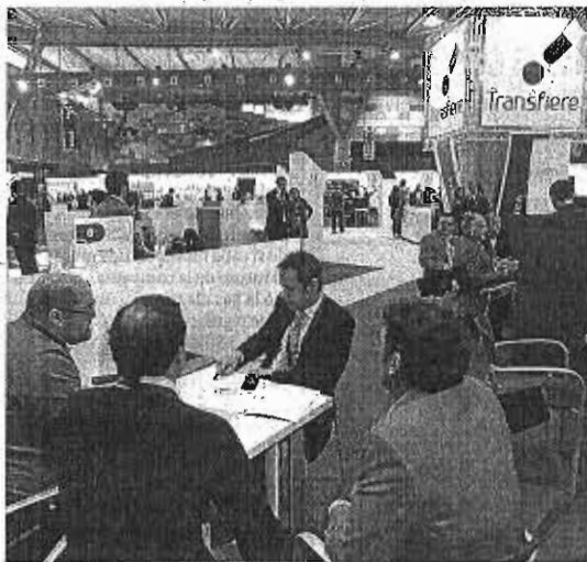
Participantes conversan en una de las mesas. :: SALVADOR SALAS

Transfiere volverá a Málaga los días 12 y 13 de febrero de 2014, adelantó el presidente del comité organizador, matizando algunos aspectos: «Queremos impulsar la participación internacional y seguir sondeando el mercado para incorporar aquellos contenidos y herramientas que sigan haciendo del foro un elemento puntero dentro de su disciplina». El foro crece a pasos de gigante, y Málaga es testigo de ello.