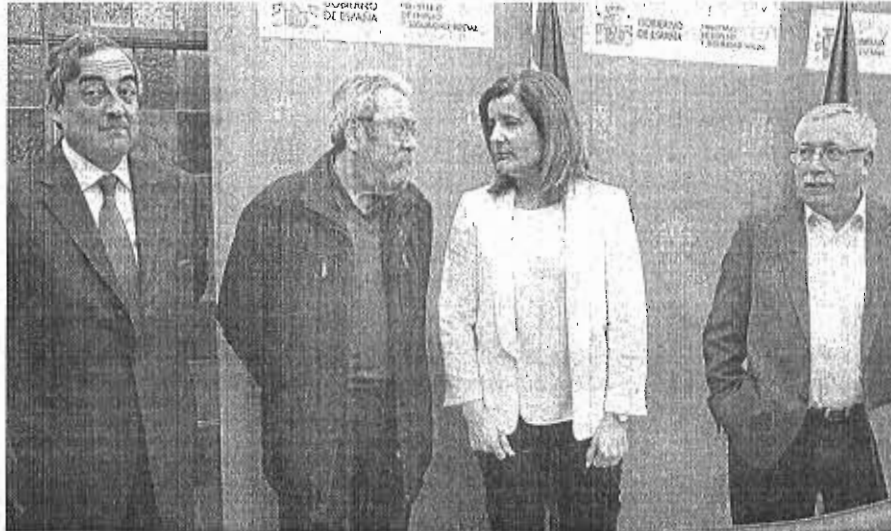
De izquierda a derecha, el presidente de la CEOE, Juan Rosell; Cándido Méndez, secretario general de UGT; la ministra de Empleo y Seguridad Social, Fátima Báñez, e Ignacio Fernández Toxo, secretario general de CCOO, ayer, antes de cerrar el plan de empleo juvenil.

En este contexto, el plan de lucha contra el paro juvenil tiene quince medidas que el Gobierno denomina como de choque , en las que se invertirán 1.750 millones de euros en los próximos cuatro años. Medidas que, como adelanto EXPANSIÓN el 5 de febrero recogió desde estímulos a la contratación, planes de autoempleo y emprendimiento, además de programas de for-