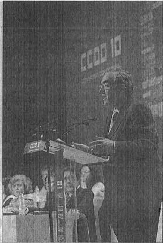
El presidente de CEOE, Joan Rosell.

Por último, el representante de los empresarios consideró que los agentes sociales tienen que ser "más atrevidos" y aseguró que pueden mejorar la negociación colectiva. "Es ahí donde valemos", matizó Rosell. Y es que a través de los