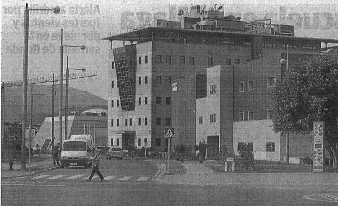
Edificios en el Parque Tecnológico de Málaga. :: SUR