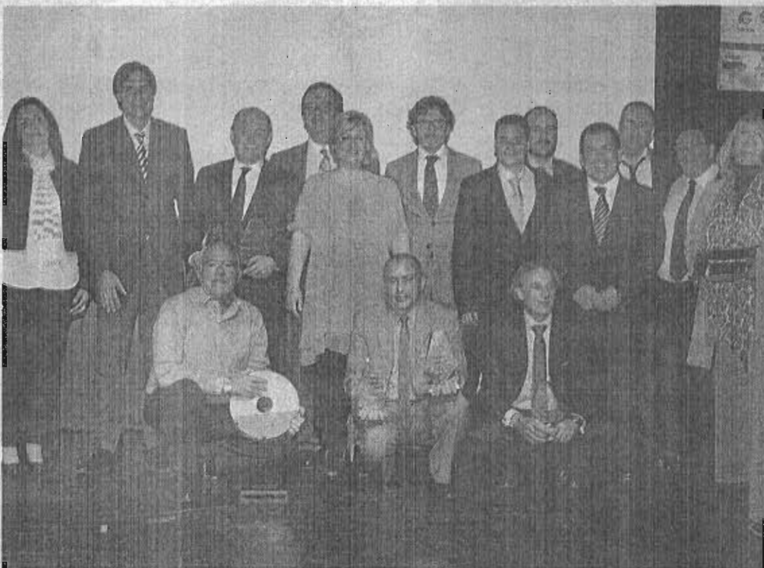
Foto de familia de los galardonados, organizadores y de asistentes a la sexta edición de los Premios Excellence de Cruceros.

tomaron asiento en el Auditorio donde se proyectó un video de presentación que dio paso a una actuación del tenor Miguel Borrallo. Con un hilo conductor sobre las ingentes cantidades que mueve esta industria en alimentos, pasajeros o litros de pintura para embellecer un crucero, la entrega de premios arrancó con el que reconoce la 'Mejor relación calidad y precio', que fue a parar a Iberocruiseros, que recibió la distinción el vicepresidente de Ventas de Costa