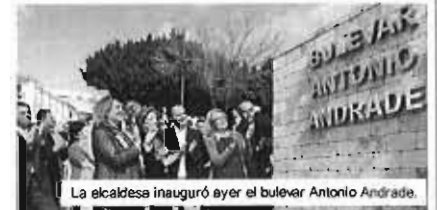
La alcaldesa inauguró ayer el boulevard Antonio Andrade.