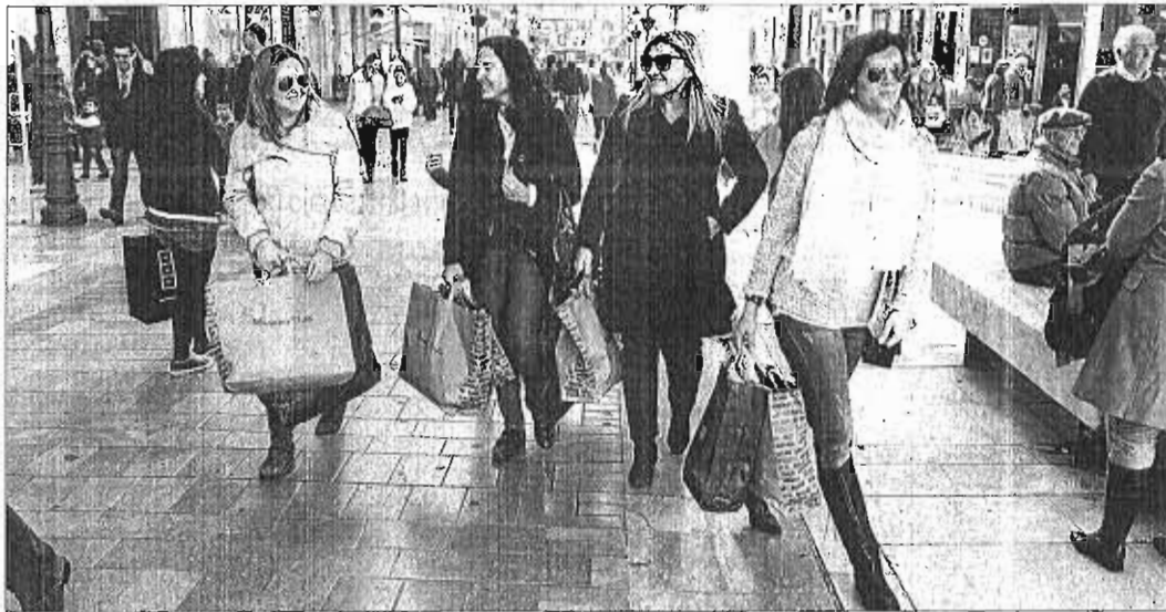
La crisis económica actúa como un rodillo que se lleva por delante miles de comercios cada año. ARGEMIGA