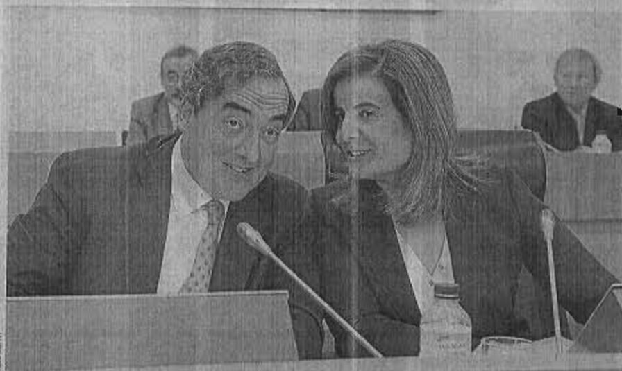
La ministra de Empleo y de Seguridad Social, Fátima Báñez, con el presidente de la CEOE, Juan Rosell, en la Junta Directiva de la patronal.