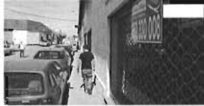
Un hombre camina junto a un local cerrado. Arciniega

JOSÉ VICENTE RODRÍGUEZ Málaga ha perdido un 16% de su tejido productivo durante los años de crisis, una sangría que ha rebajado el número de compañías con trabajadores que cotizan a la Seguridad Social en 44.474 en enero de 2013 o, lo que es lo mismo, las mismas cifras que presentaba la provincia hace una década, allá por el año 2003.