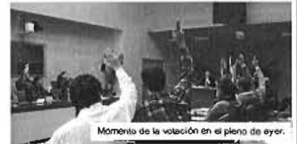
Momento de la votación en el pleno de ayer.