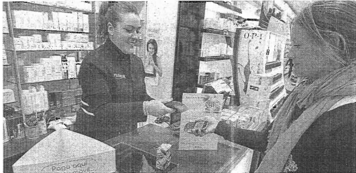
El sistema de pago con móvil está operativo desde el 8 de febrero. :: CARLOS MORET

MÁLAGA. El tiempo parece estar dándole la razón a quienes le auguraban una carrera meteórica a Momo Pocket. Tan solo dos semanas después de su lanzamiento al mercado, la aplicación que permite pagar 'in situ' cualquier producto o servicio desde el teléfono móvil cuenta ya con más de seis mil usuarios registrados dispuestos a realizar sus compras en el centenar de comercios de la capital que desde el pasado 8 de febrero ofrecen a sus clientes la posibilidad de abonar la factura con su 'smartphone'. Una red de establecimientos a los que, de momento, se sumarán los más de 400 negocios que están a la espera de que esta empresa formada por un grupo de ingenieros informáticos dentro del programa Spin-Off de la Universidad de Málaga les instale el 'software' necesario en sus cajas.