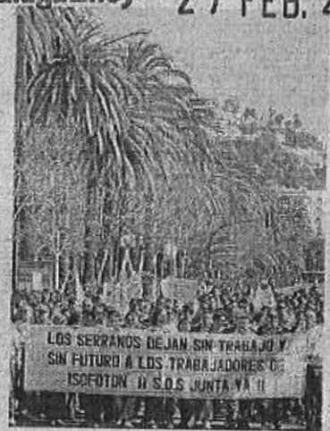
Una protesta, hace diez días.