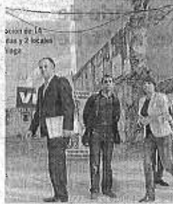
Promoción de la Junta.

regional en esta materia. Porque si pocas son las casas que hoy por hoy tramita el Ayuntamiento, dada la elevada demanda, menor aún es la respuesta por parte de la Empresa Pública de Suelo de Andalucía (EPSA). Este organismo, herramienta de la que se dota la Consejería de Fomento y Vivienda, acaba de iniciar semanas atrás una promoción de 14 pisos en La Trinidad.