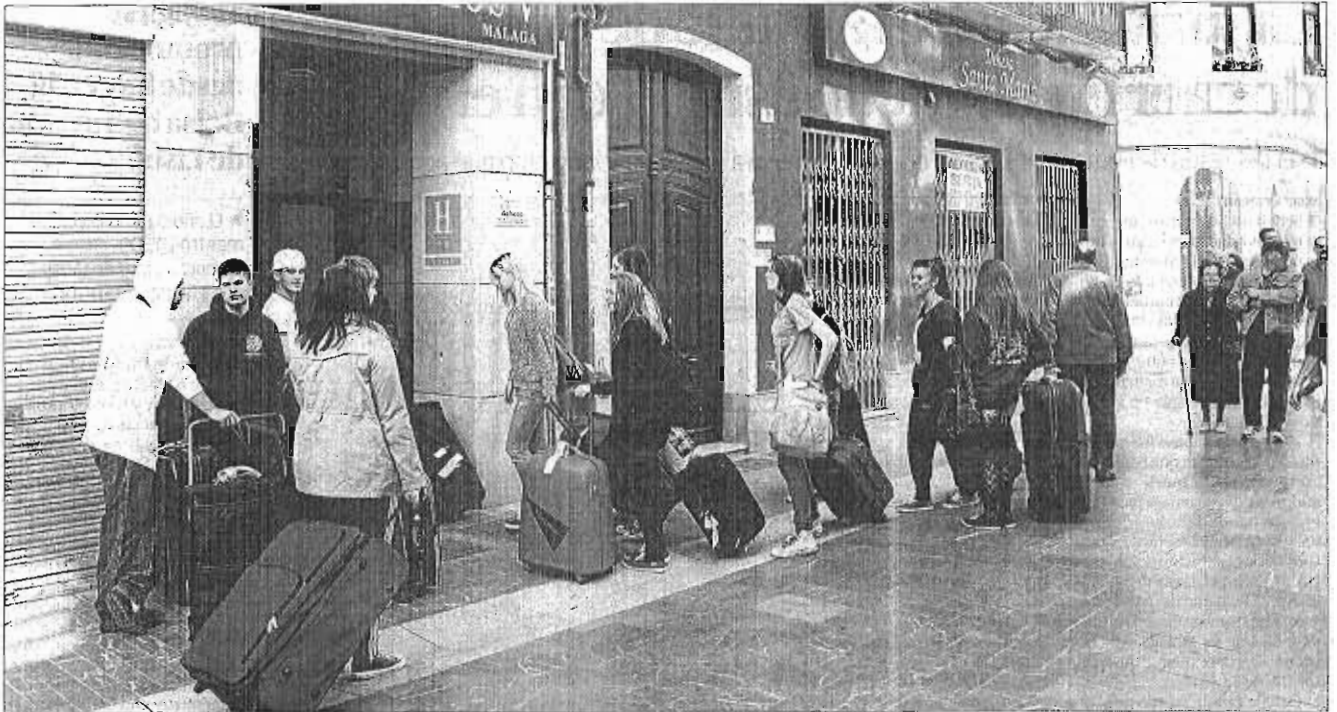
Un grupo de turistas en las inmediaciones de un hotel de la capital. ARKINIEGA