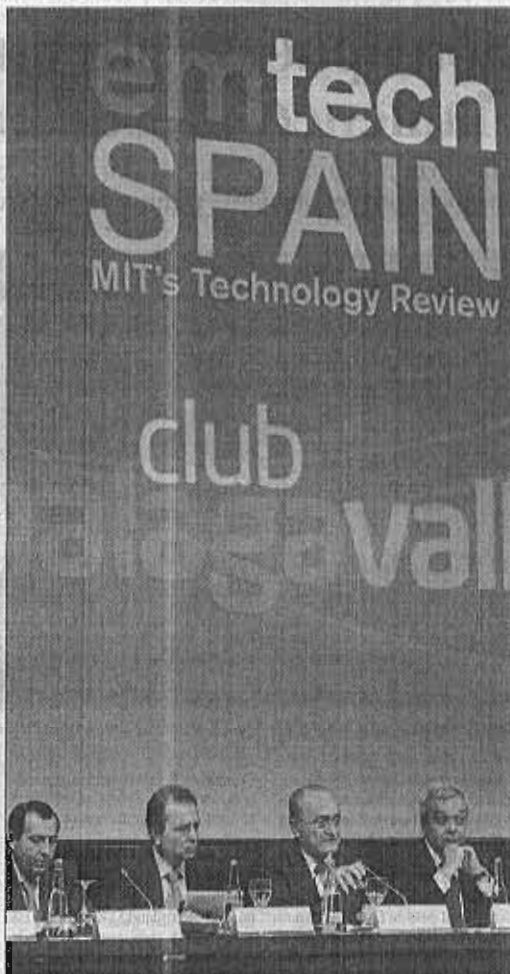
Última edición del EmTech en Málaga.

En el MIT chocó también que se cambiara la fecha de celebración de la última edición, retrasándola hasta el día de Acción de Gracias, una