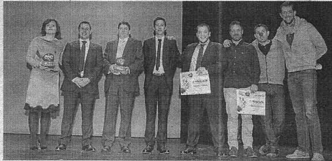
Los premiados, ayer, en el Teatro Cánovas.