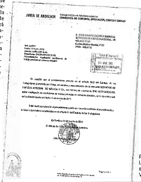
Reproducción del laudo dictado ayer por el catedrático Cruz Villalón. :: SUR

jeretazo de dinero público, Limasa debe acometer una reducción de sus gastos, para lo que entiende justificada la propuesta empresarial de prescindir de su personal eventual. «No solo se produce un cambio en los tiempos de descanso semanal y de disfrute de las vacaciones anuales, sino que, como efecto indirecto, permite reducir o eliminar las necesidades de contratación eventual en la empresa y, con ello, el aborreo en costes de personal que compensa los menores ingresos del Ayuntamiento».