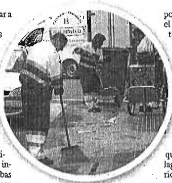
Operarios limpiando una calle de la capital.