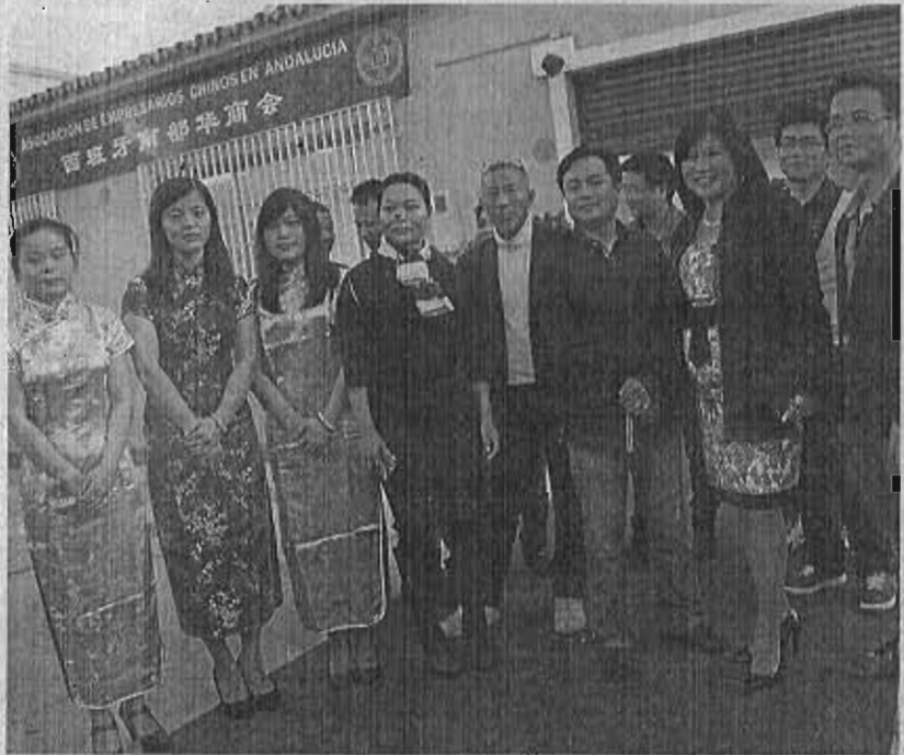
Ayer se inauguró la sede de la asociación en el polígono Guadalhorca. ■ ALVARO LÓPEZ