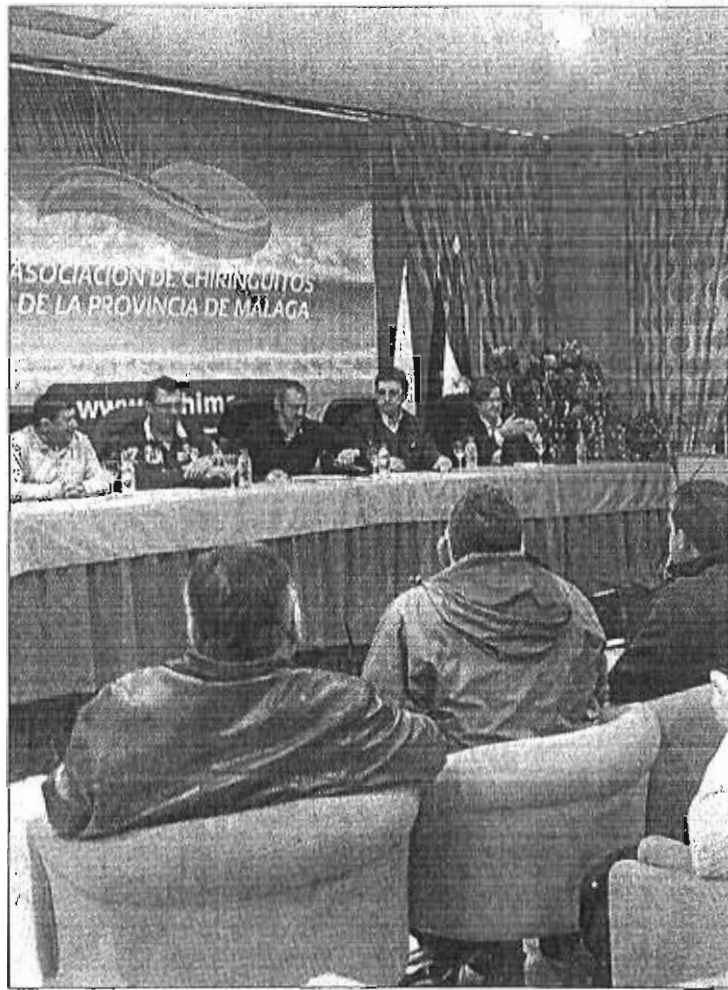
Imagen de la asamblea de ayer. J. L. JIMÉNEZ

Por eso, Achima planteará en los próximos días al órgano regional que se otorgue la concesión por quince años directamente y no por prórrogas.