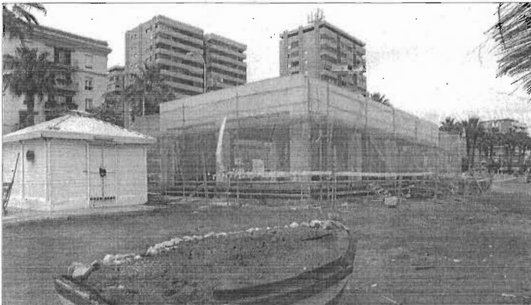
Uno de los polémicos chiringuitos que se construyen en la playa de La Caleta.