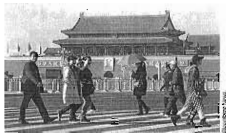
China es ya la segunda economía del mundo por volumen de PIB.

● Valores necesarios. Si has conseguido retener a los mejores es porque gran parte de los profesionales que se interesan por el trabajo en una start up buscan trabajar por proyectos, se sienten más identificados con esos proyectos que con la empresa por su marca. Además, les tienta la posibilidad de colaborar con un equipo de profesionales de primer nivel del que se puede aprender y con el que es posible crecer profesionalmente. ¿Has perdido todo eso?