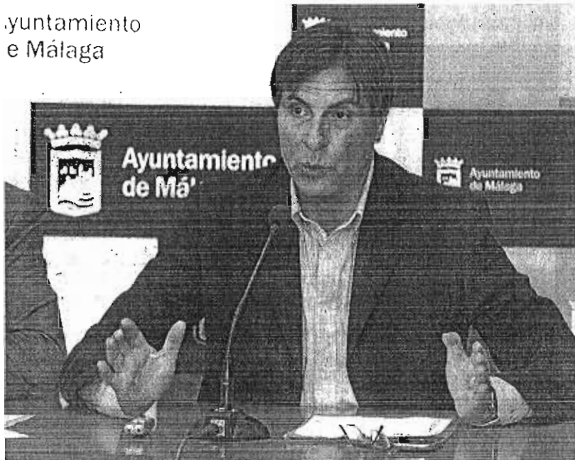
Caneda presenta el primer informe sobre el Impacto del turismo en Semana Santa. :: YHASHINA GARCÍA

to y la atención recibida. De hecho, la Semana Santa se convierte en un reclamo importante para el turismo nacional, dado que el 75% son españoles, y un gancho para fidelizar a estos viajeros. En este sentido, el concejal explicó que el 94% de los que han recalado en Semana Santa asegura que recomendará la experiencia a sus amigos y familiares y un 70% de ellos piensa volver en los próximos tres años.