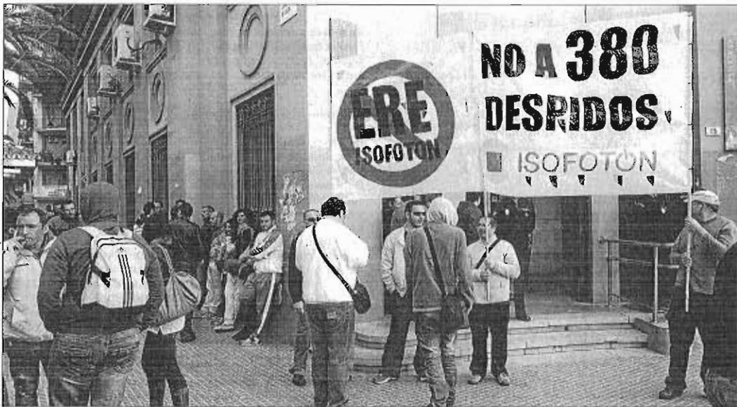
Los trabajadores de Isofotón, concentrados ayer ante la antigua sede central de Empleo, en el Muelle de Heredia. GREGORIO TORRES