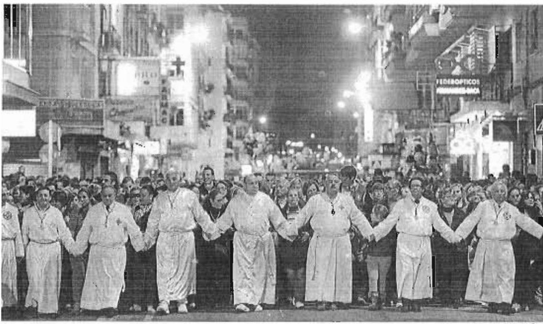
Miles de penitentes, este pasado Lunes Santo, fueron detrás del Cautivo por las calles de la ciudad.