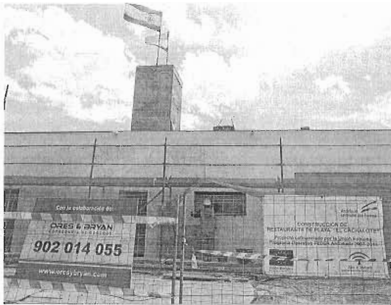
Vista en primer plano de uno de los chiringuitos que se están construyendo.

Salvo esa excepción, el delegado provincial de Medio Ambiente matizó que "hemos seguido las directrices marcadas por Costas cuando tenía las competencias y no las vamos a variar".