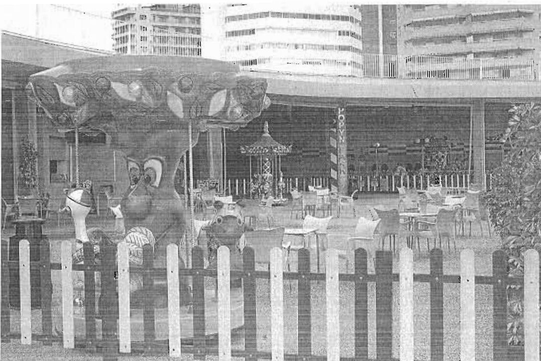
La galería comercial de alta gama irá ubicada en la esquina entre los muelles uno y dos. II JAVIER BOCANEGRA

Cortés reiteró su apuesta por que el metro discorra a cota de calle en ciertos tramos, de forma que se ahorrarán 150 millones hasta La Malagueta y 400 millones hasta El Palos. «Será un transporte público eficaz y rápido, que resuelva la necesidad de movilidad de la población malagueña», añadió.