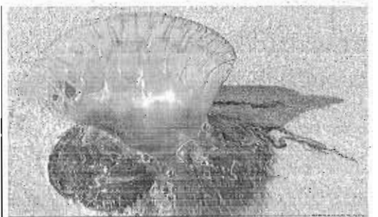
Ejemplar de carabela portuguesa encontrado en una playa.

rismo, quien resaltó que si es posible hacer un plan para evitarlas "ya se hubiera hecho". En este punto, incidió en que el segmento de sol y playa es "fundamental" para Andalucía "y un elemento imprescindible de nuestra oferta turística". Los empresarios de playas de la región consideran que la presencia de estas medusas tóxicas en el titoral suponen "un importante problema que genera daños económicos, además de temores físicos y psicológicos en los turistas".