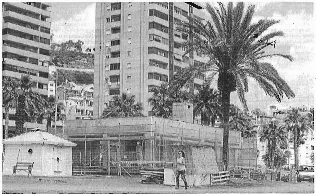
Obra de uno de los chiringuitos que se están construyendo en la zona de La Caleta de Málaga capital.

Pero hasta la fecha y, según confirmó el delegado provincial, "siguen sin hacerse las modificaciones requeridas" en la obra de los chiringuitos, por lo que precisó que "si al final la totalidad de la obra no se corresponde con la concesión que se aprobó inicialmente no se dará. La advertencia del Gobierno autonómico, que desde el 1 de abril de 2011, es la administración competente en autorizar las concesiones en el dominio público marítimo-terrestre, es clara y sin ese trámite tampoco el Consistorio mala-