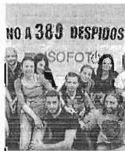
La concentración de ayer.

La Junta ha convocado una reunión urgente para hoy a las 9:30 con la inspección de trabajo para