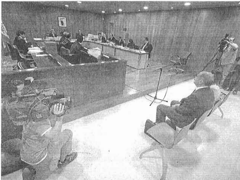
El dueño de Aifos, en el juicio por estafa a los compradores de una viviendas del que salió absuelto.