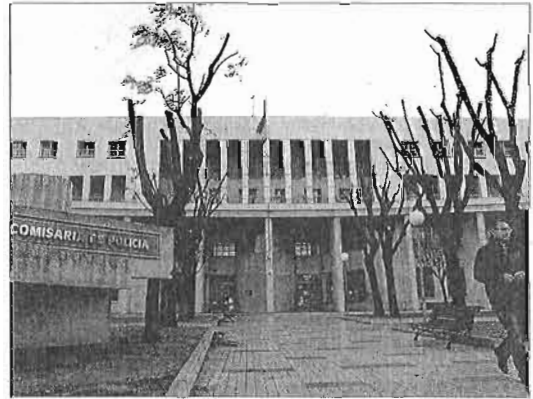
Comisaría Provincial de Málaga.

Esta reclamación se produce días después de que la organización denunciara a nivel nacional que la empresa concesionaria de los servicios de mantenimiento de las instalaciones policiales «in-