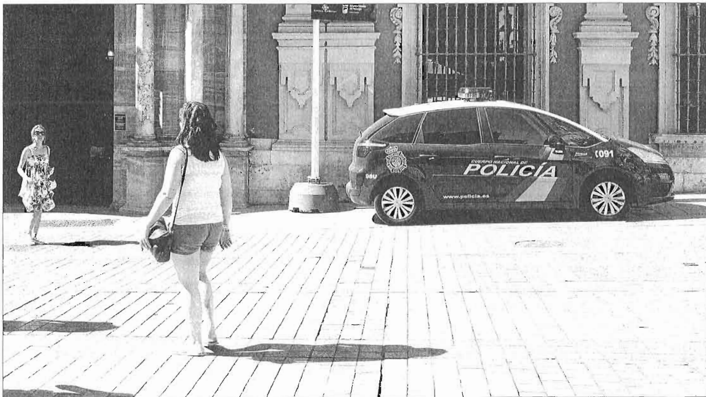
Un coche patrulla de la Policía Nacional estacionado ante el Obispado de Málaga. ARCINIEGA