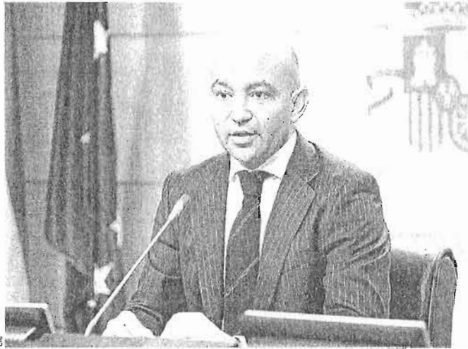
El secretario de Estado de Comercio, Jaime García-Legaz.

La vicepresidenta del Gobierno, Soraya Sáenz de Santamaría, presentó la norma a mediados de mayo, pero obvió comentar la adscripción obligatoria. De esta forma, una empresa de Murcia no podrá acudir a los servicios que presta la cámara de Albacete, por ejemplo, aunque sean más favorables a sus intereses, y deberá adscribirse obligatoriamente a la cámara murciana. En la práctica im-