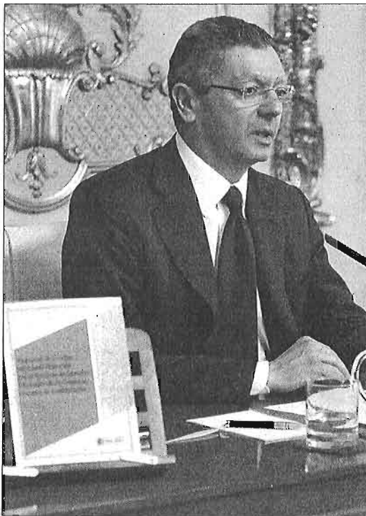
Alberto Ruiz-Gallardón, durante la presentación de la Propuesta de Código.

La mayor parte del Código incluye la regulación de materias que carecían de normativa aplicable y que, por lo tanto, constituyen una novedad en el ordenamiento jurídico. Así, por ejemplo, es nueva la regulación sobre la empresa y las operaciones que ésta realiza, la representación, la competencia desleal y la defensa de la libre competencia, la inclusión de varios artículos sobre la propiedad industrial.