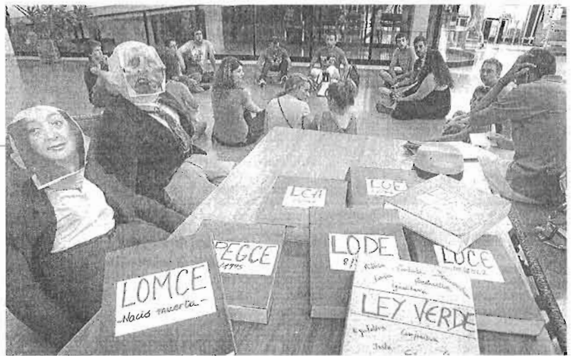
Júas del ministro y la consejera de Educación 'presenciaron' la asamblea de ayer.

La más inmediata será la que tenga lugar hoy a las 9.00 horas, en la Facultad de Medicina, donde se celebra una sesión ordinaria del Claustro. La plataforma quiere transmitirle a la rectora su preocupación por la «expulsión» de estos alumnos e instarla a que busque la fórmula o los medios que sean necesarios para que no pierdan el curso y pueda reincorporarlos al ámbito académico. «Me da vergüenza decir que pertenezco