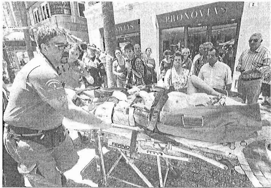
Sanitarios trasladan en ambulancia al hombre que sufrió el accidente.