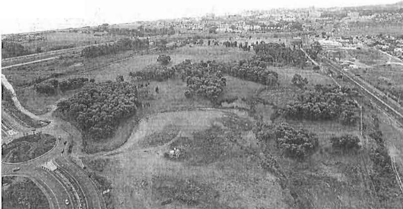
El campamento Benítez sigue esperando a convertirse en el gran pulmón verde de la ciudad. :: suv