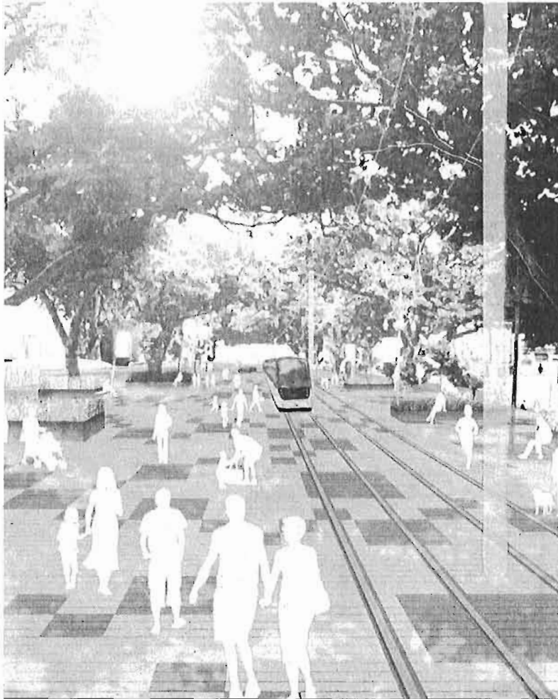
Una de las infografías de la propuesta del Metro en superficie por la Alameda.

Los mensajes recogidos por el Omau parten del rechazo que se emite sobre la idea de la Junta de discurrir por el centro histórico hasta La Malagueta a la luz del día en lugar de bajo tierra, como se pactó años atrás. Sobre esta opción, el organismo municipal apunta que el Metro podría haber sido construido en superficie "en una gran parte de su recorrido", pero no en la Alameda, al tiempo que alerta de que los costes "ya desmesurados de la obra, no pue-