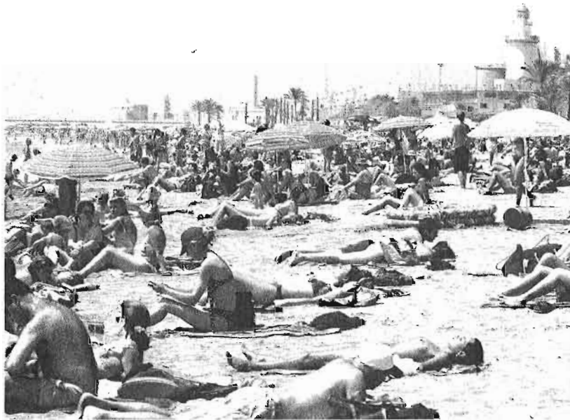
Turistas disfrutan de la playa de La Malagueta, en la capital.

Además, este cambio de tendencia convive con un crecimiento también de dos dígitos en los viajeros y las estancias internacionales, que experimentan subidas del 13 y el 12%, respectivamente, es decir, con la llegada de 301.934 viajeros extranjeros que reservaron 1.258.199 noches en los hoteles de la Costa.