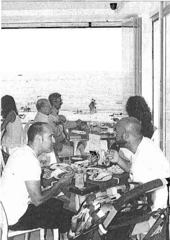
Los chiringuitos de La Malagueta han sido regularizados. ARCINIEGA