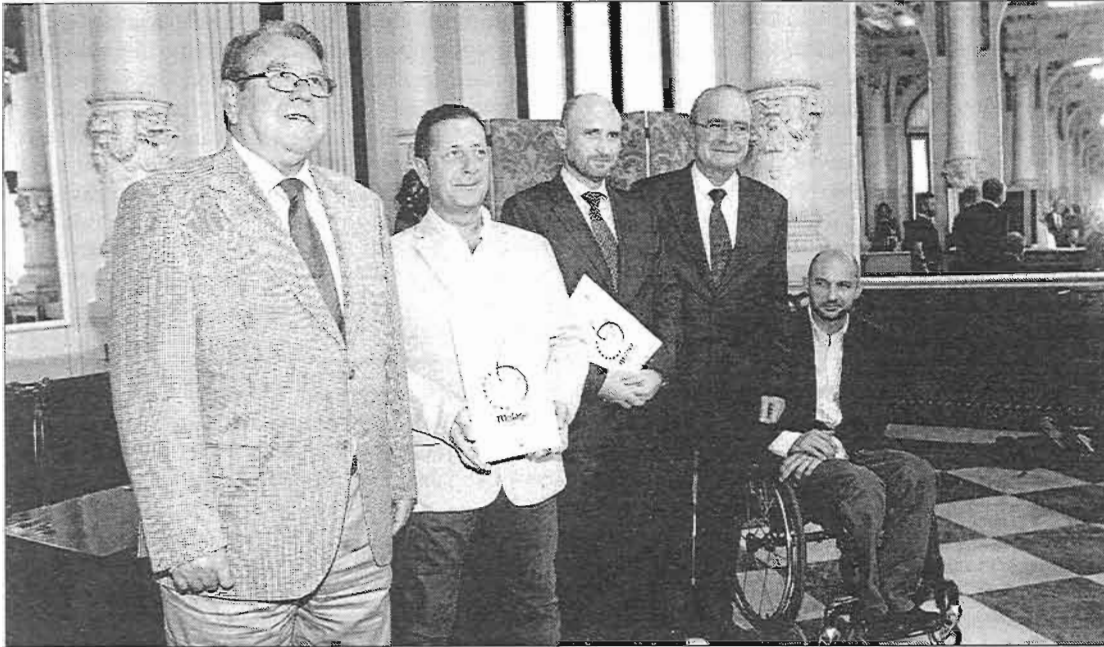
Detalle de la entrega de los nuevos distintivos.