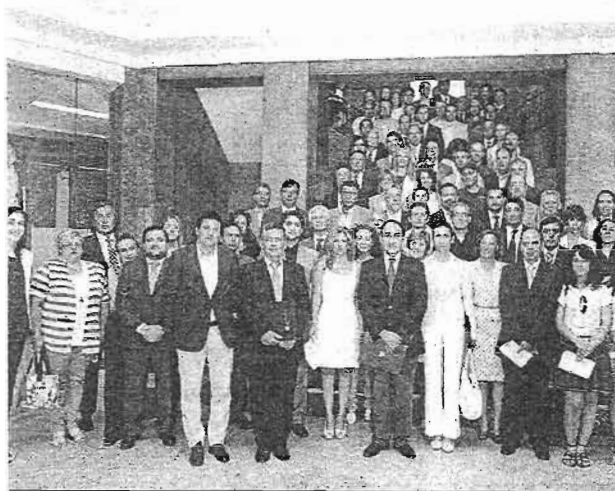
Representantes de empresas, ayer, en el acto de entrega de distintivos.