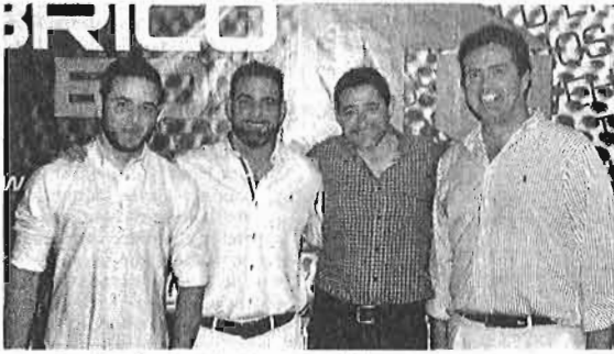
El equipo directivo de BricoBox durante la inauguración.

La empresa de mecánica BricoBox inaugura dos nuevos centros en Málaga y Sevilla, y la asociación de instaladores eléctricos APIEMA celebra su cena de hermandad