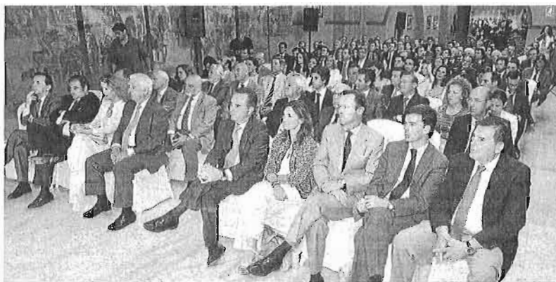
El público invitado a la entrega de premios en el Museo de Carruajes.