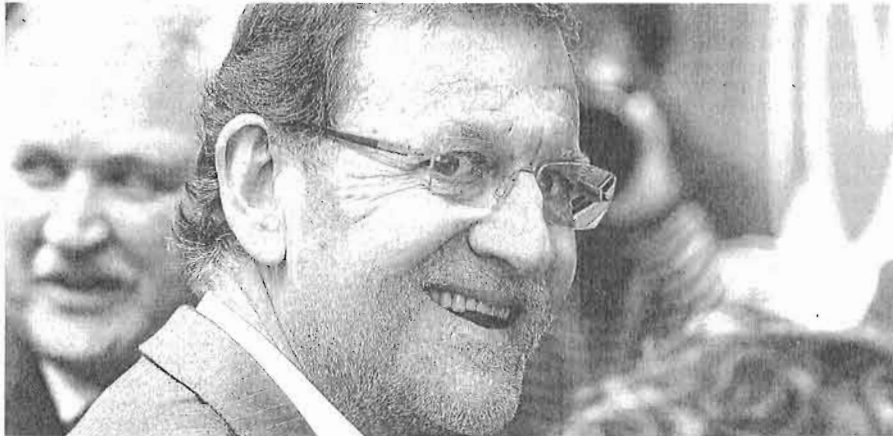
El presidente del Gobierno, Mariano Rajoy, acudió ayer a Bruselas para la reunión del Consejo Europeo

En el caso de las pymes, las expectativas estaban puestas en el plan conjunto Comisión Europea-Banco Europeo de Inversiones (BEI) para reci-