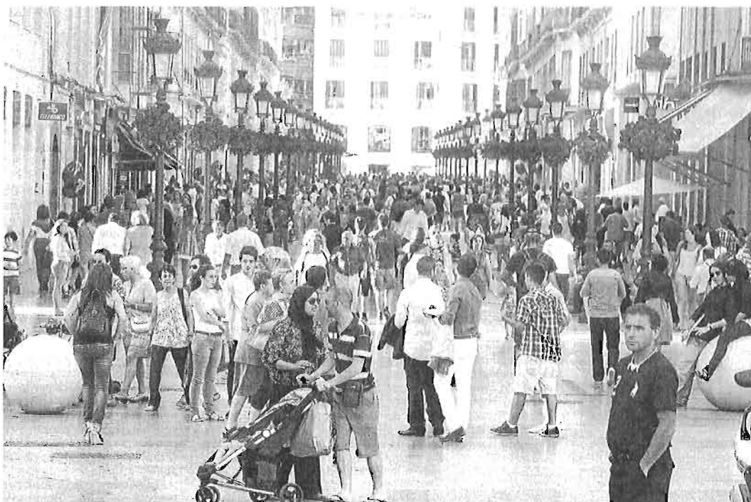
Cientos de personas pasean, ayer por la tarde, por calle Larios.

Aumentaron las zonas verdes un 2,9% (Churriana y Palma Palmilla- Parque Periurbano La Virreina) y el número de días con calidad de aire buena o admisible en la capital. El consumo de agua disminuyó situándose en 110 litros por persona y día (-2,1%) y se redujo en un 3,1% la recogida de residuos no selectiva.