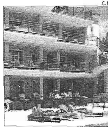
El hotel Aleysa Playa.

■ El comparador de precios de hoteles www.trivago.es ha publicado un ranking con los 10 mejores hoteles de playa de España de 2013, un listado que encabeza el Vincci Selección Aleysa Playa, situado en Benalmádena. La firma ha tenido en cuenta para la elaboración del ranking la popularidad de los hoteles en la web, así como todas las valoraciones de usuarios a las que se tiene acceso a través de trivago.es , más de 34 millones en total.