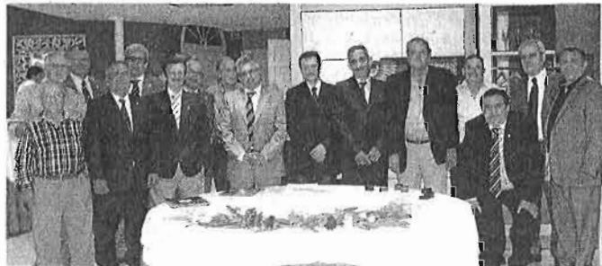
Grupo de instaladores jubilados y miembros de la junta directiva de APIEMA.