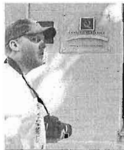
Puerta de hotel en Granada.

La patronal recuerda que la sujeción de gran parte de las actividades turísticas al tipo reducido del IVA ha formado parte de la política llevada a cabo por diferentes go-