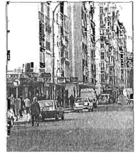
Una calle de Cruz de Humilladero.

Respecto a los parques empresariales, actualmente está en proceso de adjudicación la primera fase de la implantación de la señalética en estos recintos. Además, se está trabajando en la elaboración de una aplicación móvil con información de las empresas ubicadas en estos espacios.