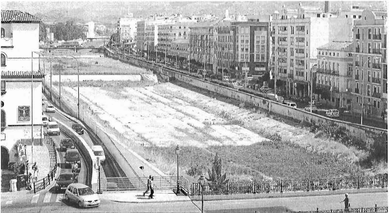
Imagen del cauce urbano del río Guadalmedina, a la altura del puente de la Aurora.