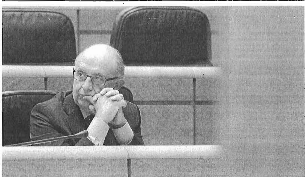
El ministro de Hacienda, Cristóbal Montoro, durante la sesión de control de ayer en el Senado.

La economía española no volverá a crecer al menos hasta 2015 según el Fondo Monetario Internacional (FMI). El organismo confirmó ayer sus previsiones de abril en lo que respecta a 2013, ejercicio en el que espera una contracción del PIB del 1,6% en 2013, pero recorrió siete décimas su anterior pronóstico para 2014, año en el que