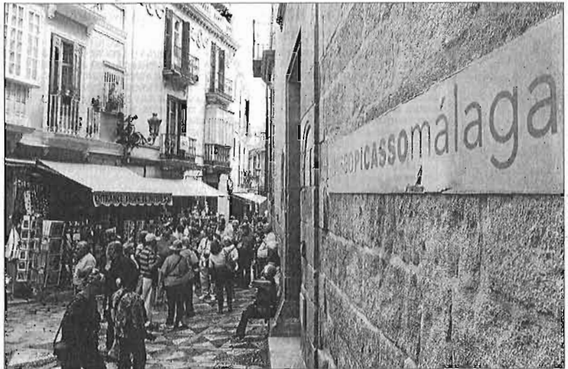
Un grupo de turistas en la entrada del Museo Picasso de Málaga.

A pesar de la crisis, los primeros seis años de vida del foro, cuya constitución es para Caneda el verdadero éxito del periodo, han servido para confirmar la identidad