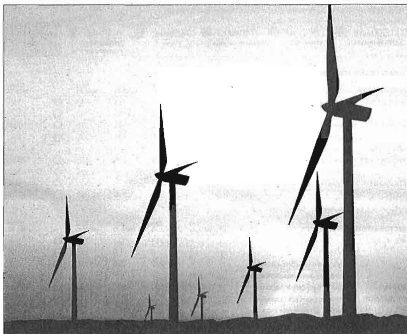
Un parque eólico.

"A pesar de que hemos realizado numerosas peticiones, el Ministerio de Industria no nos ha ofrecido ninguna reunión", explicaron a este diario los fondos. De hecho, incluso llegaron a plantear una peti-