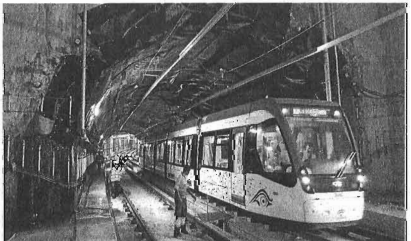
El convoy, a su paso bajo la Ronda Oeste.

nes) hasta la estación La Isla, ubicada en Carretera de Cádiz, atravesando para ello el intercambiador El Perchel-María Zambrano en el que confluyen las líneas 1 y 2. Este recorrido de ocho kilómetros constituye el primer trayecto del suburbano por ambas líneas, según destacaron ayer desde la Junta. Hasta la fecha, las pruebas únicamente habían discurrido por separado. El objetivo de este trayecto era desplazar desde las cocheras una unidad del material móvil —que ya dispone de ocho vehículos— hasta el trazado de la línea 2 para desarrollar en éste pruebas de circulación y comprobar el correcto comportamiento de la señalización ferroviaria en funcionamiento.