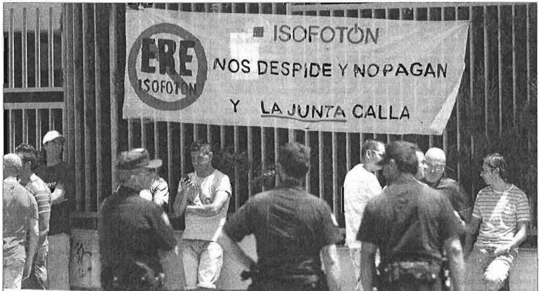
Policias vigilan la concentración de trabajadores de Isofotón en la delegación de Innovación y Empleo, donde otros están encerrados.