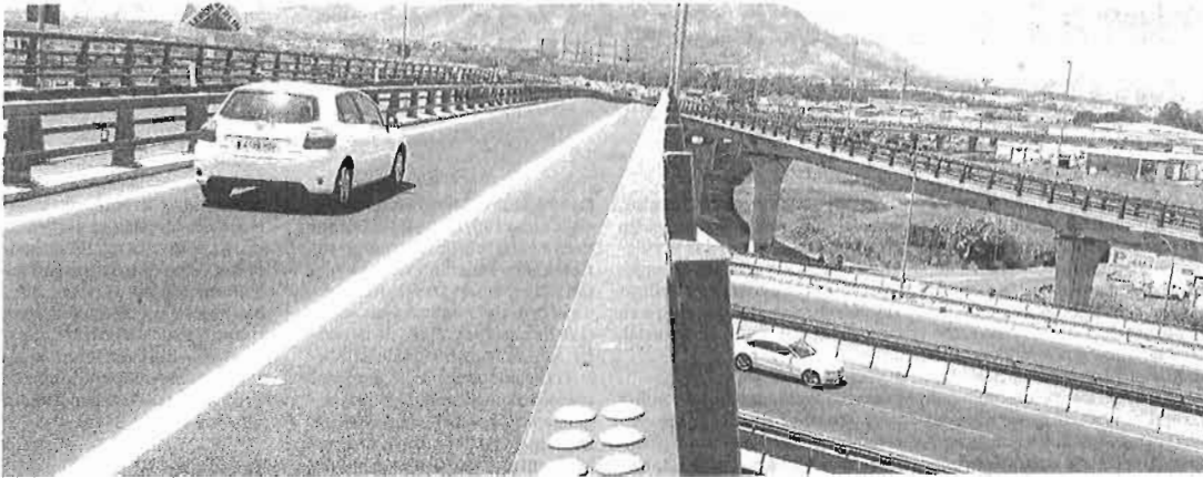
El vial entró en servicio ayer solo para los trayectos de ida, ya que la calzada de salida está pendiente de unas obras.