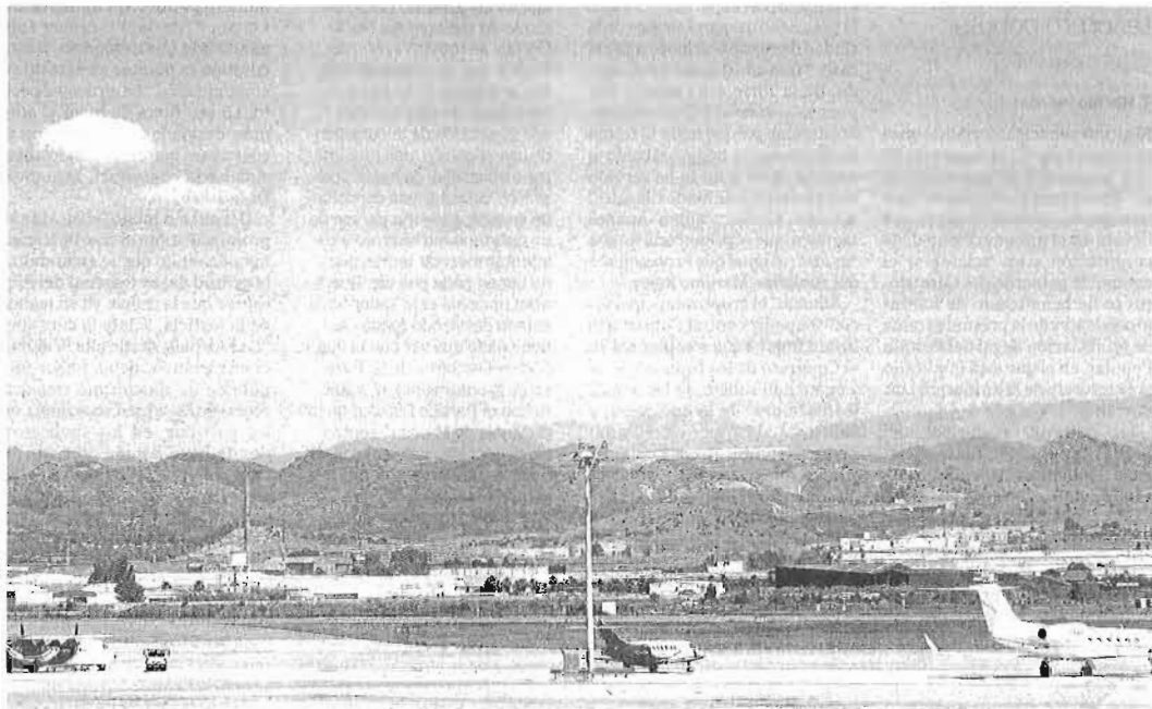
Imagen de la segunda pista de vuelo del aeropuerto de Málaga.

Por su parte, el consejero de Turismo y Comercio de la Junta de Andalucía, Rafael Rodríguez, espera que la situación sea "transitoria" y que "no afecte ni a la capacidad del recinto ni a su capacidad de atraer vuelos durante la temporada alta de verano". Asimismo, señaló que "cualquier esfuerzo que se haga de inversión pública, por sentido común, exi-