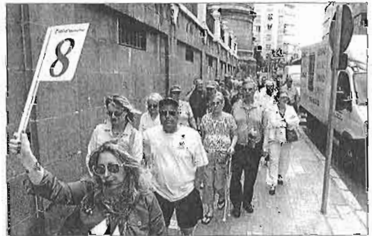
Un grupo de turistas extranjeros en el centro de Málaga.

Frontur publicó ayer que la comunidad andaluza recibió, en los primeros seis meses del año, un total de 3,4 millones de turistas extranjeros, lo que, en comparación con el mismo periodo del anterior ejercicio, supone un crecimiento del 2,3%. «Al ser datos procedentes de una encuesta están sujetos a múltiples variables», esgrimió