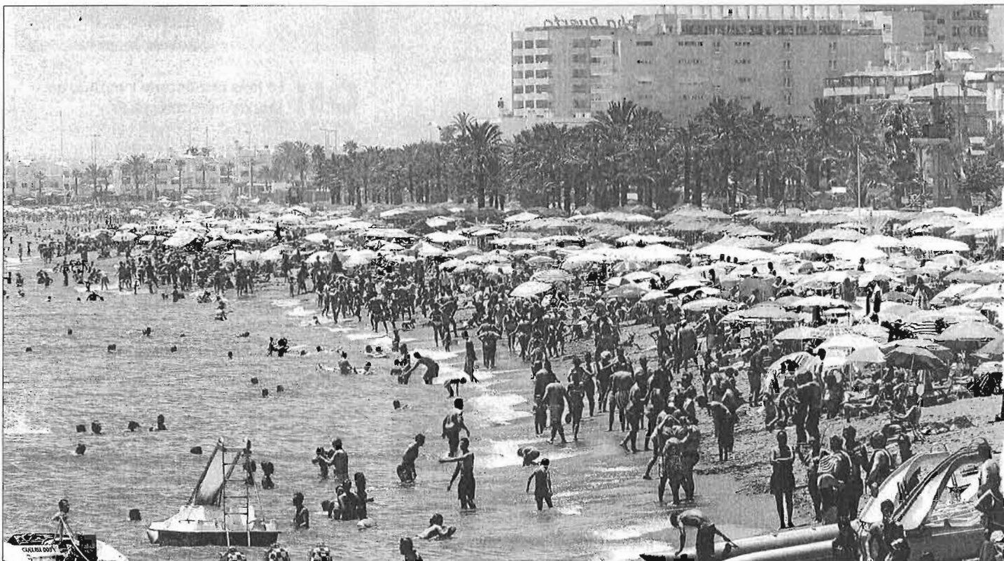
Cientos de turistas, en la playa de la Carihuela de Torremolinos.