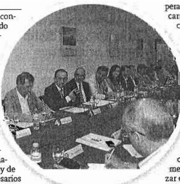
Reunión con los patronatos y empresarios, ayer en Málaga.