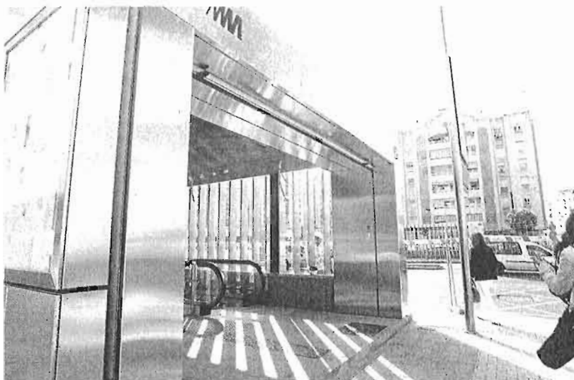
Puerta Blanca es una de las estaciones que se encuentran ya terminadas en el trazado.