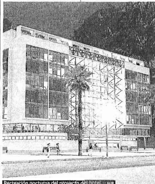
Recreación nocturna del proyecto del hotel.

Con ese interés, De la Torre ha puesto a los técnicos de la Gerencia Municipal de Urbanismo a analizar el encaje urbanístico de la que se considera pieza clave de toda la actuación: el hotel. Y las primeras impresiones no han sido del todo positivas como publicó este periódico en su edición del pasado domingo. Incrementar el aprovechamiento lucrativo en una parcela que en el actual Plan General de Ordenación Urbanística (PGOU) está reservada para una estación de la futura línea del metro hacia El Palo o, en cualquier caso, como zona verde, implica tener que compensar los seis mil metros cuadrados construidos del edificio con el equivalente en dotaciones de tipo social, deportivo, educativo o cultural, de forma que no se rompa el equilibrio ya establecido en el Plan