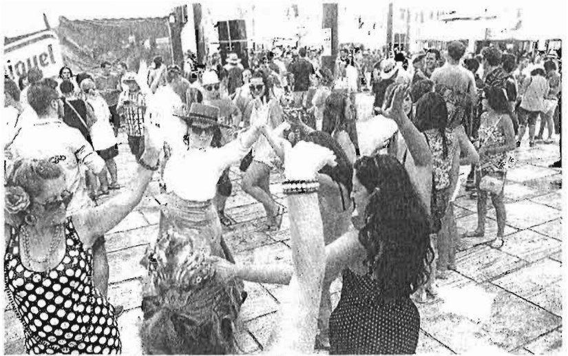
Más de 5,5 millones de visitantes ha recibido este año la feria. ■ sur

En este encuentro, los empresarios le explicaron al alcalde que la fecha elegida por el Consistorio para la celebración de la feria en 2014 supone romper los acuerdos ya firmados con los operadores turísticos, que se formalizan con un año de antelación y que se formalizan en base al compromiso alcanzado con el Ayuntamiento de que tienen que incluir la fecha del 19. «Se ha mostrado muy