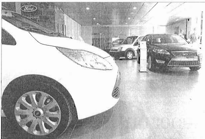
Las ventas de coches en Málaga presenta en 2013 un ligero repunte tras años de caída. GREGORIO TORRES

La tendencia en Málaga mejora el comportamiento del sector a nivel nacional donde, pese a las ayudas del plan PIVE (y también tras un flojo mes de agosto en el que las operaciones cayeron un 18,3%) las ventas en 2013 sí presentan números rojos. Tras el resultado el agosto, el acumulado anual de matriculaciones se eleva a 501.257 unidades, un 3,6% inferior a los 520.216 de enero-agosto del año pasado.