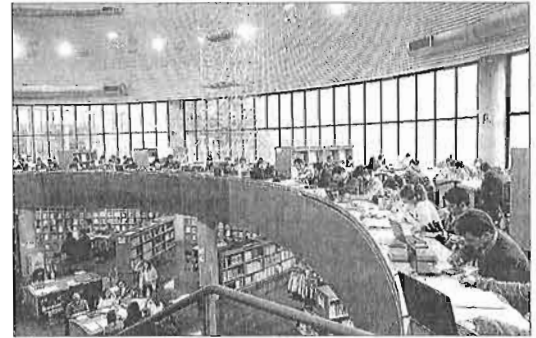
Estudiantes en la Biblioteca General de la UMA. ARCINIEGA

Galván afirmó que en la Universidad de Alcalá de Henares do-