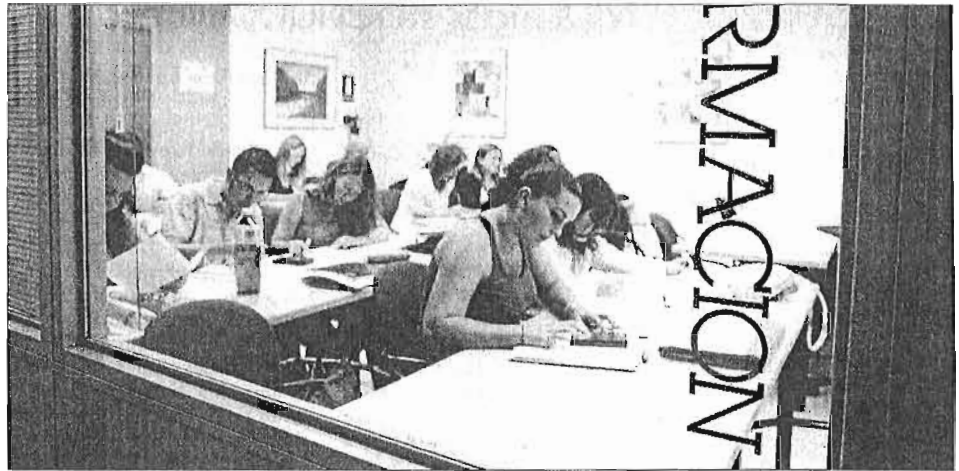
La formación continua, básica para los trabajadores. LA OPINIÓN

El perfil de los trabajadores que acceden a estos cursos es mayoritariamente masculino, con edades entre los 26 y 35 años, que optaron fundamentalmente por la