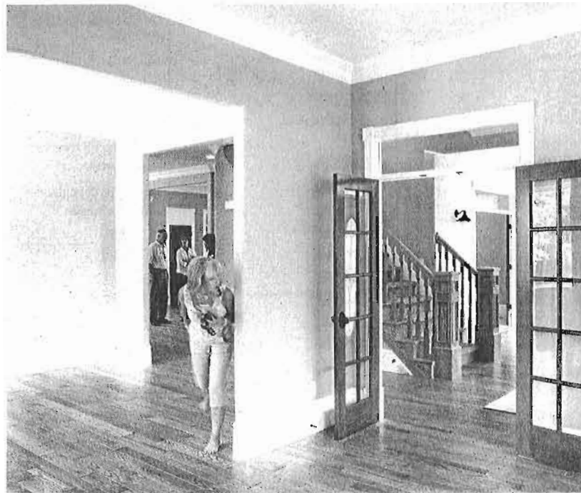
Más de la tercera parte de las viviendas tienen como comprador a un extranjero en la provincia.