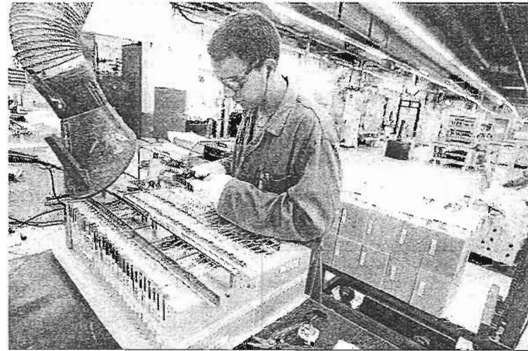
Un operario en una industria malagueña.

El pasado año resultó especialmente positivo porque fue el mejor desde 2009 –el momento más bajo tuvo lugar en 2010 con apenas 3.573 empresas–, si bien aún se está bastante lejos de los registros alcanzados en pleno auge