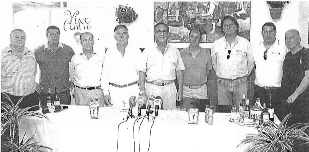
Empresarios de Vive el Centro, antes de dar a conocer la puesta en marcha de la plataforma para mejorar la feria.