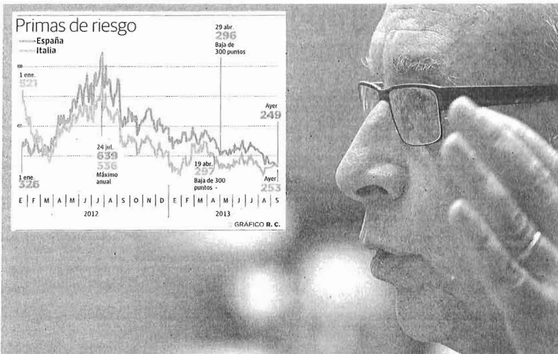
El ministro de Hacienda, Cristóbal Montoro, ayer durante su intervención en el Senado.