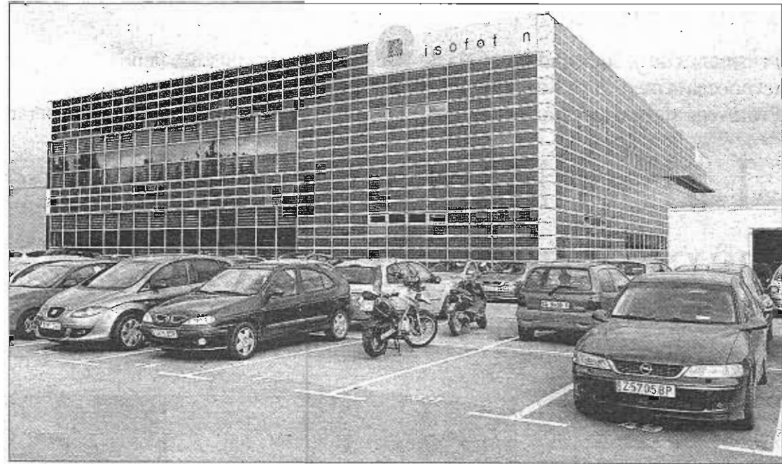
La sede de Isofotón en el PTA de Málaga. ARCINIEGA

Actualmente, Isofotón adeuda la paga de julio a 110 de sus 337 empleados —precisamente los que se reincorporan ahora— y la de agosto y la paga extra a la totalidad de