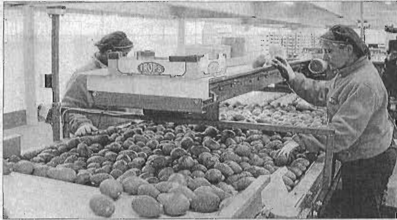
Tratamiento de aguacates en la cooperativa malagueña Trops. FRAN EXTREMERA

con una producción de aguacate de 40.775 toneladas. Unas 30.000 toneladas correspondieron a la variedad hass; el resto fue de aguacate de piel verde —fuerte y bacon—. Para esta campaña las previsiones son variadas, aunque todas contemplan un descenso moderado de la producción que oscila entre un 10% y un 20% con casos puntuales del 30%.