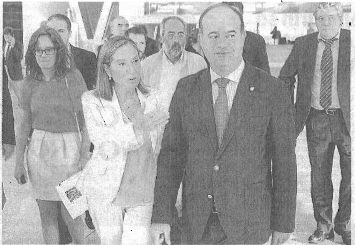
Ana Pastor y Barón, ayer en la estación de AVE Antequera-Santa Ana