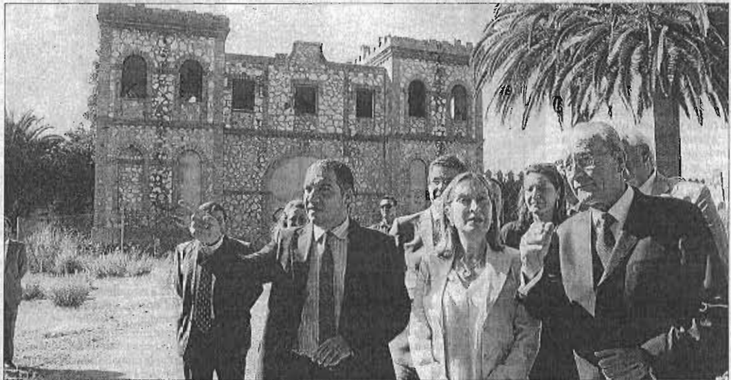
La ministra de Fomento, Ana Pastor, flanqueada por el alcalde de Málaga y el presidente de la Diputación, en su visita al Benítez. AL EX 26A

El regidor destacó que para esa segunda intervención se dispondrá de una reserva de dinero municipal en el presupuesto para 2014, aunque insistió en que soli-