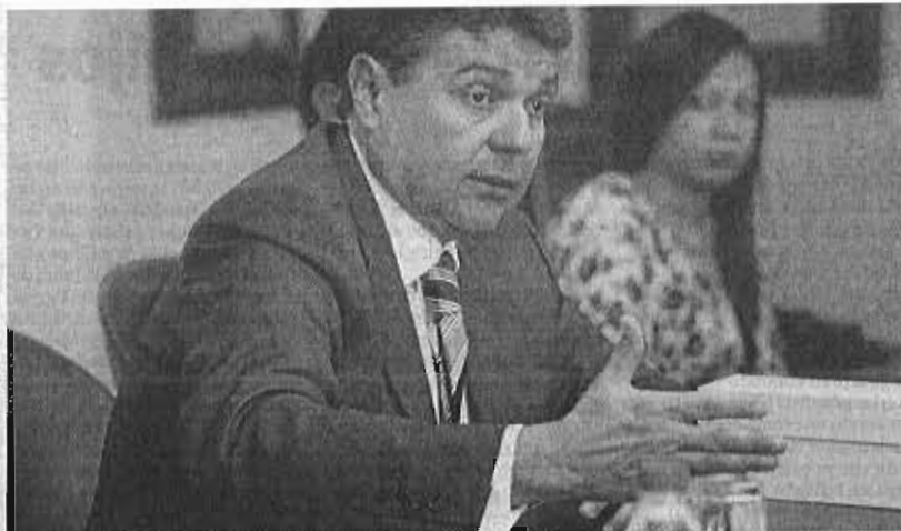
El embajador de Panamá participó en un acto en la Cámara de Comercio de Málaga.