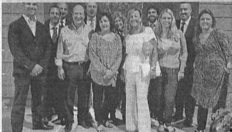
La única imagen conservada de la misión comercial, que sufrió el robo de móviles y cámaras.

El grupo de empresarios participante en la misión comercial a Angola y Sudáfrica sufrió la semana pasada un atraco a mano armada en Johannesburgo