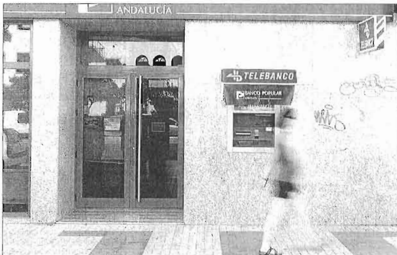
Una joven pasa por delante de una sucursal bancaria. GREGORIO TORRES