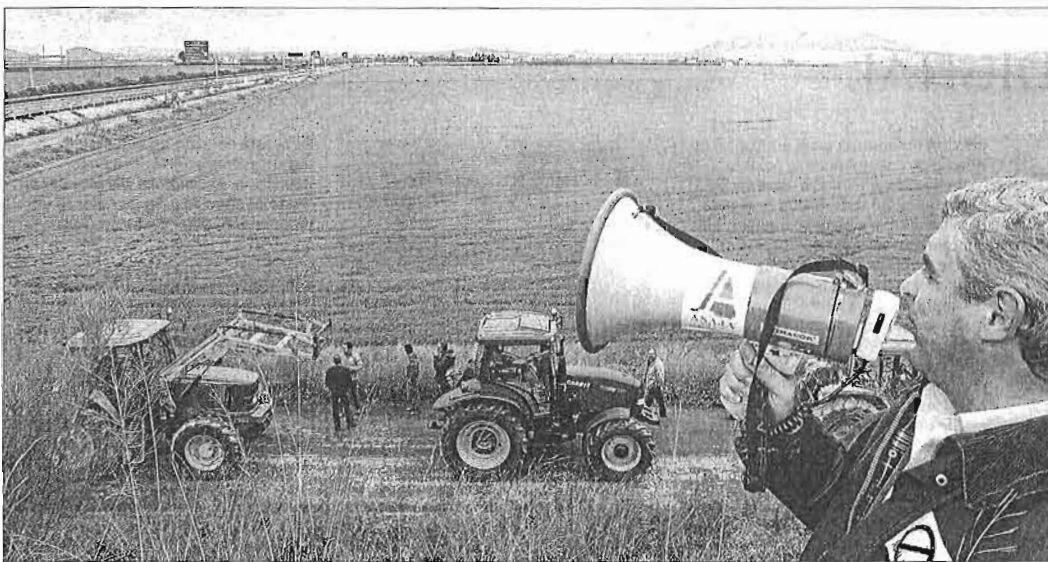
El proyecto del anillo ferroviario tiene la opinión en contra de la mayoría de agricultores de la Vega de Antequera.