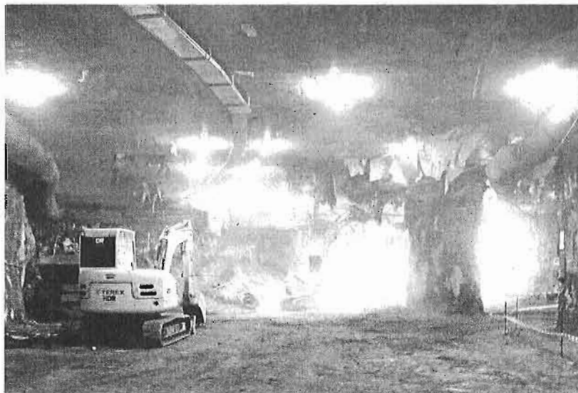
Excavación entre pantallas bajo Callejones del Perchel durante el pasado mes de julio.

Pese a ello, las mismas fuentes se muestran convencidas de que esa circunstancia no se dará confiando en que fructifiquen las negociaciones entre ambas administraciones. Pero la realidad a día de hoy es que, aunque las reuniones al máximo nivel (Francisco de la Torre y José Antonio Griñán) arrancaron el pasado mes de mayo con el objetivo de retomarlas en septiembre, los contactos han quedado aparcados por el relevo en la Presidencia de la Junta de Andalucía. El alcalde ya ha solicitado una reunión con la presidenta Susana Díaz, aunque de momento no está fijada la fecha. En ese encuentro, el regidor ya ha dejado claro que no va a renunciar al metro soterrado, aunque sí que se muestra abierto a que, si el problema es económico, el tramo Guadalmedina-Malagueta se ejecute por fases, proponiendo que se construya el trazado hasta la plaza de la Marina y luego seguir en función de la disponibilidad presupuestaria.