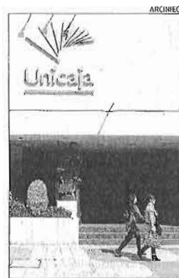
La sede central de Unicaja.

Por su parte, el sindicato Comfia CCOO lamentó que la empresa «justifica esta medida en vagas amenazas en el futuro sobre la situación del sector, el impacto de posibles medidas adoptadas por el Gobierno o por la UE o por el empeoramiento económico general».