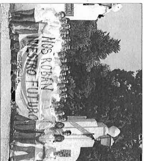
Protesta de los alumnos en julio, cuando cerró el restaurante.

Por otro lado, el delegado dijo no saber a quién le corresponde determinar «cuándo un parque es o