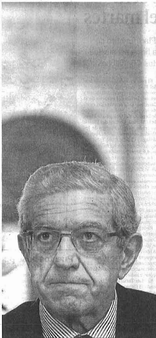
El presidente de Unicaja, Braulio Medel, en una imagen de archivo.

Los sindicatos, por ahora, esperan a ver qué ofrece Unicaja en la próxima reunión, que se ha fijado para el 25 de septiembre. El banco entiende que la negociación podría durar unos dos meses y medio y el objetivo es que esté resuelta la reestructuración el 30 de noviembre. La adquisición del banco Ceiss, si se consuma, podría producirse por esa fe-