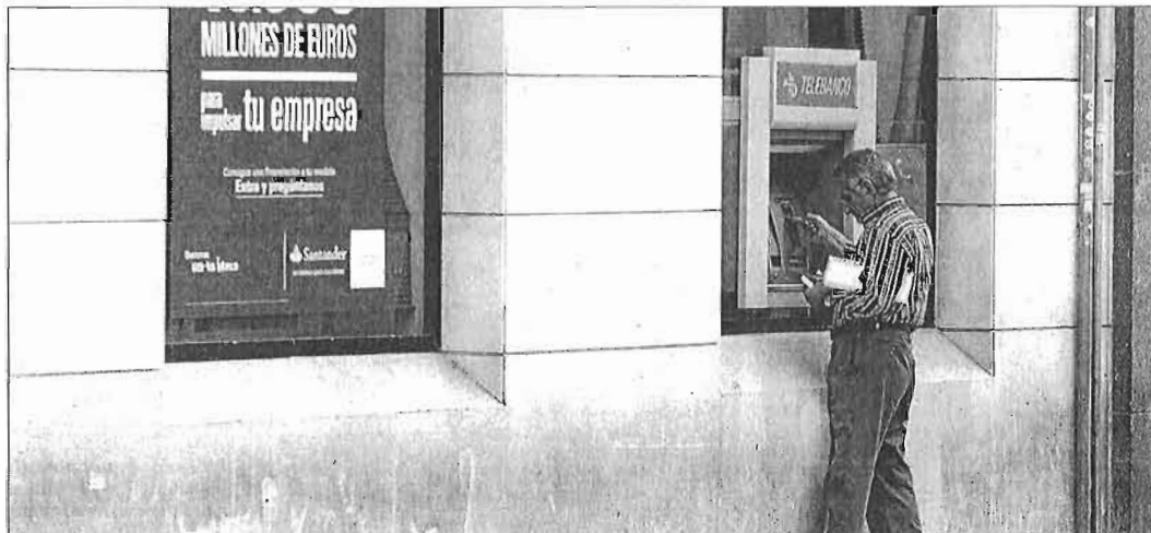
Un cliente saca dinero de un cajero automático en Málaga capital.

El fenómeno, en realidad, tiene también su lógica, aplicable no sólo a Málaga sino a toda la eco-