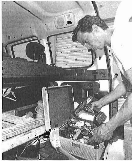
Los autónomos societarios tienen que devolver las bonificaciones. :: sur

El pasado febrero, el Gobierno anunció a bombo y platillo la aprobación del Real Decreto Ley 4/2013 de medidas de apoyo al emprendedor y de estímulo del crecimiento. ¿Su principal baza? Una ayuda que reduce a 50 euros el importe mensual a abonar por la Seguridad Social durante los seis primeros meses de actividad emprendedora, siempre que el autónomo sea menor de 30 años. Dicha bonificación también permite disfrutar de una rebaja que limita el pago a unos 170 euros mensuales durante un máximo de 30 meses a menores de 30 años (en el caso de los hombres) o de 35 en el caso de las mujeres. Para muchos jóvenes, sin empleo y con un futuro laboral incierto ante la elevada