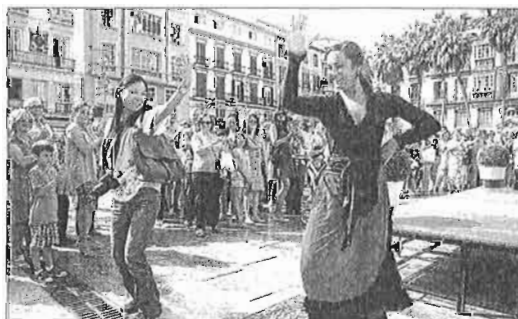
Actuaciones de bienvenida a los turistas en el Centro. ALEX ZEÁ