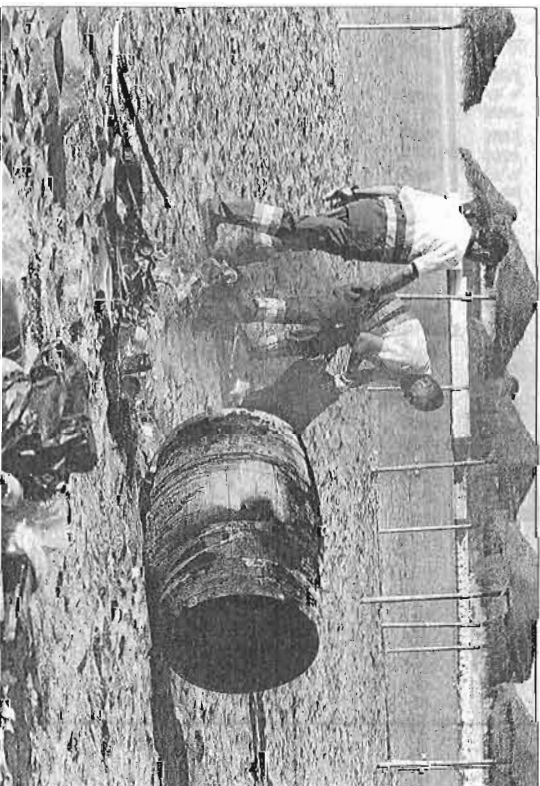
Operarios limpiando una playa tras la noche de San Juan.