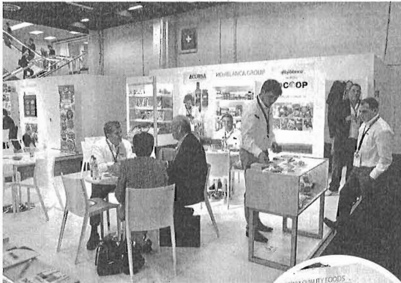
Expositor de Dcoop en la feria de Colonia.

Actualmente, Dcoop, que ha estrenado en Anuga 2013 su nuevo nombre, exporta el 90 por ciento de la aceituna de mesa que produce a la Unión Europea y los Estados Unidos, mientras que de las 250.000 toneladas de aceite de oli-