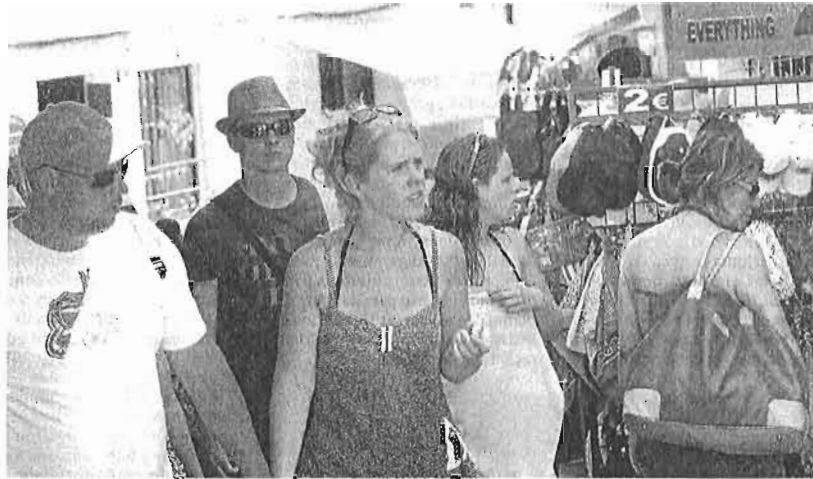
Turistas pasean por la calle más comercial de Torremolinos. ■ SUR

Esta modificación se contempla en el proyecto de los Presupuestos Generales para 2014, según confirmaron desde la Secretaría de Estado de Turismo. Concretamente, el nuevo articulado, que reforma la norma de 2007, señala: «el otorgamiento de préstamos con largos plazos de amortización, incluyendo periodos de carencia y bajos tipos de interés, tanto a las entidades enumeradas en el epígrafe uno -en referencia a los ayuntamientos- como a empresas turísticas privadas, radicadas y que desarrollen su actividad principal en destinos turísticos maduros».