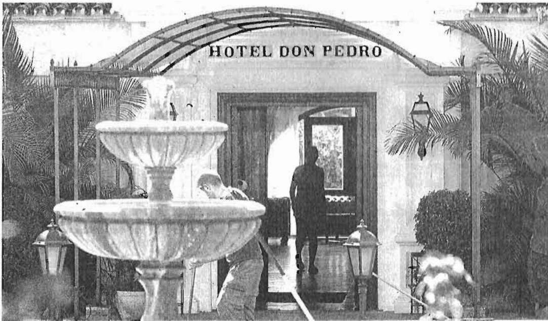
Agentes de la Guardia Civil inspeccionaron ayer por la mañana un despacho del hotel Don Pedro, en Torremolinos.