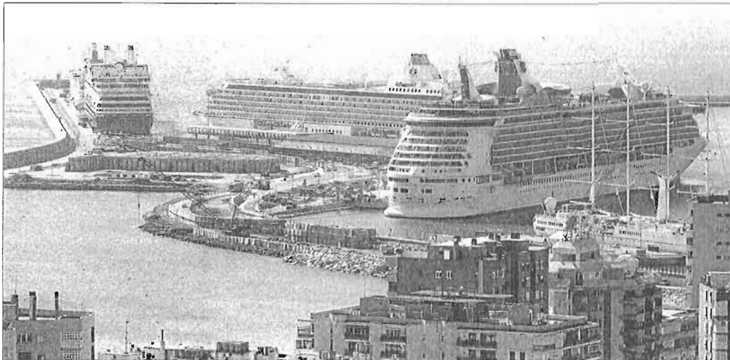
Cruceiros atracados en la terminal del puerto de Málaga. ARCI NEGA