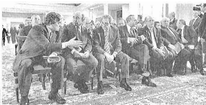
El presidente de CEOE, J. Rosell, con E. Botín (Banco Santander); C. Alierta (Telefónica); I. Fainé (La Caixa); P. Brufau (Repsol); I. Álvarez (El Corte Inglés); y F. Pérez (Acesa), en un acto en La Moncloa.

Precisamente, por esta razón Rosell está llevando a ca-