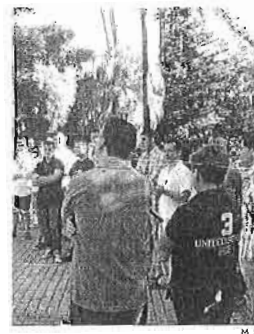
Reunión en La Cónsula. M. H.

el restaurante por no tener productos para cocinar, los alumnos consideran que al menos deben de comenzar con la teoría. "Si adelantamos una semana del temario teórico luego nos podríamos centrar en la parte práctica, ya tuvimos un ritmo muy bueno el año pasado y si mantenemos ese ritmo podríamos dar las mismas prácticas a pesar del retra-