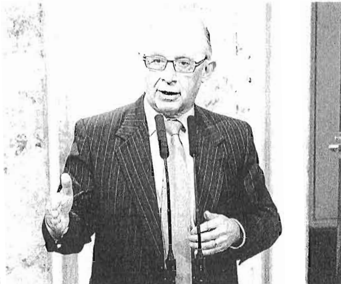
El ministro de Hacienda, Cristóbal Montoro, ayer en el Congreso.

Esta ley también establece que todos los ajustes de Sociedades, también los que eran transitorios y acababan el 31 de diciembre de 2013 y los nuevos, se mantendrán toda la legislatura, hasta 2015 inclusive. Generan cerca de