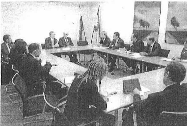
Una de las reuniones de la delegación empresarial malagueña en Moscú.

El plazo por convenio para negociar concluyó ayer, aunque Unicaja envió una nota interna a sus empleados señalando que se amplía, sin decir cuánto. Si no se alcanza ningún pacto, Unicaja se guarda la opción de hacer un Expediente de Regulación de Empleo y abrir un periodo oficial de negociaciones de un mes. Queda, por tanto, mucho que hablar en las próximas semanas.