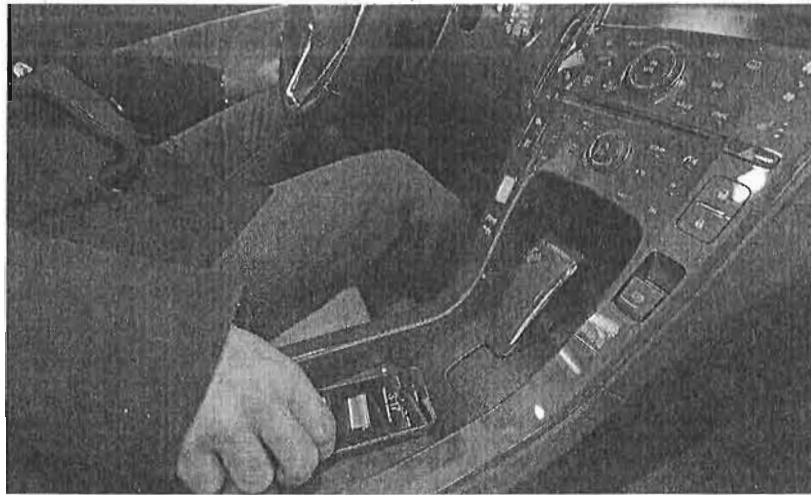
Fabricantes de coches como Audi van a introducir la carga inalámbrica en sus próximos modelos. :: sur

En este nuevo paso adelante de la telefonía móvil hay una empresa malagueña llamada a desempeñar un papel protagonista. AT4 Wireless es uno de los tres laboratorios elegidos a nivel mundial por Power Matters Alliance (PMA), el consorcio que lidera actualmente el desarrollo de la carga inalámbrica de dispositivos, para testar y homologar esta tecnología. A comienzos de 2014, la compañía con sede en el PTA empezará a realizar pruebas oficiales con dispositivos del centenar de empresas que forman parte de dicha alianza, entre las cua-