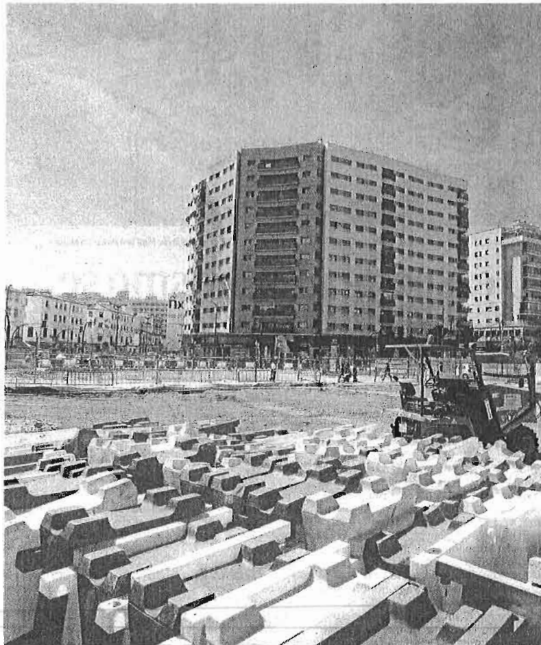
Zona de obras en la Plaza de Albert Camus.

"Nos dicen que no están dispuestos a pagar ese dinero", decía uno de los asistentes en relación con la reclamación de los 15