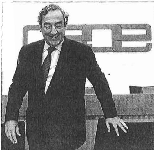
El presidente de la CEOE, Joan Rosell.

Otro de los ámbitos en los que la patronal se mostró precavida fue