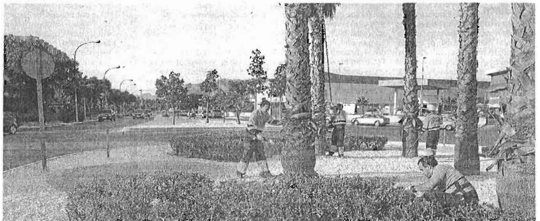
Cuadrilla de operarios del polígono Guadalhorce trabajando en una de las glorietas ajardinadas.