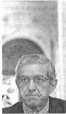
Braulio Medel, presidente de Unicaja.

Los sindicatos siguen negando la mayor, es decir, que Unicaja necesite reducir sus costes laborales un 20% -unos 51 millones de euros- por la situación del sector financiero o el aumento de la morosidad, como defiende el banco. Los representantes de los trabajadores afirman que "ni los números de Unicaja ni su solvencia justifican este sacrificio de los trabajadores" y ase-