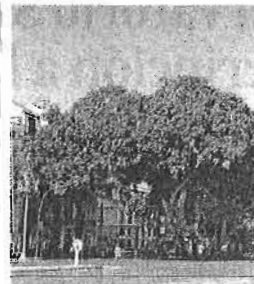
Acceso a la Alameda.