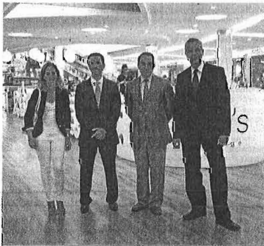
Representantes del Consistorio, los empresarios y el centro comercial, ayer.

el sol y la naturaleza adquieren un papel esencial. "La tipología también será más elegante y el camaleón es el símbolo del cambio que queremos mostrar. El lenguaje visual es importante y se notará, por ejemplo, en la señalización", indicó el responsable.