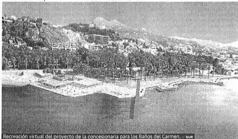
Recreación virtual del proyecto de la concesionaria para los Baños del Carmen. SUR

Estábamos cerca de la solución. Los autores de la propuesta de la sociedad concesionaria íbamos a trabajar codo con codo con los funcionarios municipales para perfeccionar la idea y enmendar eventuales errores sin más limitación que no traspasar las líneas rojas de la sinrazón y la estupidez.