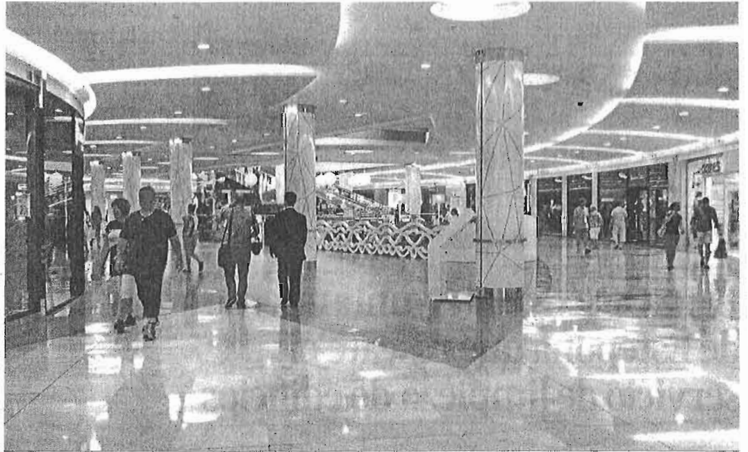
Las obras han permitido aumentar la superficie del centro comercial en unos 7.000 metros cuadrados.