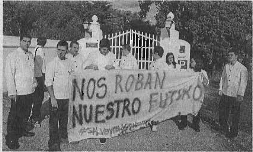
Alumnos se concentraron en la entrada, tras la reunión con la dirección.