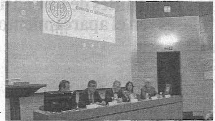
Un momento de la jornada de ayer.

ta. “Hemos conseguido parar la recesión y vamos a crecer, pero no la crisis. Hay buenas perspectivas pero o activamos la demanda interna y reducimos el paro o vamos a seguir sufriendo”, indicó este experto, quien recalcó el potencial del sector servicios de Málaga y animó a los empresarios a que apostaran por la sostenibilidad como negocio.