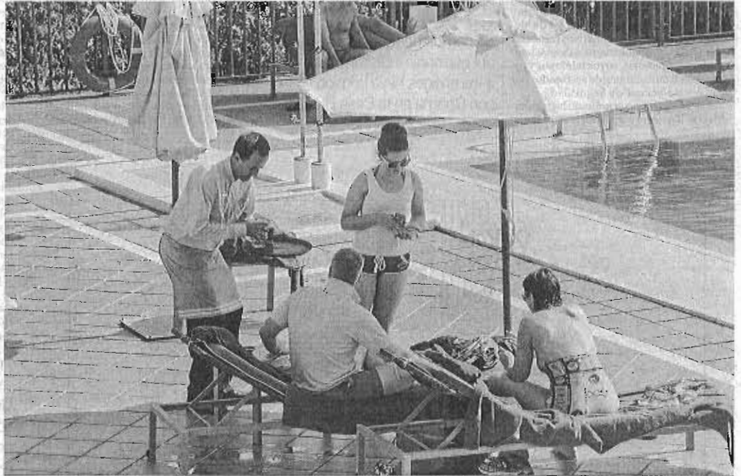
Un camarero atiende este verano a los clientes en un hotel de Marbella.

Desempleados. Es el número de personas que, según la EPA, no tenían trabajo en el tercer trimestre