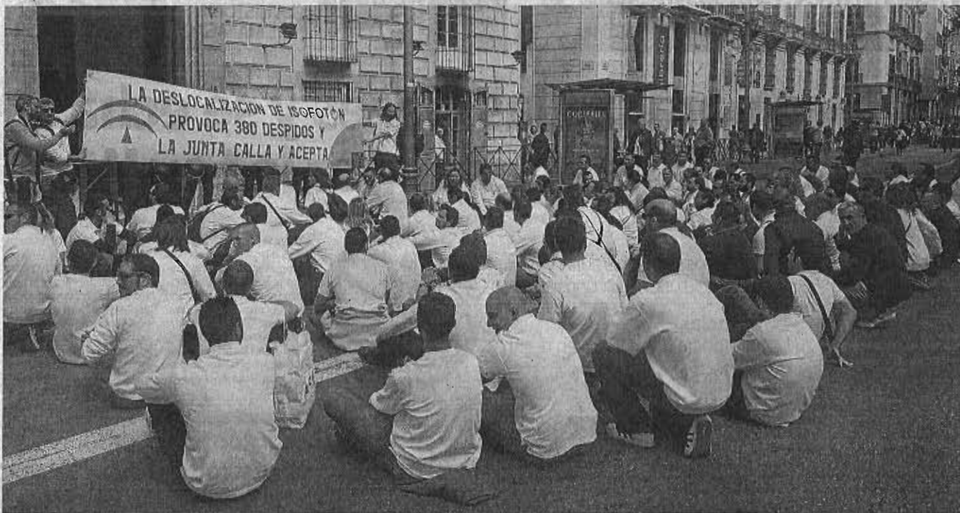
Hace tan sólo cuatro meses que la empresa fotovoltaica ejecutó un ERE con 354 despidos, que precisamente hace diez días fue ratificado por el TSJA. » sum