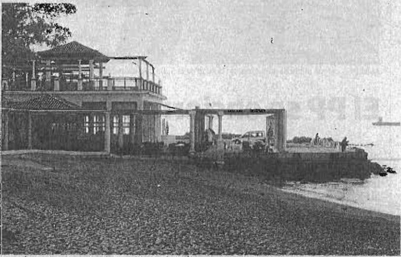
El proyecto contempla la regeneración de la playa y del antiguo balneario.