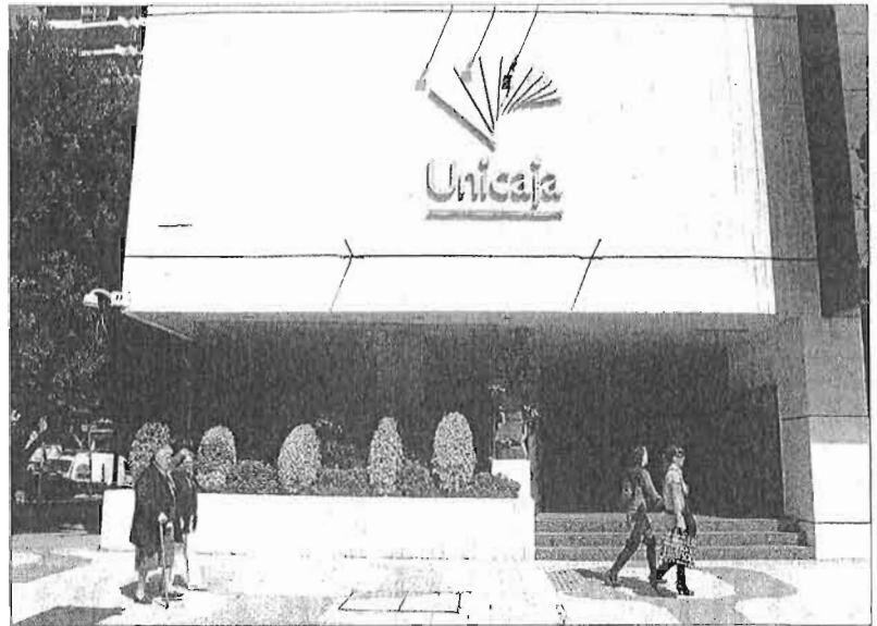
La sede de Unicaja, situada en la avenida de Andalucía. ARCEMEGA

constató que el nivel de aceptación mínimo de la oferta por parte de los accionistas y bonistas de Ceiss, que en un principio se colocó en el 75%, podrá ser menor a ese porcentaje si la entidad malagueña así lo estima oportuno. De esta manera, Unicaja se guarda el derecho a decidir a partir del respaldo que reciba su oferta, sin imponer un porcentaje mínimo previo.