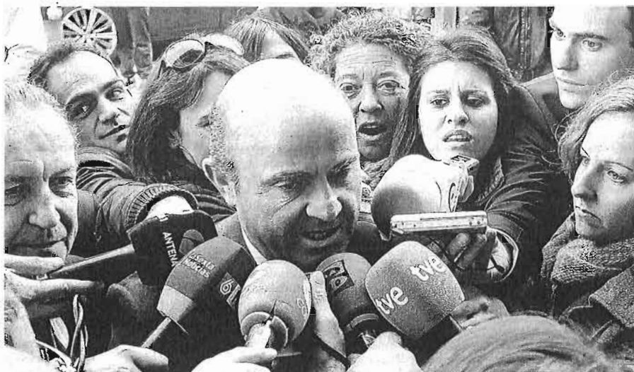
El ministro de Economía, Luis de Guindos, ayer, ante los medios de comunicación antes de un almuerzo en el Casino de Madrid.

caria para acabar con la fragmentación del crédito, en el acuerdo para lograr un mecanismo de resolución único y en la mejora de la confianza que se generará en los bancos españoles tras someterse a un examen a la calidad de sus activos, el requisito previo a que el BCE empiece su tarea de supervisión de las entidades.