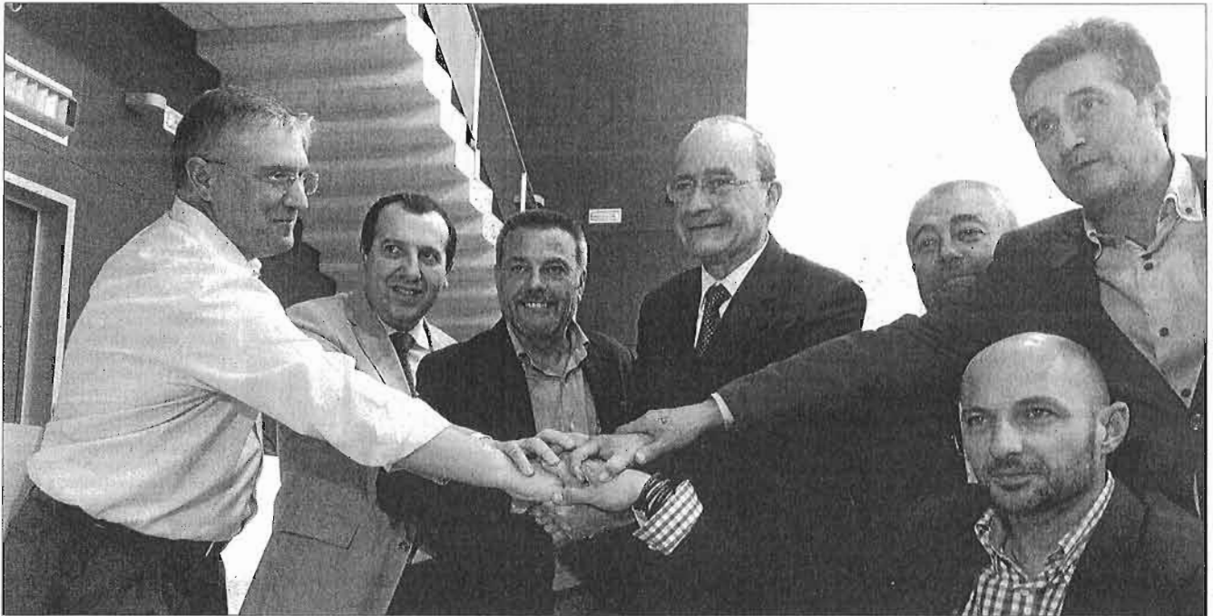
Representantes de la Consejería de Fomento, el Ayuntamiento de Málaga y Metro Málaga cerraron el 11 de noviembre un acuerdo para desbloquear el proyecto. I.A.C.

La factura del metro. El TSJA ha emitido dos autos en contra del Consistorio, y queda un tercero, que le obligan a abonar su parte de la factura de la construcción del metro. El auto no tendrá efecto en la primera factura (32,3 millones), para la que hay un acuerdo de compensar con obras, pero sí para los dos pagos pendientes.