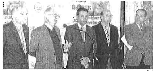
El presidente del Banco de Alimentos, junto a entidades colaboradoras.

bién paralelamente, esperan lograr más de 2.500 toneladas de alimentos, para lo que contarán con la participación de unos 20.000 voluntarios distribuidos por 1.500 establecimientos.