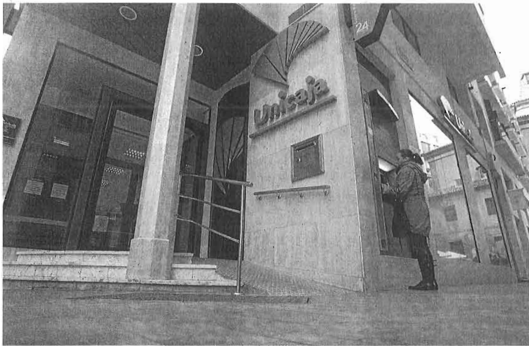
La entidad malagueña pretende tener cerrada la operación de absorción de CEISS antes de que acabe el año. :: sur