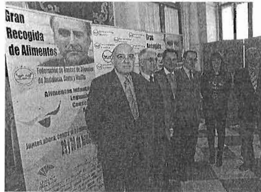
Presentación de la Gran Recogida en el Ayuntamiento.

Las cifras hablan por sí mismas. Este año participarán 3.000 voluntarios que ya saben qué puntos de distribución les han sido asignados, cuáles son sus turnos de trabajo, qué deben decirles a los ciudadanos para animarles a que colaboren y cómo tie-