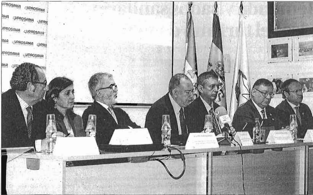
Representantes de los siete colegios profesionales sanitarios que integran Uprosama, ayer en la sede del Colegio de Enfermería. CRISTINA MORALES