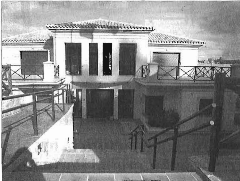
Sede de la Federación Andaluza de Golf en Málaga.

Así que, a la tercera convocatoria, no fue la vencedora, aunque tendrá que serlo, si es verdad que la Junta, que ha supervisado el proceso, se niega a una cuarta convocatoria, como dicen fuentes de la comisión gestora de la Federación. Todos están muy cansados de un espectáculo nada edificante en un deporte considerado de caballeros, con unas reglas que cada uno se ocupa de cumplir y en el que en muy contadas ocasiones hay que llamar a un árbitro. En las elecciones, el árbitro ha sido la Junta de