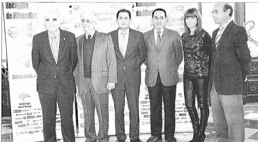
La Gran Recogida de Alimentos, que se celebra este fin de semana, fue presentada ayer en el Ayuntamiento de Málaga.