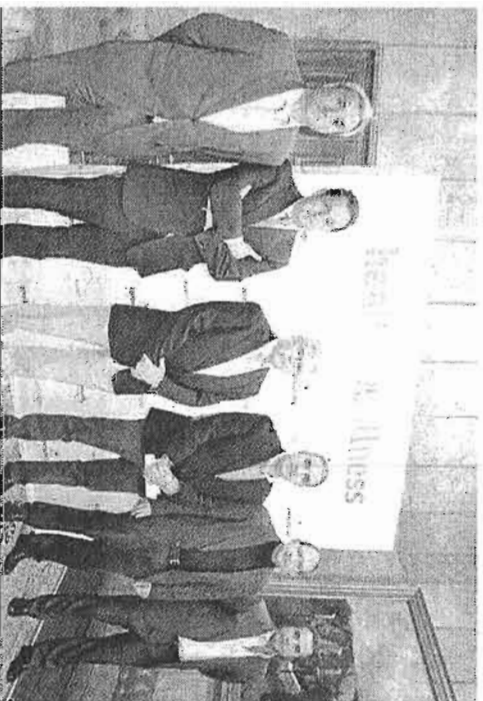
Presentación de la nueva marca de turismo de salud ayer.

la creación de una sociedad mercantil, ya que la misma no tiene capital suscrito ni desembolsado, requisito necesario para su creación", consta en el informe de Intervención. Por eso, la dotación de capital social se inició ayer con la tramitación de un expediente de concesión de crédito extraordinario por valor de 3.000 euros, aprobada por el equipo de gobierno en la sesión plenaria. Mientras, los estatutos y el procedimiento de creación del ente público se encuentran a exposición pública para posibles alegaciones y sugerencias. En la práctica, el actual Patronato de Turismo se mantendrá con los socios privados sin financiación pública—hasta ahora la Diputación participa aportando casi el 95% de sus fondos—y la nueva empresa pública—en estos momentos se estudia la fórmula de participación de los empresarios turísticos—ejecutará los proyectos de promoción.