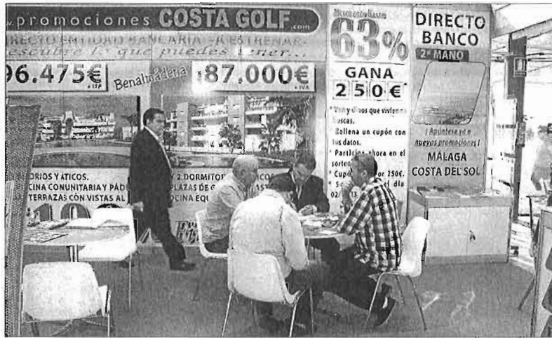
Compradores de vivienda en el salón SIMed de Málaga. ÁLEX ZEA

El año 2006 marcó el cúspide del mercado hipotecario, con casi 60.000 préstamos concedidos. Este 2013 se certará casi son seguridad por debajo de los 8.000, lo que supone una caída del 87%. El radical cambio de escenario también se traslada al préstamo medio otorgado por los bancos: si allá por 2007 la hipoteca media se movía en los 165.000 euros ahora lo hacen en los 105.600. El descenso obedece en parte a la bajada del precio de los pisos, pero también a que los