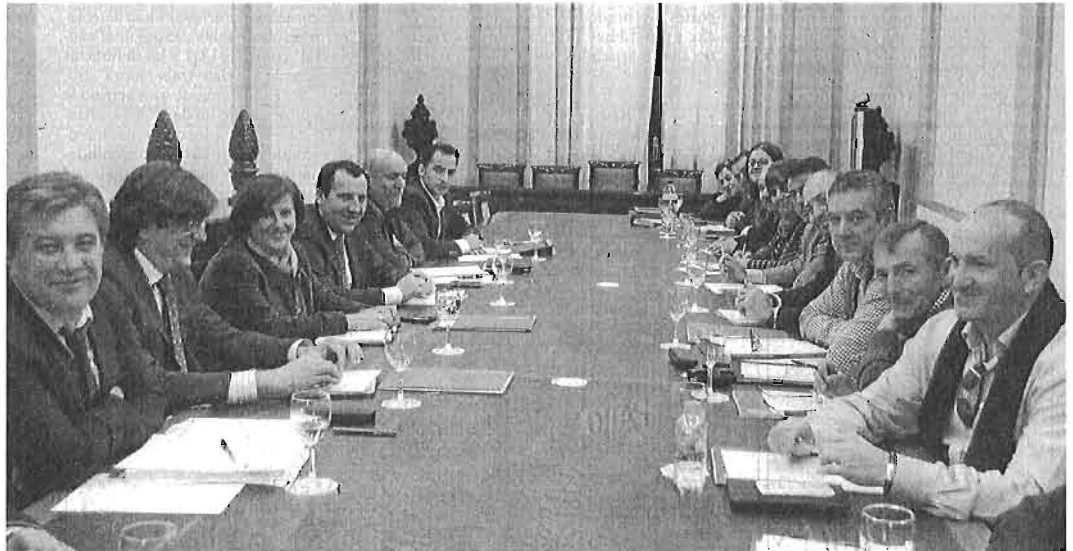
Momento de la reunión de ayer entre los representantes de la Consejería de Salud y de la Plataforma pro Hospital del Guadalhorce.

Salud también ha asumido con la plataforma el compromiso de "gestionar" a lo largo del año que viene la acometida provisional para el suministro eléctrico así como los accesos provisionales a fin de poder recibir la obra. El edificio está acabado