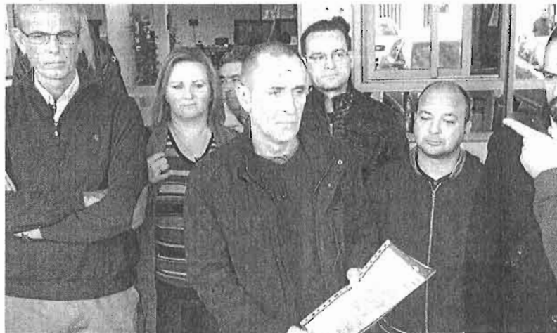
Los miembros del comité, tras registrar la convocatoria de huelga.

El tejido empresarial reitera que Málaga no se puede permitir el daño económico de una huelga en plenas navidades