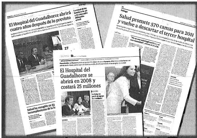
Informaciones de 'Málaga Hoy' con los reiterados plazos dados por Salud para la apertura del hospital. Todos incumplidos.

desde hace más de un año y medio, pero la Consejería no lo recepciona porque le faltan la electricidad y los accesos.