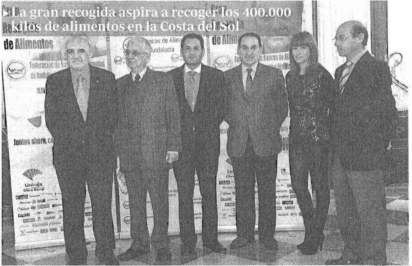
El Banco de Alimentos de la Costa del Sol (Bancosol) presentó ayer en el Ayuntamiento de Málaga la edición ABC de este año de la Gran Recogida, una iniciativa solidaria con la que se pretenden recoger 400.000 kilos de alimentos para los más necesitadas y que movilizará a 3.000 voluntarios repartidos por 270 establecimientos.