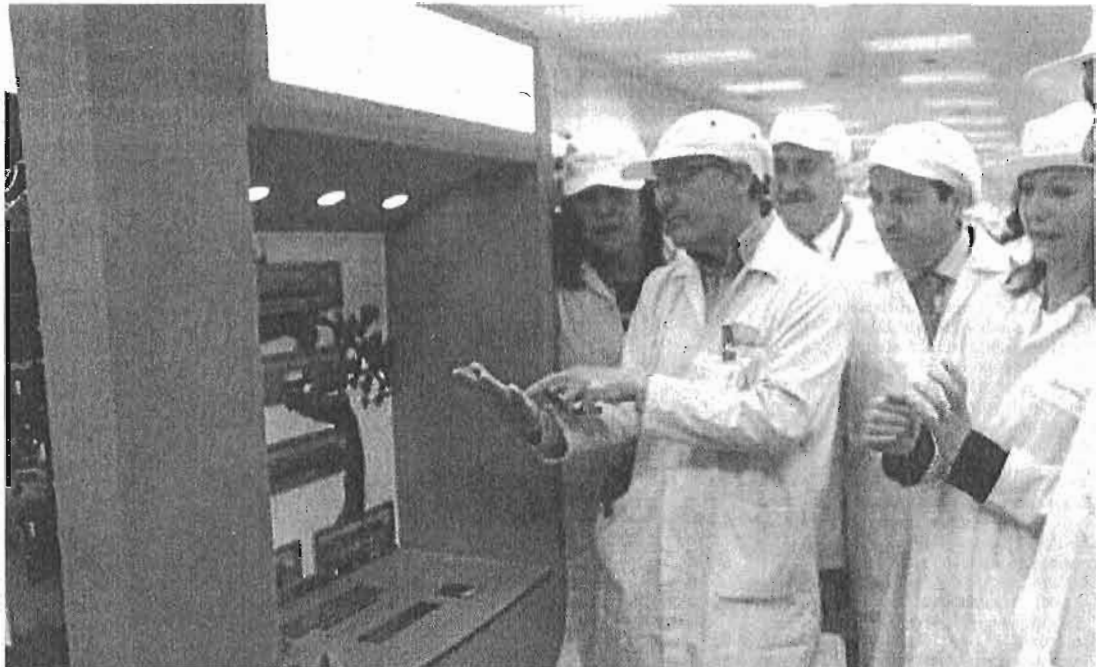
Los cajeros de nueva generación van a generar una carga de trabajo creciente para la fábrica de Málaga.

personas trabajan actualmente en la factoría de la multinacional nipona. Esta cifra se incrementará previsiblemente en los próximos años.