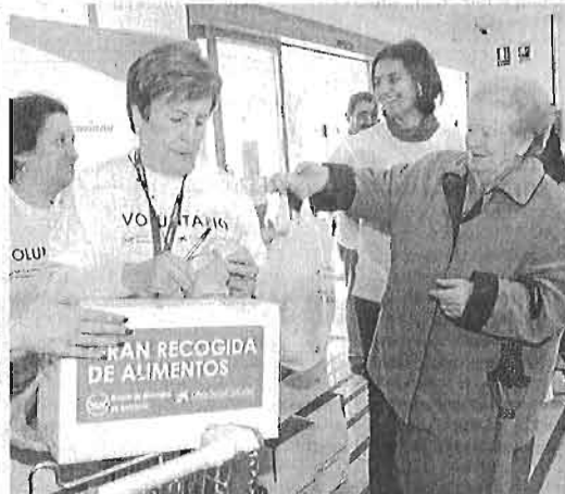
Voluntarios y donantes de alimentos, en la última gran recogida.

Málaga: C/Héroe de Sostoa, 126; Avd. Pascueros, 3; Camino San Rafael, 23; Churrriana: C/Rota, 33 Fuengirola: Ctra. de Mijas Km 8-10; Vélez Málaga: Avda. Juan Carlos I, 1; Mijas: Pol. Ind. Molino de Viento Avd. Carmen Sáez Tejada, 1; Marbella: Bulevar Príncipe Alfonso Von Hohenlohe s/n; Torremolinos: Avda. Carta Alesandrí, 11; C/Cruz s/n Ctra. N-340 Cádiz-Málaga; Benalmádena: Avda. del Cosmo, 3; Antequera: Ctra. Sevilla, s/n; Coín: Avda. Reina Sofía, 5; Estepona: Avda. Puerta del Mar s/n; Manilva: Ctra N-340 Km 14; Marbella Elvira: Ctra. N-340 km 19. Algarrobo: Ctra. Ma-103 Avda. Las Panocha, 5; Nerja: Ctra. Frigiliana s/n. Pol.