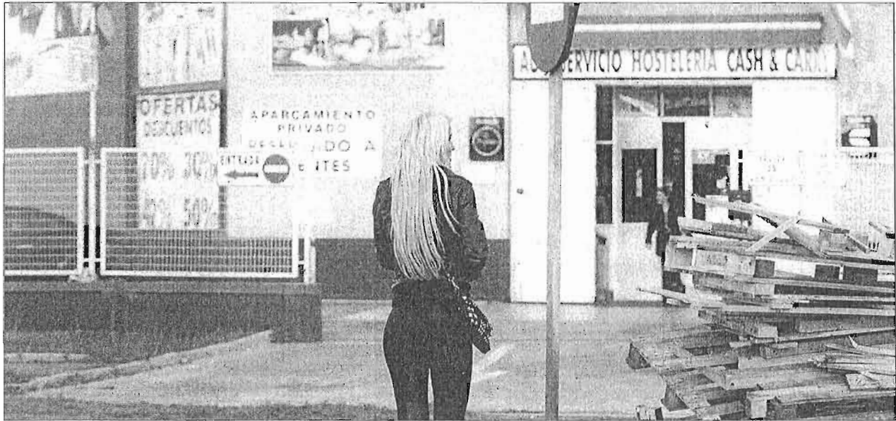
Todavía quedan algunos núcleos con mucha presencia de prostitutas en el polígono Guadalhorce. ARCINIEGA