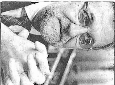
Mariano Rajoy, ayer.

Un recorte que se reparó de forma muy diferente depen- diendo del tamaño de las empresas. Por ejemplo, el año pasado, en las más pequeñas se redujo un 4,5 %, mientras que en las medianas cayó el 2,8 % y en las grandes, el 2,2 %. El tamaño medio de las plan- tillas también continuó merman- do. El organismo supervisor se- ñala que en 2012 la reducción de