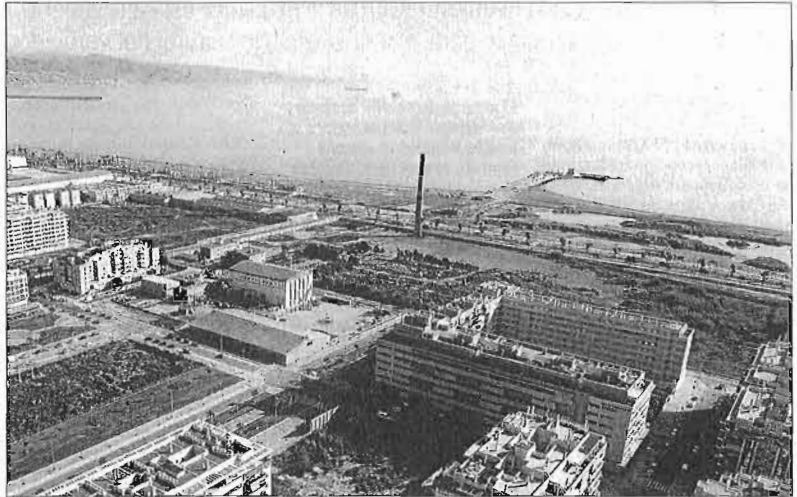
Vista aérea del entorno de los suelos de La Térmica. G. TORRES

Endesa y su mercantil Nueva Marina Real Estate, propietarias de los terrenos de la antigua fábrica La Térmica, con una superficie aproximada de 100.000 metros cuadrados, habían firmado en agosto de 2008 un convenio urbanístico con el Ayuntamiento para la recalificación de dichos terrenos. A cambio de esa recalificación, que permitiría a Endesa levantar 1.000 viviendas, de las que 232 serían de VPO, Endesa se comprometía a compensar al Ayuntamiento con 58 millones de euros.