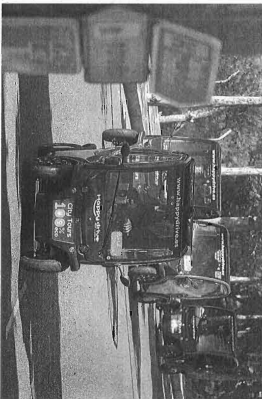
Técnicos de Turismo probaron ayer esta experiencia, visitando los enclaves de interés.