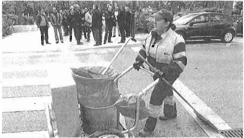
Una empleada de limpieza pasa junto a los miembros del comité de empresa.