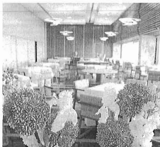
Interior del Parador Atlántico, en Cádiz.

Soria afirmó que se está trabajando en introducir nuevos modelos de negocio en la empresa pública como es la franquicia, con el propósito de empujar un nuevo modelo de crecimiento de la red que proporcione "valor añadido a través de la colaboración público-privada". Soria destacó la contribución fundamental de la red al sector turístico, siendo un "emblema por su gran prestigio, profesionalidad y calidad", que ha colaborado significativamente en la recuperación y puesta en valor de edificios históricos de gran valor.