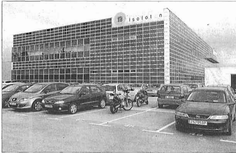
La sede de Isofotón, en el Parque Tecnológico de Andalucía (PTA) de Málaga. ARCINIEGA

El preacuerdo incluye como condición por parte de los representantes laborales el pago inmediato por parte de la compañía del equivalente a una mensualidad del Salario Mínimo Interprofesional (SMI) para cada persona -unos 645 euros-, lo que supone una partida global de 192.000 euros. Ruiz explicó que este dinero será «un pago a cuenta» de las nóminas atrasadas con el que se pretende que los trabajadores puedan de algún modo «tirar» hasta que tramiten el desempleo. También destacó que el pago deberá hacerse efectivo con carácter previo a la so-