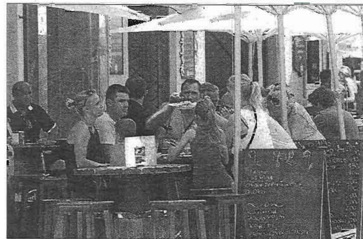
Terraza de un bar del centro de Málaga.

Incluso, en el balance de final de año –las navidades, junto a la Semana Santa y los fines de semana de verano representan algo más de la mitad de la facturación–. «En Málaga, si el tiempo no empeora, el 90 por ciento