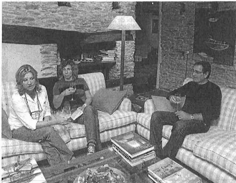
Un grupo de amigos disfruta de la tranquilidad en un alojamiento rural. :: suu

todas las comarcas, de forma que las plazas de interior suponen un 12,5% del total del conjunto de la Costa del Sol. Además, el 30% de las camas de interior son hoteleras. «Dos de cada tres hoteles adscritos a este segmento son de categoría superior, lo que prueba que el compromiso de los empresarios con la calidad es firme. De estos crecimientos destaca el aumento en Antequera del 28,5% o en la Axarquía, que se ha registrado una subida del 15,5% en el último lustro. En este periodo, la Sierra Norte oferta un millar de plazas después de haber subido un 23% y la Serranía de Ronda contabiliza 6.473 camas (una de cada tres del total en el interior) gracias a su aumento del 13%.