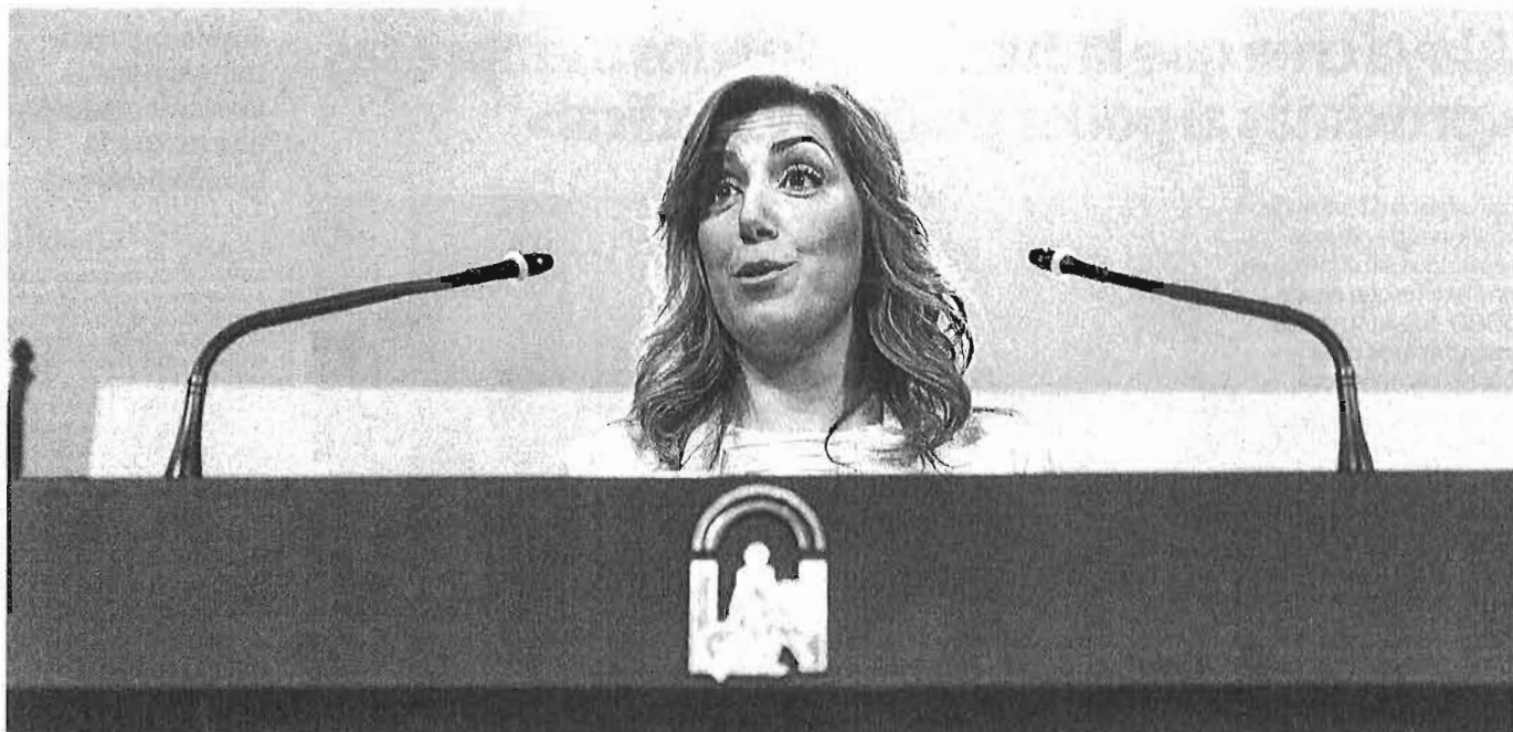
La presidenta andaluza en su comparecencia ayer en San Telmo.