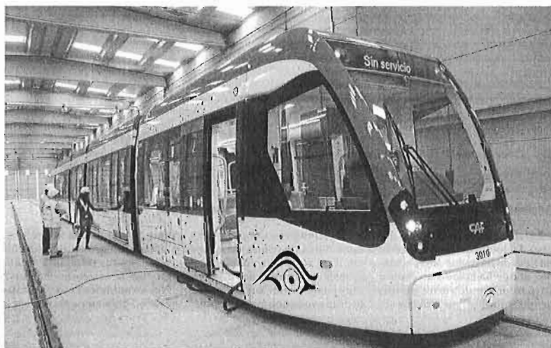
Primer Metro que llegó a Málaga, en abril de 2011, procedente de la fábrica.

El paso dado ahora por Fomento deja sobre el tejado del banco