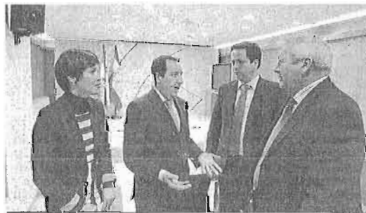
Un momento de la presentación realizada ayer del balance de 2013.

de las patentes, modelos de utilidad y diseños industriales "es un indicador significativo del valor de la I+D+i en nuestra provincia y de la apuesta de nuestras empresas, muchas de ellas ubicadas en el Parque Tecnológico de Andalucía (PTA), por ir mejorando y aportando elementos diferenciadores en sus modelos de producción".