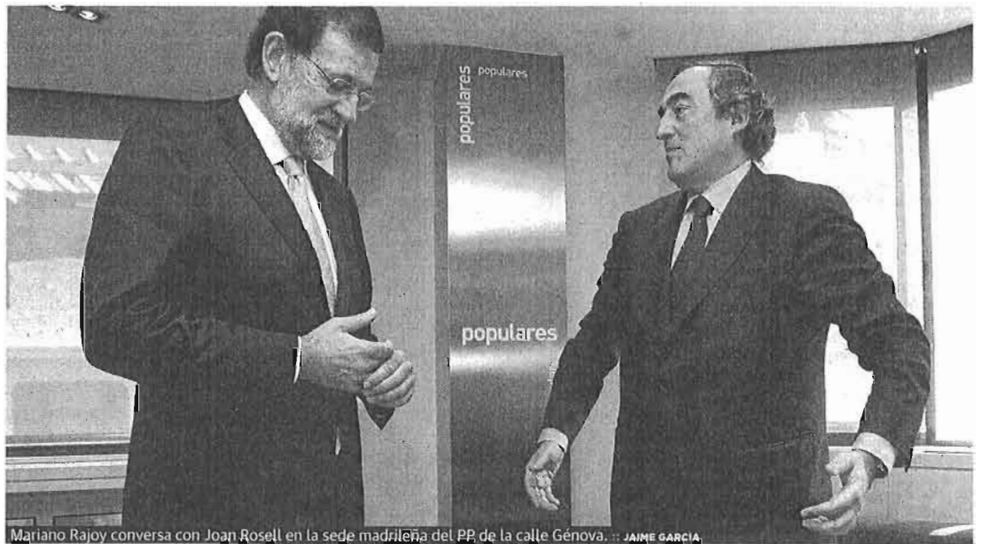
Mariano Rajoy conversa con Joan Rosell en la sede madrileña del PP de la calle Génova.

Asimismo, se sustituirá el actual sistema de expedición de los partes médicos de confirmación -de periodicidad semanal- por otro que establece cuatro tipos de procesos en función de la enfermedad y su duración prevista con distintos periodos de expedición de partes, de manera que en unos casos, el trabajador tendrá que volver al tercer día y en otro puede que sea a los quince días o al mes. Los sindicatos critican el proyecto porque consideran que «culpabiliza» al trabajador por estar de baja. En 2012 el gasto por IT fue de 1.861 millones de euros y en 2013 se habrá situado previsiblemente en torno a los 1.700.