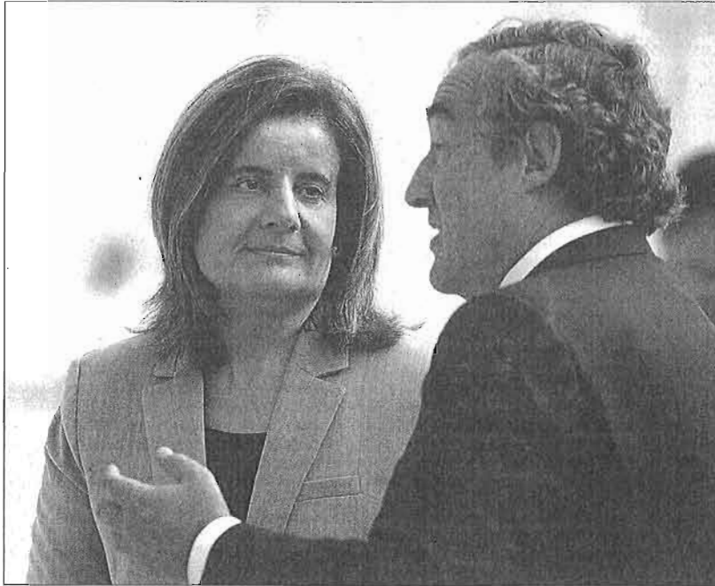
El presidente de CEOE, Juan Rosell, junto a la ministra de Empleo, Fátima Báñez.

En un comunicado emitido al término de la reunión de los órganos de gobierno, la CEOE pide, además de la retirada del Real Decreto Ley, la constitución de una comisión con los agentes sociales "para analizar detalladamente el impacto económico y social y las consecuencias legales de integrar en el salario los conceptos que no lo son".