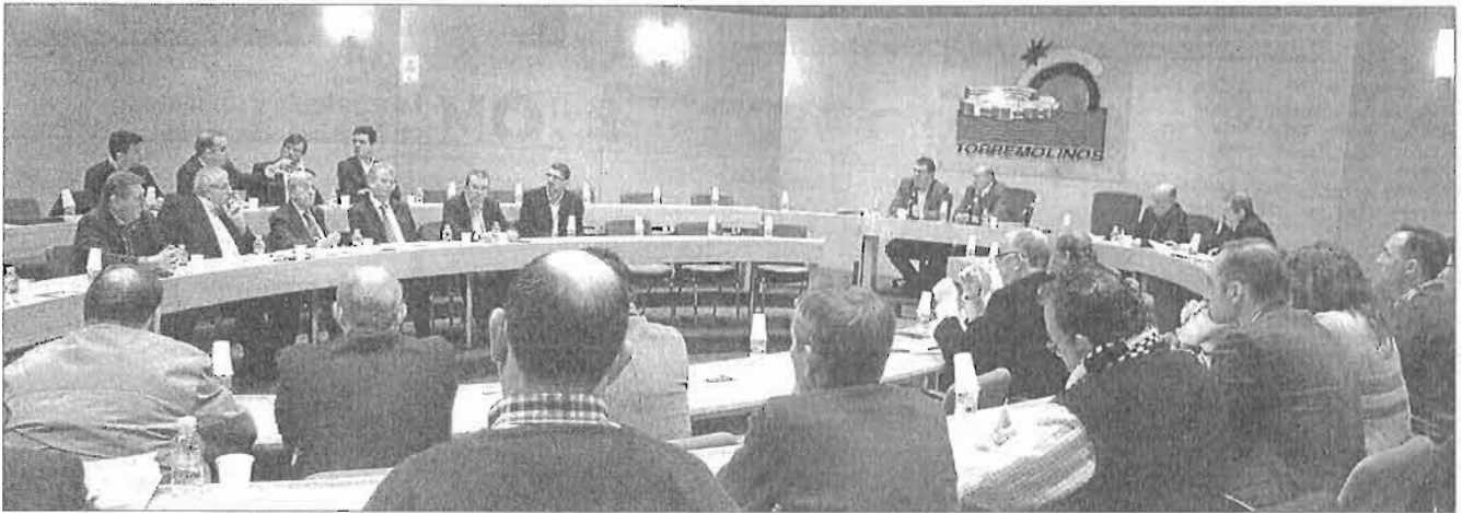
El Foro del Saneamiento Integral se celebró ayer. LA OPINIÓN

LA GUERRA DEL AGUA ► LOS ALCALDES SE REBELAN CONTRA EL RETRASO DEL SANEAMIENTO INTEGRAL Y EL POSIBLE INCUMPLIMIENTO DE LOS PLAZOS