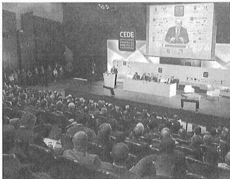
Más de 1.500 personas asistieron a un congreso de directivos españoles en el Palacio de Ferias en noviembre.

Uno de los congresos más potentes tendrá lugar a finales de este mes, pues entre el 26 de enero y