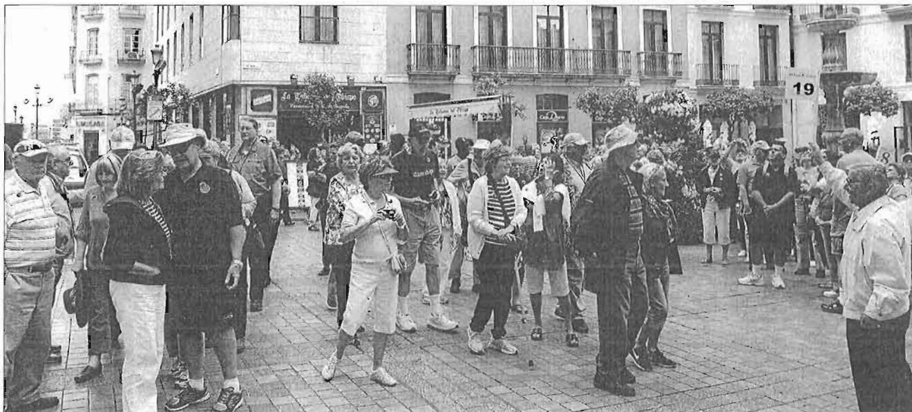
Una expedición de cruceristas pasea por el centro de Málaga. ARCINIEGA