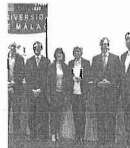
Presentación ayer