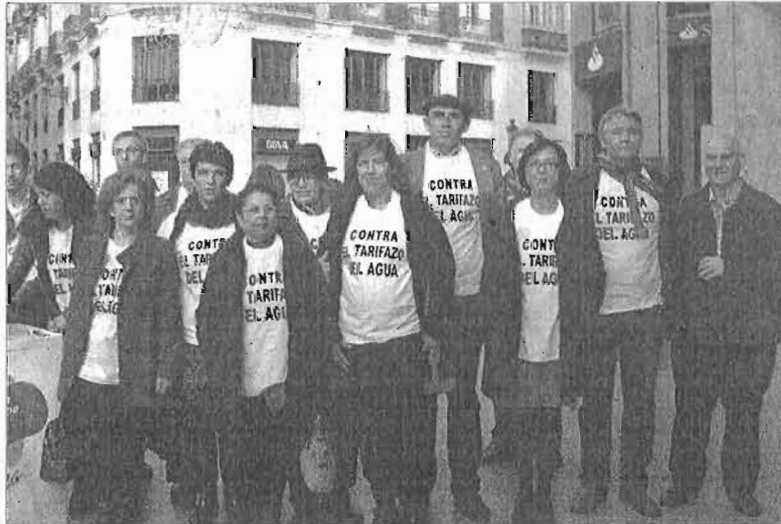
Miembros de la plataforma contra las tarifas y ediles de PSOE e IU, ayer en calle Larios.