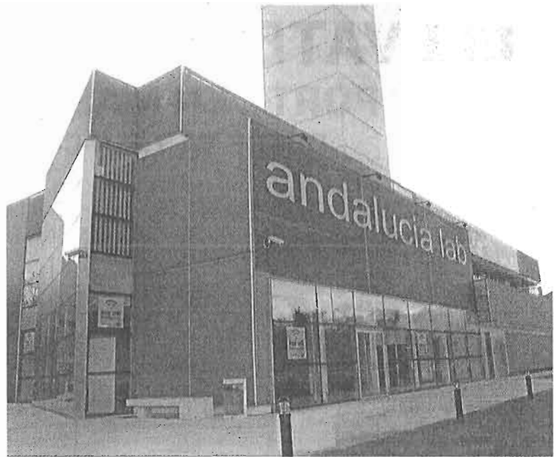
El edificio Andalucía Lab.