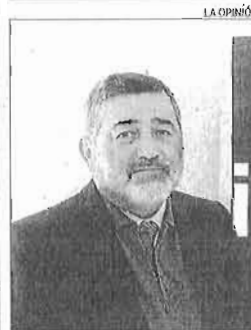
El catedrático malagueño.

El concejal de Movilidad subrayó que los nuevos horarios se pusieron en marcha a raíz de la aprobación del nuevo decreto del Sistema de Control de Accesos a Zonas Restringidas al Tráfico Rodado, después de informar a los vecinos y a las empresas distribuidoras.