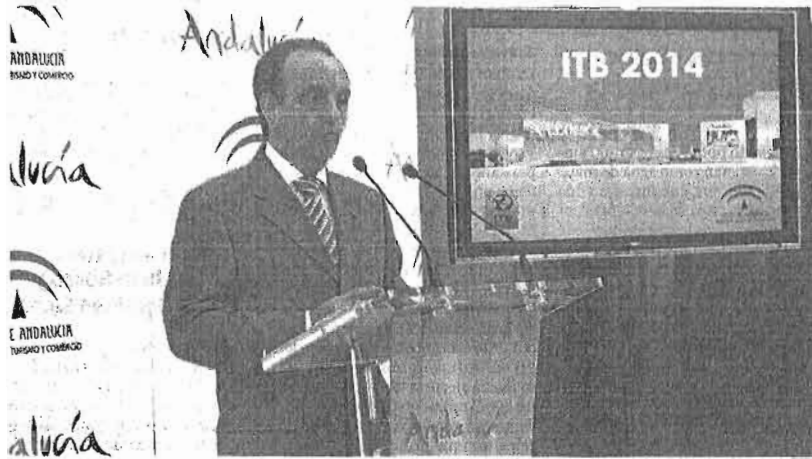
El consejero de Turismo y Comercio de la Junta presentó ayer el despliegue de la ITB.

Pero además de este aval, el consejero destacó la necesidad de sacar