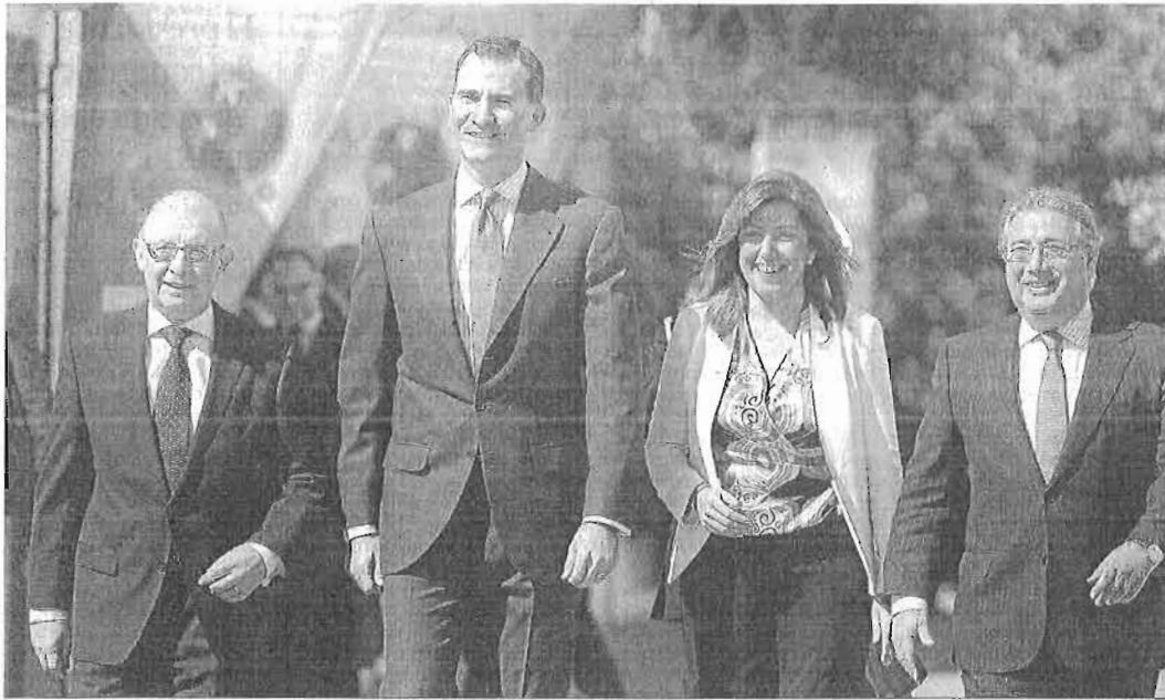
El ministro de Hacienda, Cristóbal Montoro, el príncipe Felipe, la presidenta de la Junta, Susana Díaz, y el alcalde de Sevilla, Juan Ignacio Zoido.