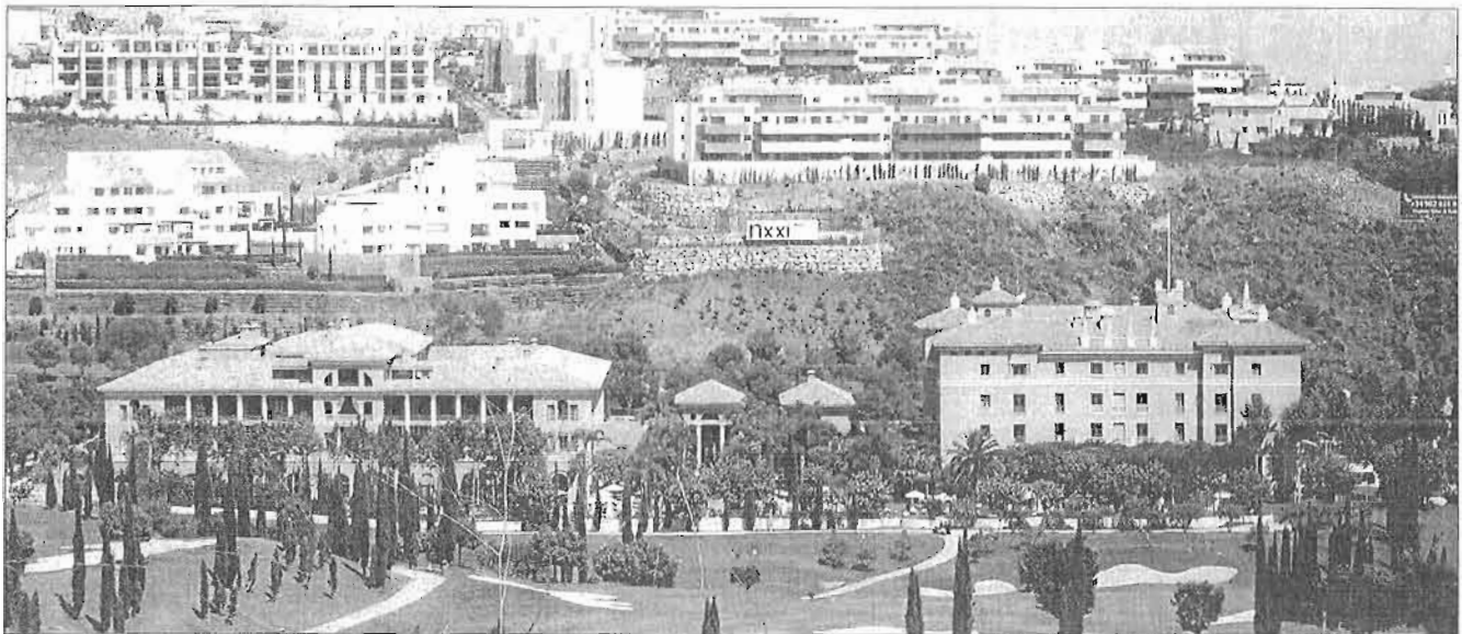
Vista de las instalaciones del hotel Villa Padlierna (en primer plano), sede de la feria inmobiliaria.