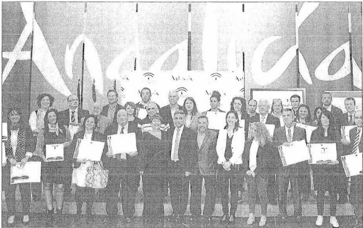
Foto de familia de los empresarios premiados por el Consorcio Qualifica. LA OPINIÓN