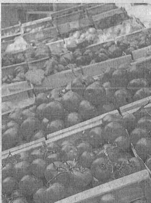
Las exportaciones de tomate son continuo foco de conflicto.

do la iniciativa española y acaba de poner en marcha la constitución de un grupo de contacto franco-marroquí de frutas y hortalizas en el marco de la primera reunión del comité mixto franco-marroquí, que tuvo lugar el pasado 11 de febrero y en la que participaron los ministros de Agricultura, Agroalimentación y Bosques de Francia, Stéphane Le Foll, y su homólogo marroquí, Aziz Akhannouch, el mismo que recibe el homenaje del gobierno español. El grupo de contacto franco-marroquí de frutas y hortalizas tiene como objetivo reforzar el diálogo entre los