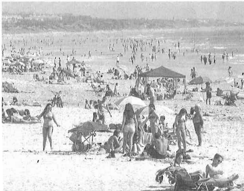
Bañistas en la playa de La Barrosa, en Chiclana.

En la Costa del Sol, Torremolinos, Marbella y Benalmádena crecen en rentabilidad