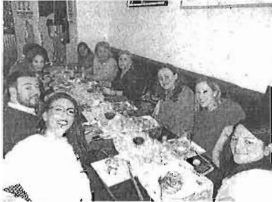
Grupo de Empresarias de Amupema.