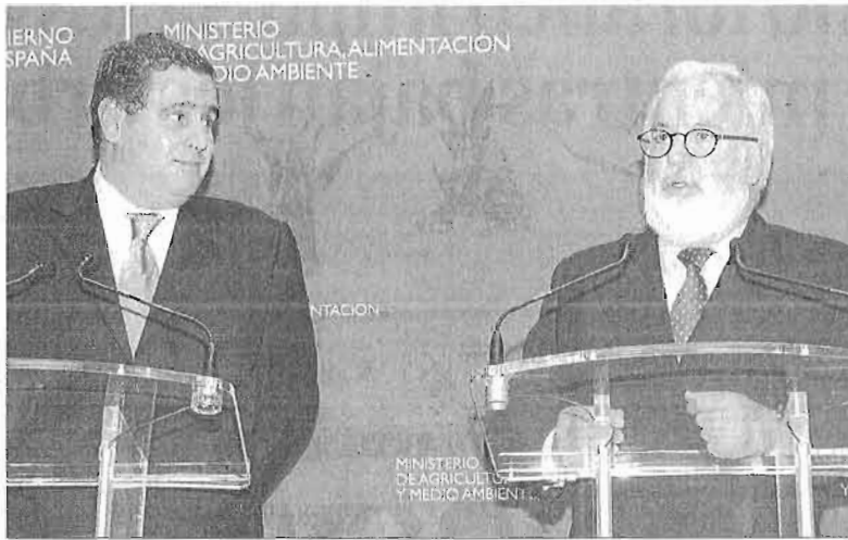
El ministro marroquí de Agricultura, Aziz Akhannouch, junto a Miguel Arias Cañete en una rueda de prensa.

"Tenemos un ministro de Agricultura, Miguel Arias Cañete, que le importa un pimiento nuestra agricultura. Es una vergüenza y lo que tiene que hacer es dejar de ofender y perjudicar a nuestro sector. Ya está bien de tener que aguantar tanta tomadura de pelo que lo único que demuestra, de nuevo, es que los acuerdos con Marruecos y la permisividad de in-