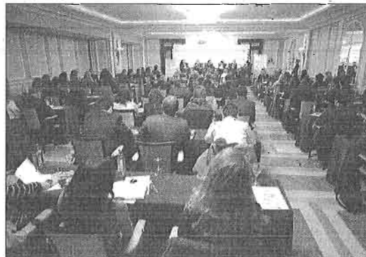
Foto de la conferencia organizada ayer por elEconomista.