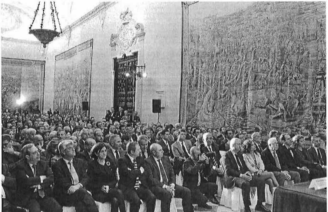
Una imagen del Salón de los Tapices del Alcázar de Sevilla durante la presentación del Anuario Joly.