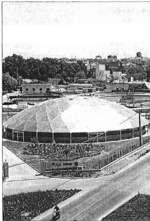
Imagen de archivo de una depuradora de Mijas.

El pasado mes de diciembre, la Consejería de Medio Ambiente y Ordenación del Territorio agilizó la programación de actuaciones previstas para 2014 incrementando la dotación presupuestaria de 4,47 millones de euros a los 18,7 mi-