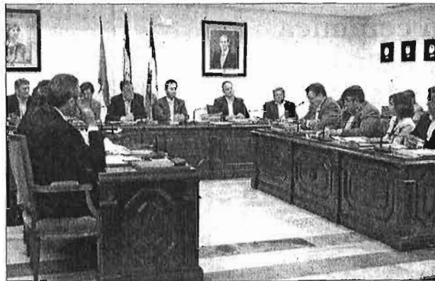
El pleno de Mijas aprobó ayer el avance del PGOU. M.A

El avance especifica todas las intervenciones necesarias para acabar con el problema de las inun-