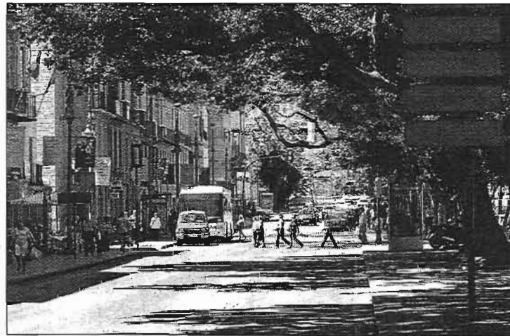
El Ayuntamiento quiere peatonalizar el lateral sur de la Alameda.