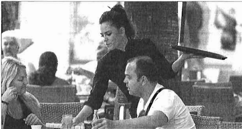
Una camarera en un establecimiento del Centro de Málaga. ÁLEX ZEA

En cuanto al perfil del demandante, la ETT recuerda que si bien los jóvenes siguen siendo uno de los mayores demandantes de empleo en esta época del año, con el inicio de la crisis, la cifra y el perfil de quien busca trabajo se ha modificado incorporando a otros colectivos como amas de casa,