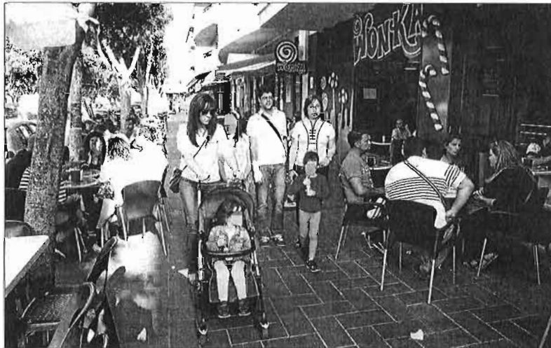
Algunos puntos de El Romeral están saturados por las terrazas y es difícil el paso para el peatón.