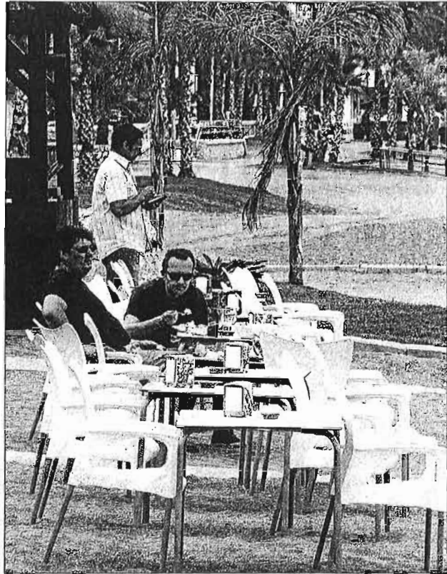
Clientes en un chiringuito de Málaga capital. ÁLEX ZEA

insistió en la necesidad de que se apruebe definitivamente el reglamento de la Ley de Costas, que permita «regularizar la situación de los chiringuitos». En ese sentido, indicó que «nos dijeron que se aprobaría antes de verano, pero nos tememos que el reglamento se aprobará a finales de verano o en otoño», de forma que siguen pendientes del reglamento.