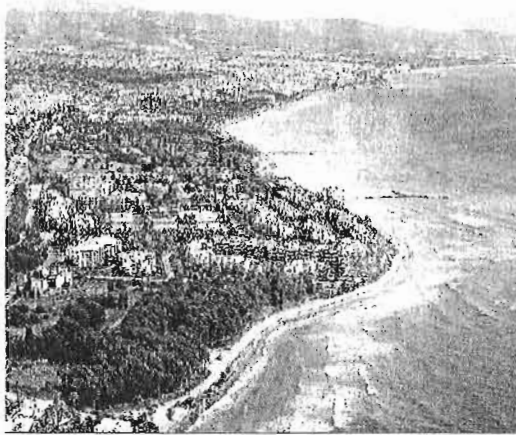
Vista aérea de la Costa del Sol.

Otras obras que ya están en fase de ejecución son el paseo marítimo de Sabinillas en Ma-