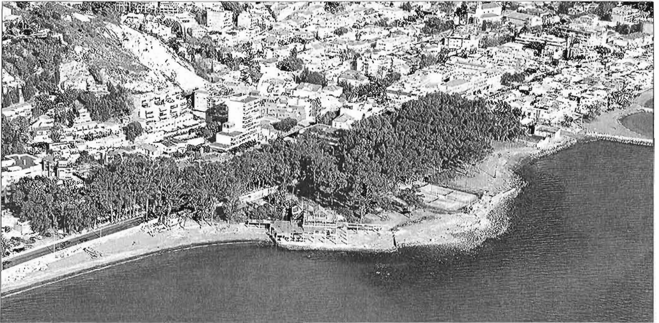
Vista aérea de los Baños del Carmen, cuya reforma y recuperación se lleva planteando en los últimos 30 años. OMAU