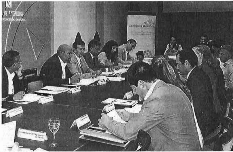
Un momento de la reunión de ayer del consejo rector del consorcio del Plan Qualifica.