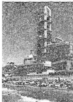
Torre de la fábrica.

«La prueba de lo que decimos es que los auditores externos llevan años certificando que cumplimos con todos los parámetros legales. En ningún momento hemos incumplido las normas», insistió Ochoa de Eribe, quien recordó que existe un control continuo para valorar las emisiones que se emiten a la atmósfera desde la