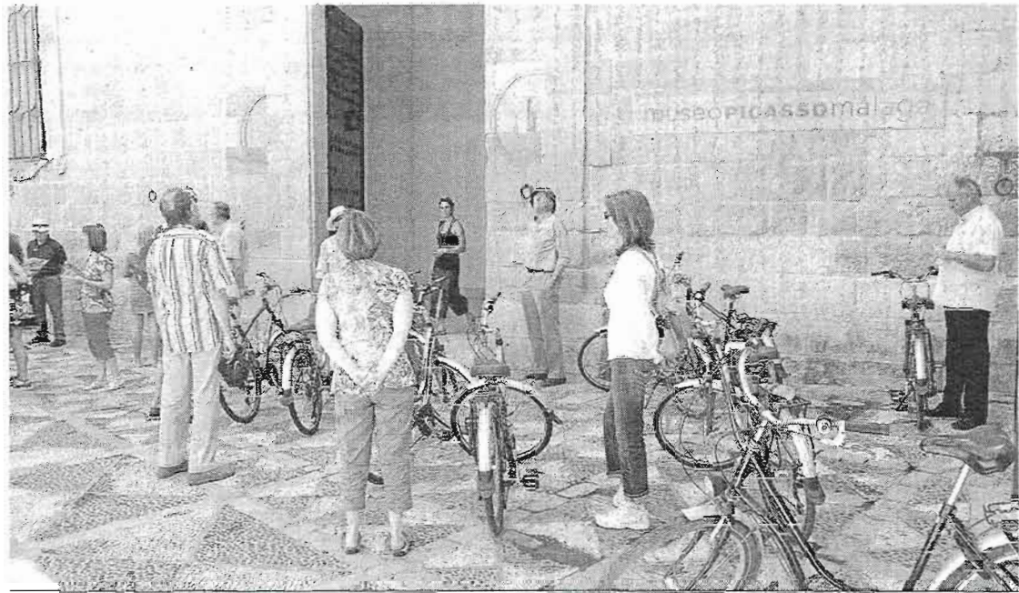
Varios turistas en la puerta del Museo Picasso.

ce de los datos turísticos de la capital registrados entre enero y mayo y son muy positivos. En esos cinco meses se han alojado en los hoteles de la ciudad 407.155 viajeros, lo que supuso un 13,3% más que en el mismo periodo del año anterior. Ha crecido tanto el turista internacional, un 14,6%, como el nacional, un 11,8%, siendo éste último el más esperado ya que, con la crisis económica, el mercado interior español estaba siendo el más rezagado.