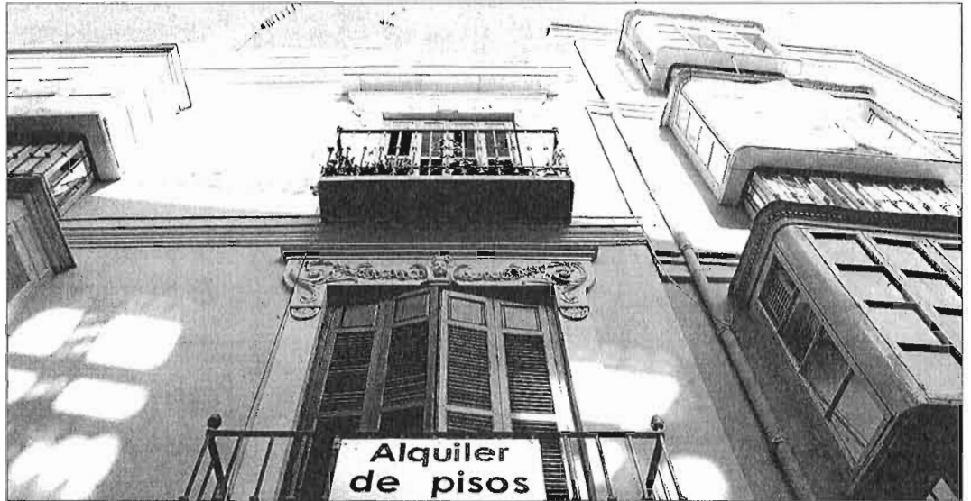
La oferta de apartamentos turísticos sube en la capital. ARGENIEGA

El interés por los apartamentos se justifica en unas expectativas de negocio que tienen en la evolución de Málaga su máxima garantía. En los últimos años, la ciudad, que hasta principios de siglo apenas contaba para la industria, se ha transformado hasta convertirse en uno de los destinos urbanos del país con mejor prensa y mejores números. Los especialistas coinciden en dibujar para los próximos años un horizonte sólido y, especialmente, optimista, al que también se suma la confianza incipiente y planetaria en fórmulas alternativas de hospedaje para cierto perfil de turista. Los datos generales avalan que la oferta extrahotelera no ha decaído. En la Costa del Sol, en los primeros cinco meses del año, ha sumado dos millones de pernотaciones, un 20,1 por ciento más que en 2013,