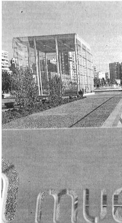
Imagen de archivo del edificio del 'Cubo'.

Otro de punto abordado ayer fue el otorgamiento y concesión administrativa para la ocupación y explotación de la planta alta del Instituto de Estudios Portuarios, edificio situado en la entrada al recinto portuario desde la Plaza de la Marina. Según fuentes próximas a la reunión, la concesión ha recaído sobre la fundación Andalucía Emprende, dependiente de la Junta. El acuerdo, al parecer por diez años, reportará al puerto unos 56.000 euros anuales.