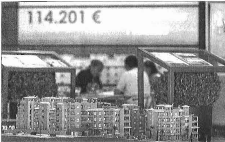
El sector inmobiliario en la provincia continúa sin pulso. ARCINIEGA