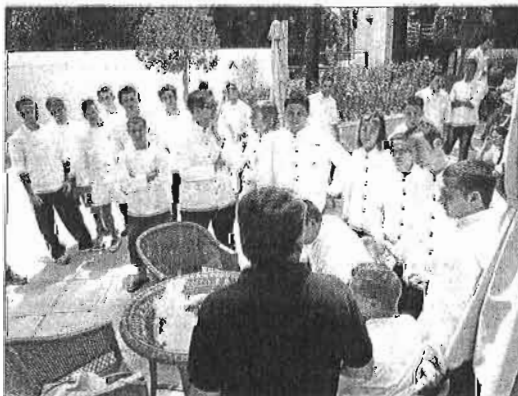
Alumnos de La Cónsula en una concentración en el centro. ARCINIEGA

Así, de la especialidad de Cocina se han presentado 267 inscripciones, según indicaron a Europa Press fuentes de la escuela, mientras que de Sala han