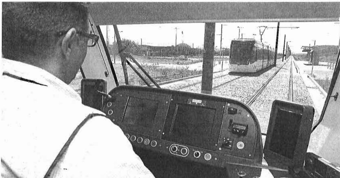
Un tren del metro, justo antes de cruzarse con otro en el sentido contrario, ayer en la zona de Teatinos.