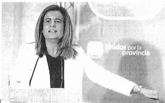
Fátima Báñez, ministra de Empleo.

M. Serraller/M. Valverde. Madrid Las empresas deberán cotizar a la Seguridad Social más de lo esperado. Así lo establece el Proyecto de Real Decreto que modifica el régimen de cotizaciones que ha elaborado el Ministerio de Empleo, al que ha tenido acceso EXPANSIÓN. Finalmente, las empresas tendrán que cotizar por casi todos los conceptos salariales, a pesar de la fuerte oposición de las patronales. La norma, que estudia el Consejo de Estado y que debe estar en vigor el 1 de agosto, establece incluso que deberán cotizar las primas de antigüedad y la educación de los hijos de empleados de centros educativos, que se esperaba que quedarán al margen.