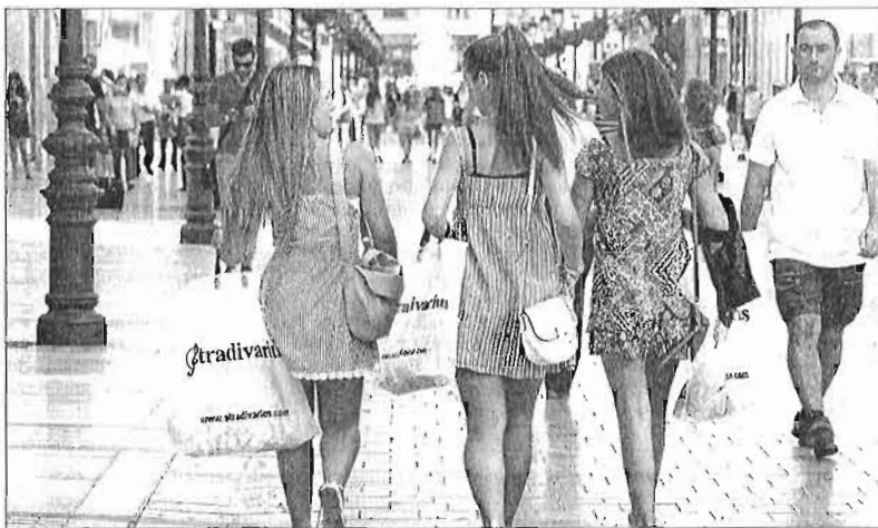
Clientes en el Centro de Málaga durante la campaña de rebajas del pasado verano. ÁLEX ZEA

«Eso hace vislumbrar que este año sea el último que conserve el espíritu real de las rebajas, que tanto tiempo costó definir y consolidar a comerciantes y consumidores», lamentaron. El comercio de proximidad comienza las rebajas confiando en obtener resultados aceptables tras los últimos datos po-