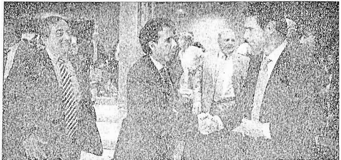
El ministro de Productividad de Perú, Piero Gleizes, junto a José Manuel Soria y Juan Roselló durante el encuentro empresarial inPerú .

Bajo el marco del Road Show , celebrado la pasada semana en Madrid, y organizado por inPerú junto a Confiep (Confederación Nacional de Instituciones Empresariales Privadas de Perú), CEOE (Confederación Española de Organizaciones Empresariales) y Telefónica, en declaraciones a elEconomista Blanco explicó que son este conglomerado de empresas las que "van a experimentar crecimientos exponenciales de ingresos y ventas en Perú, especialmente aquellas que se enfocan en aprovechar el déficit estructural de modelos de negocio basados en la clase media, como ase-