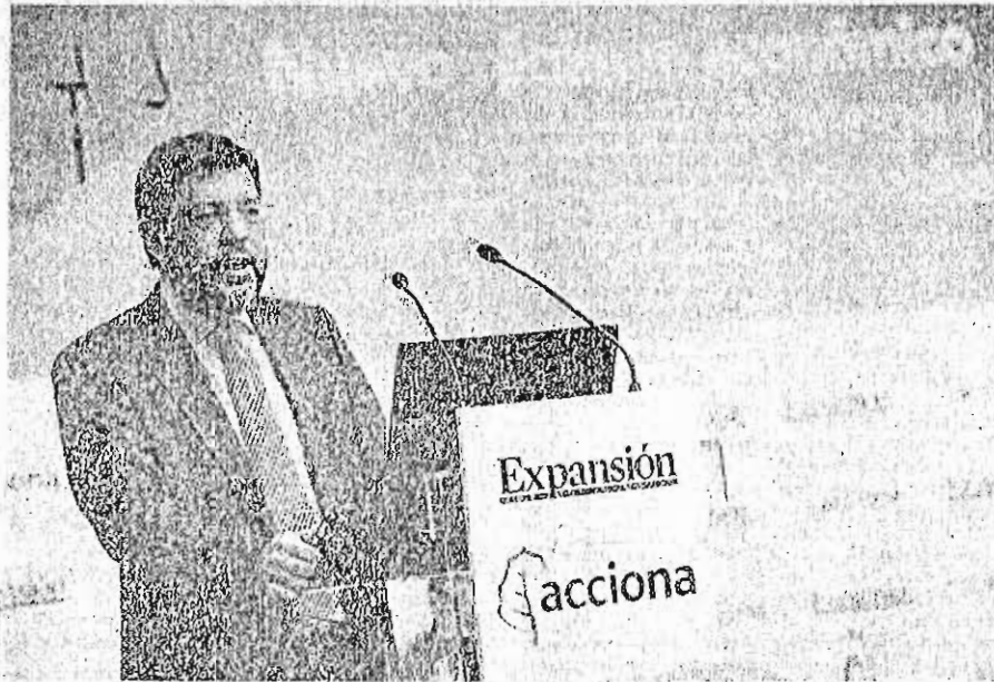
Alberto Nadal, secretario de Estado de Energía, ayer en las jornadas organizadas por EXPANSIÓN sobre renovables en Madrid.

Del total de deuda de las renovables, 20.000 millones están en manos de la banca española