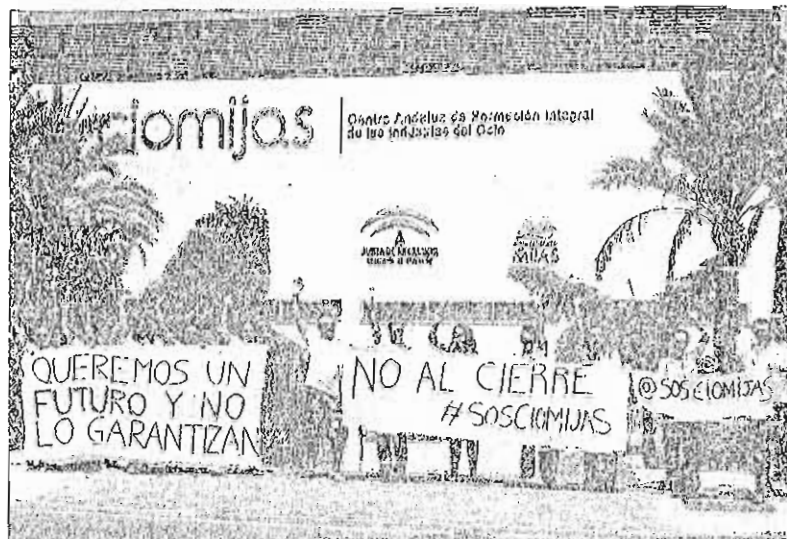
Imagen de una de las protestas de los alumnos de CIOMijas, este verano. C. O.

La delegada de Educación, Patricia Alba, afirmó ayer a este periódico que entiende la postura de los alumnos: «Me ha sido materialmente imposible reunirme con ellos porque el inicio del curso escolar ha absorbido todo mi tiempo.