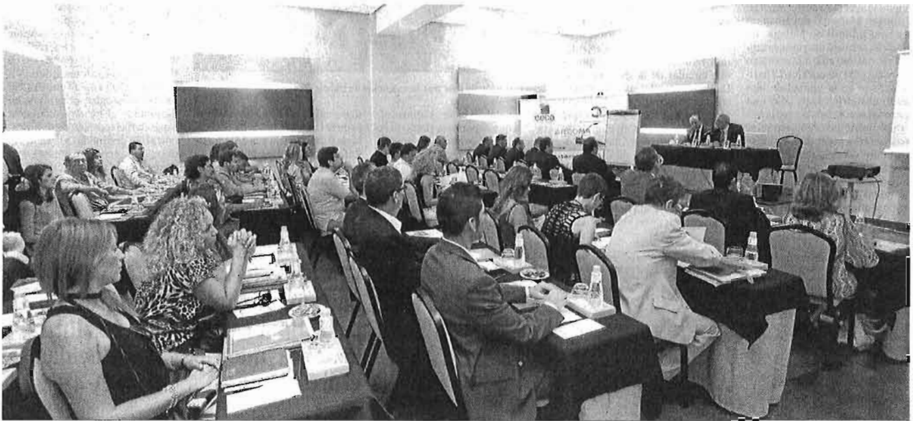
Presentación de la jornada sobre retos y estrategias en el sector del comercio organizado por Fecoma en colaboración con Santalucía Seguros.