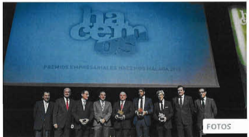
FOTOGALERÍA Foto de familia de los premiados tras la entrega.

La cooperativa farmacéutica Cofarán fue fundada hace 50 años con el objeto de mejorar el abastecimiento por parte de los laboratorios a las oficinas de farmacia. En la actualidad cuenta con 800 socios y su ámbito geográfico se extiende además de Málaga, a Córdoba, Cádiz, Sevilla, Granada y Melilla. En términos de facturación se sitúa como la cuarta empresa malagueña, y es la primera