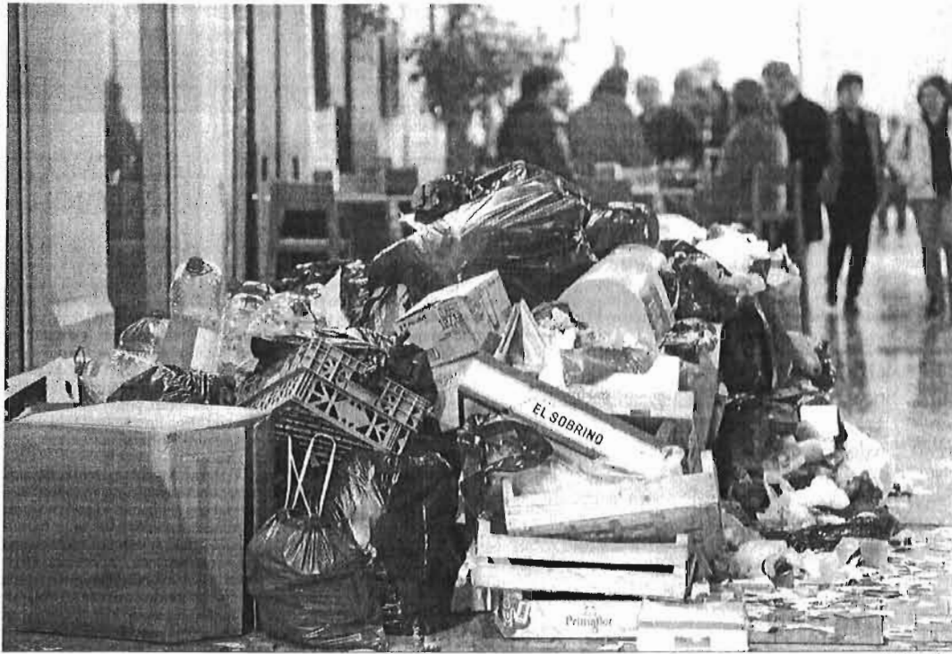
Basura acumulada en un contenedor del centro durante la huelga que tuvo lugar en diciembre de 2013.