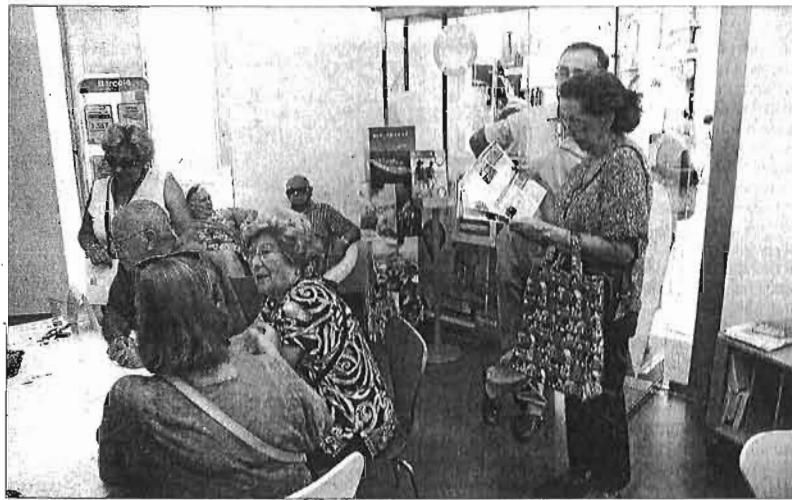
Un grupo de mayores consulta destinos e información en una agencia de viajes.

Los viajes del Imsero, que aportan clientela en el invierno, convirtiéndose, incluso, para muchos hoteles en la única razón del mantenimiento de la actividad en este periodo, comenzaron este ejercicio con retraso por el desajuste en la adjudicación de los lotes. Finalmente, y después de la impugna-