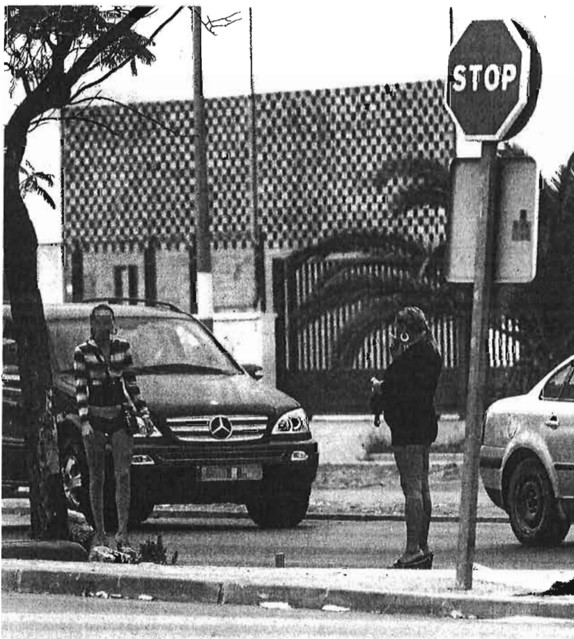
Los empresarios confían en que las cámaras disuadan a los clientes de la prostitución.

Aunque de momento la videovigilancia únicamente se implantará en estos tres parques empresariales, el Ayuntamiento y la Asociación de Polígonos de Málaga (Apoma) sigue insistiendo en su expansión al resto. Por ello, el Consistorio formalizó hace justo un año una nueva petición ante la Delegación del Gobierno central en Andalucía para la instalación de cámaras en los parques empresariales de San Luis, Santa Teresa, Santa Cruz, Trévez, La Estrella, El Viso, Alameda, La Huertecilla y Villa Rosa. De momento, aún no hay noticias.