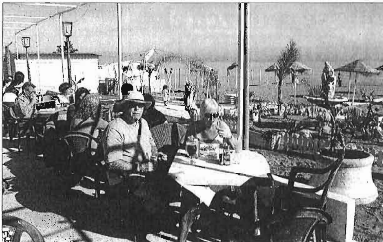
Varios turistas disfrutan de la gastronomía malagueña en un chiringuito de la Costa. L. O.