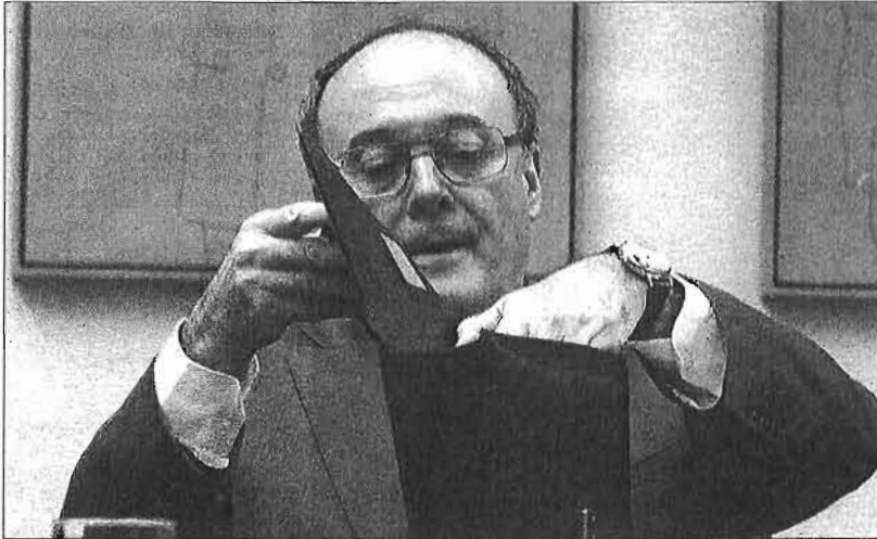
Luis María Linde, gobernador del Banco de España.

En ese documento, los socialistas se comprometen a solicitar a la Comisión Europea un año más de plazo —hasta 2017— para que España coloque el agujero de las cuentas públicas por debajo del 3 por ciento. La senda de reducción del déficit fijada por nuestros socios establece un tope del 2,8 por ciento en 2016. La semana pasada, las autoridades comunitarias ya habían recordado a nuestro país que todavía tiene por delante un ajuste fiscal de 8.000 millones de euros este año. De hecho, Bruselas alertó de que incumpliríamos el límite establecido a causa, principalmente, del aumento del gasto público.