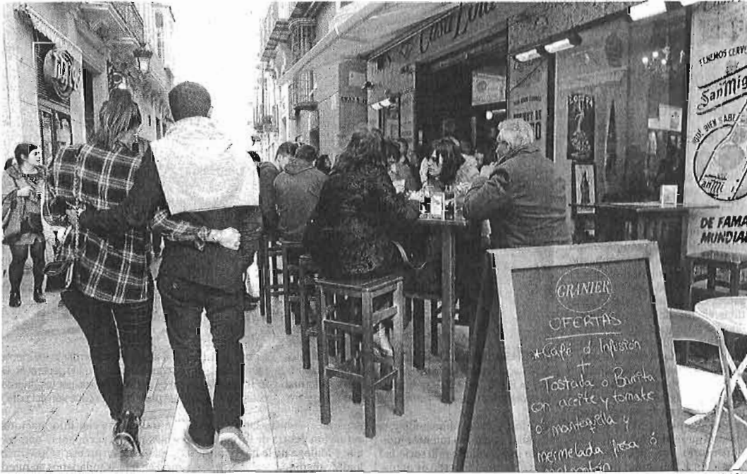
Terrazas de los bares de la calle Granada este pasado fin de semana.

● Las asociaciones Amares y Mahos plantean hoy en una reunión con empresarios las primeras medidas de presión contra el modelo de ocupación que promueve Urbanismo