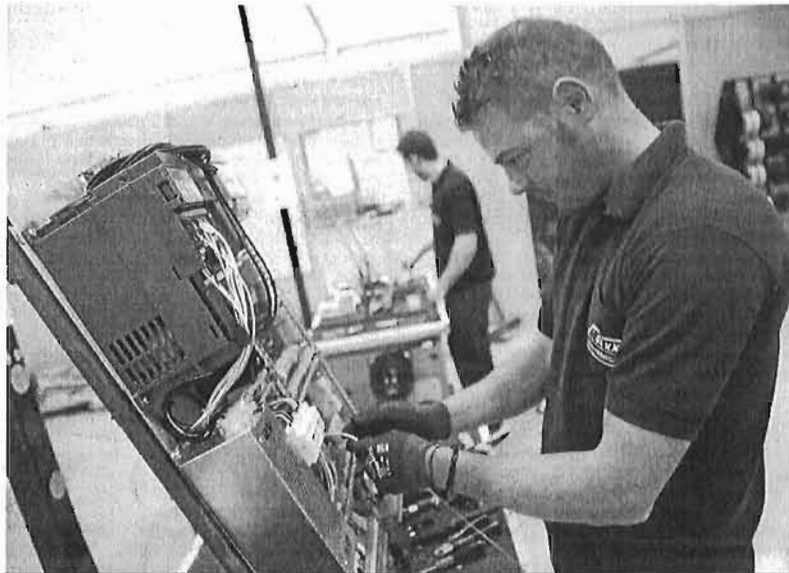
Dos empleados en una empresa malagueña.

Es la cuarta provincia española con mayor dinamismo tras Madrid, Barcelona y Valencia