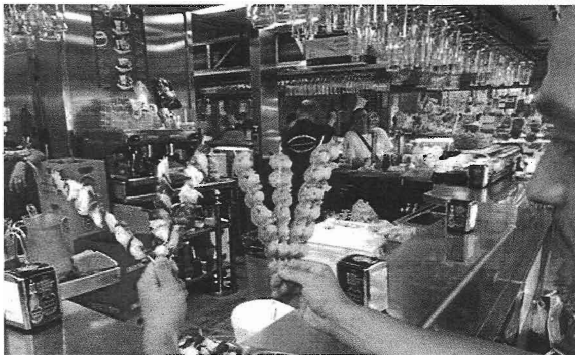
Los negocios quieren abrir en Semana Santa y Feria en horario ininterrumpido.

En el escrito sostienen que el mercado es un lugar «muy valorado por los malagueños por la variedad, calidad y cantidad de productos frescos» y que se ha convertido «en el espacio más auténtico y popular para disfrutar con la oferta de pescaito frito y mariscos, una