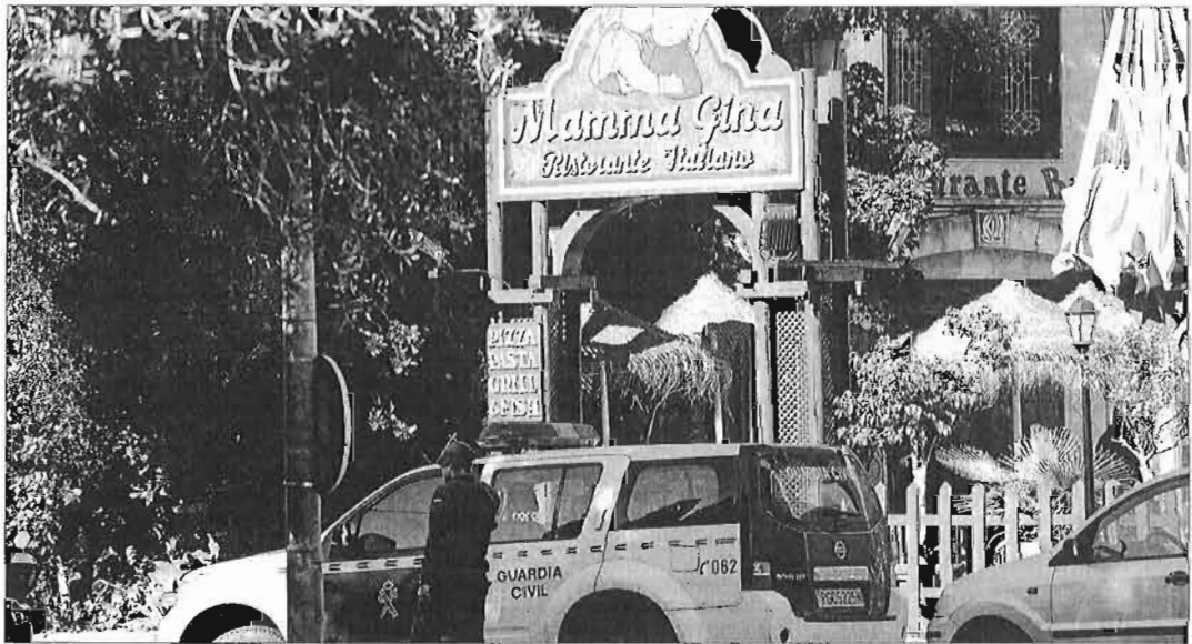
Uno de los establecimientos registrados ayer en Marbella.

Los registros, al menos siete que se centraron primero en las oficinas que el grupo tiene sobre una de sus pizzerías, en una asesoría fiscal y una entidad bancaria localizada en la avenida Ricardo Soriano de Marbella, permitieron a los investigadores intervenir numerosa documentación relacionada con la contabilidad de las empresas, material informático y cerca de 250.000 euros en efectivo que localizaron en una de las cajas fuertes, según fuentes cercanas a una investigación que trata de demostrar un gran movimiento de dinero en efectivo presuntamente sin declarar. Tal y como adelantó La Opinión de Málaga en su edición digital de ayer, los especialistas buscaron, entre otras pruebas, un software de contabilidad que permitiera al grupo ocultar parte de los beneficios, aunque su hallazgo no pudo ser confirmado. Las pesquisas, sin embargo, no son nuevas y bajo la lupa fiscal hay más de 200 cuentas bancarias vinculadas a un gran entramado societario que se aproxima a las 40 empresas, al parecer algunas de ellas con sede en Gibraltar que podrían tener empleados como administradores. Los registros se extendieron también a la vivienda habitual