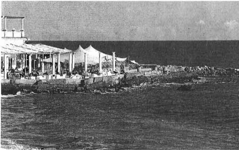
Vista general de la terraza del restaurante de los Baños del Carmen.

Urbanismo detecta unas obras sin licencia municipal mientras los dueños acusan a la Junta de no atender sus peticiones para frenar el deterioro de la zona