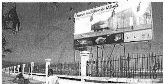
Espacio en el que estaba previsto el proyecto.

proyecto básico y de ejecución con la idea de retomarlo en el futuro. Ahora, la Administración municipal también quiere hacerse definitivamente con los terrenos, y sin contraprestación alguna. En esta línea, en la comisión plenaria de Ordenación del Territorio se aprobó (con la única abstención de Ciudadanos) volver a pedir a la Autoridad Portuaria la cesión gratuita de la parcela. Todo ello apenas unas semanas después de que ambas administraciones acordaran la constitución de una mesa de trabajo para definir los usos, en principio, de la parte occidental del muelle de San Andrés. Esta nueva petición se incluyó como enmienda en una moción presentada por IU-Málaga para la Gente en la que se pedía la reafirmación del