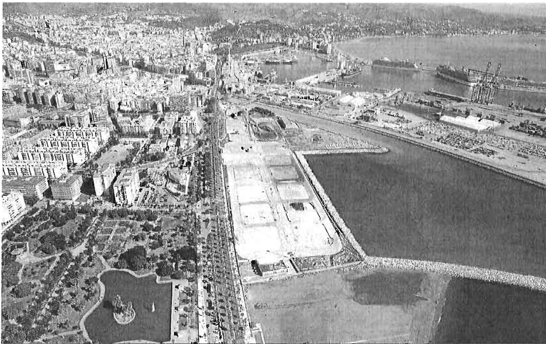
Vista aérea de los suelos portuarios en San Andrés.

● Pomares avala la propuesta, al tiempo que defiende la apertura de un debate, junto a la Autoridad Portuaria, sobre los posibles usos alternativos en el resto de terrenos de San Andrés