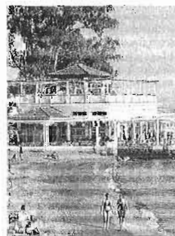
Baños del Carmen.