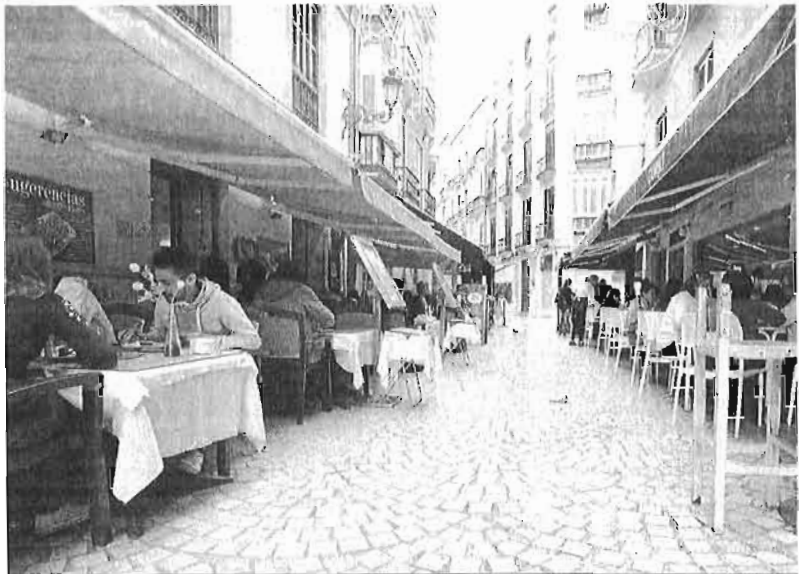
Ocupación con mesas y sillas de una de las calles del centro.

Sí fue confirmada, como una de las "tres principales novedades", la posibilidad de suspender temporalmente, por entre 10 y 30 días, las autorizaciones de las terrazas de los establecimientos que ocupen más espacio del que tienen autorizado o incumplan los apercebimientos que reciban. Una intervención que formaba parte del escrito de aportaciones de Urbanismo, cuyos técnicos ponían el acento en que "con una hora de servicio de esa mesa demás se abona la sanción y se obtienen además claros beneficios".